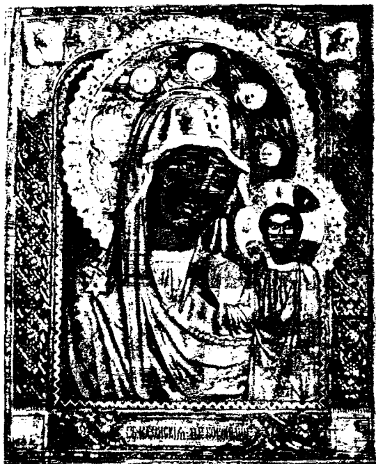
Изображеніе чудотворной Казанской Святогоровой иконы Божіей Матери.