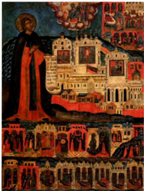
Иосаф Каменский Икона. Прп. Иосаф Каменский в житии., нач. XVIII в. Тотемское музейное объединение.

богатые земельные вклады в обитель, а его супруга великая княгиня Мария приписала к ней монастырь св. Николая Чудотворца на Святой Луке. Этими земельными пожалованиями было положено начало благосостоянию монастыря.