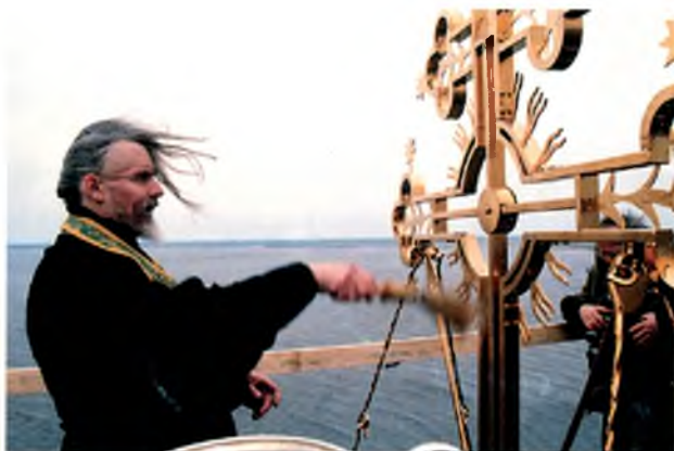
Освящение креста. Архиепископ Вологодский и Великоустюжский Максимилиан освящает крест на Успенской колокольне Спасо-Каменного монастыря. 2003 г.

До конца 50-х годов на острове действовал пункт по приему и переработке рыбы, а с середины 60-х годов остров с остатками монастырских корпусов пришел в полное запустение.