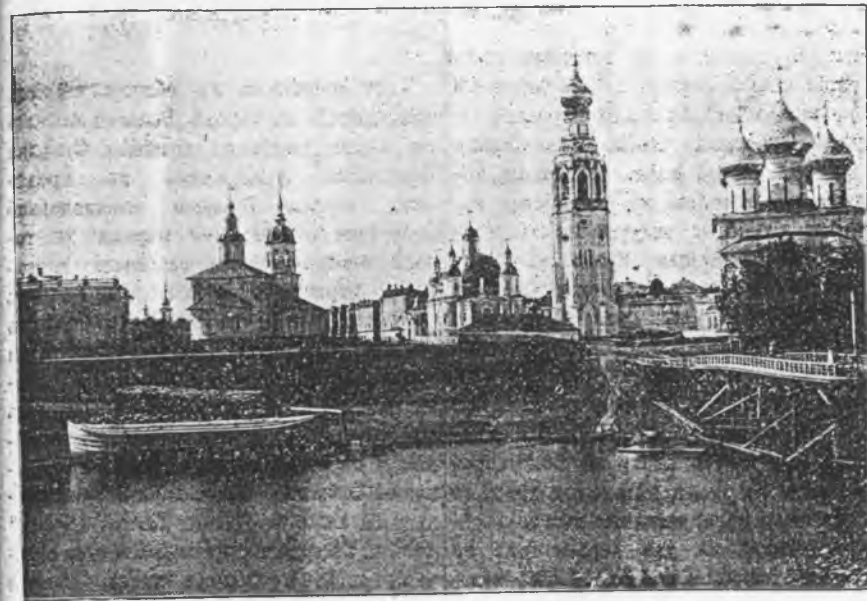
Вологодскій каедральный соборъ.—Зимній храмъ.—Колоколыня.—Лѣтній храмъ.

гя, когда въ трапезной воспоминается трогательное отвѣтное заочное привѣтствіе преподобнаго проѣзжавшему мимо святителю Стефану;—отъ редактора „Троицкихъ Листковъ“, архимандрита Никона, который выслалъ въ Вологду 10 тысячъ образковъ святителя Стефана для бесплатной раздачи народу. Вечеромъ того же дня владыка получилъ еще привѣтствія: отъ архіепископа Ярославскаго Іоаннана, отъ управления врем-