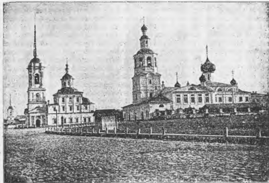
Церковь Всемилостиваго Спаси (обшденная).

Члены комиссіи по устройству празднованія 500-лѣтія кончины святителя Стефана, подъ предѣтельствомъ о. ректора Вологодской духовной семинарии архимандрита Василія, старательно и съ любовью отнеслись къ устройству празд-