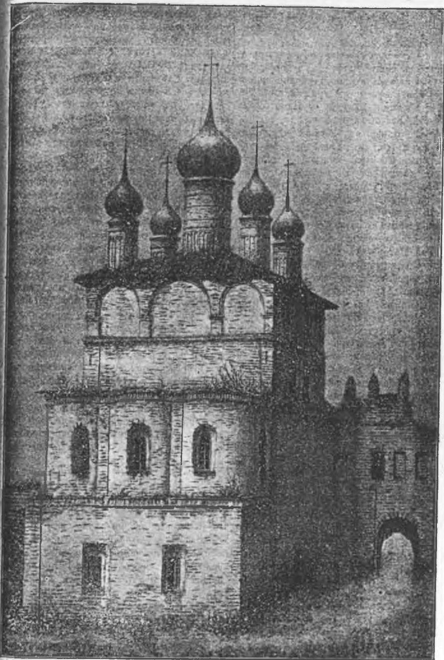
Видъ Григорьевской церкви въ Ростовскомъ кремлѣ въ 40-хъ годахъ настоящаго столѣтія.

Въ храмѣ Григорія Богослова сохраняются: часть мощей святаго Артемія Веркольскаго и гробовая доска преподобнаго Григорія Нельшемскаго, съ изображеніемъ на ней угодника Божія (даръ преосвященнаго Израіля, епископа Вологодскаго); въ числѣ старинныхъ иконъ обращаютъ на себя вниманіе: огромный образъ Спасителя изъ упраздненной въ XVII вѣкѣ Спасской пустыни; образъ Божіей Матери „Неоцалимой купины