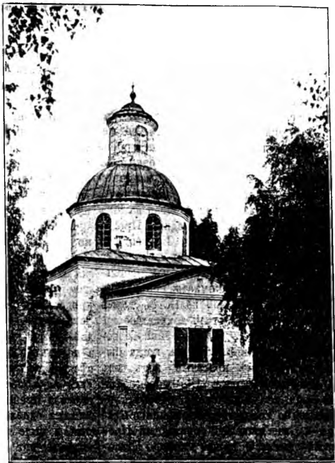
Часовня на мѣстѣ паденія «каменной тучи».