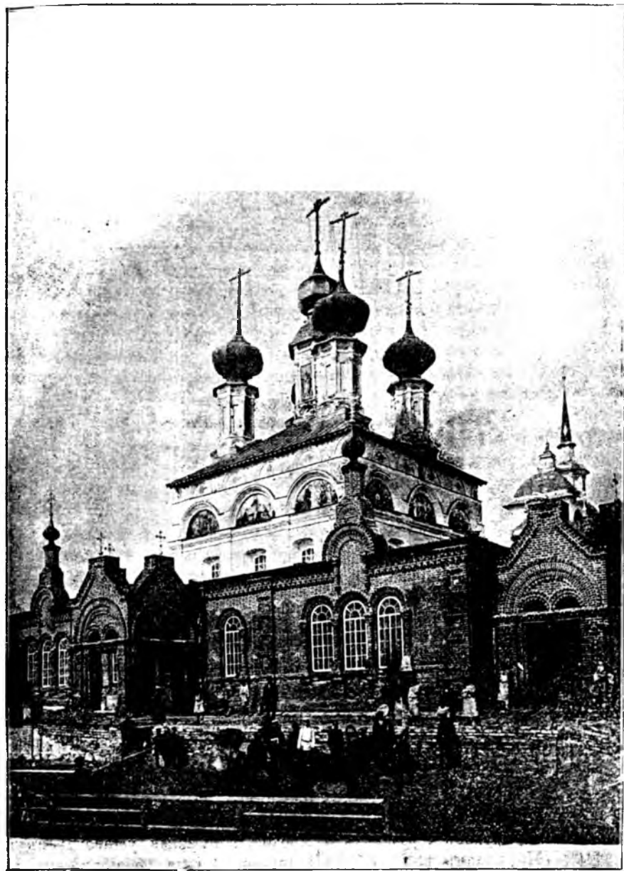
Прокопѣвскій соборъ въ гор. Великомъ Устюгѣ.