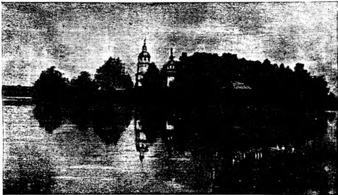
Видъ Ягановскаго храма съ южной стороны.