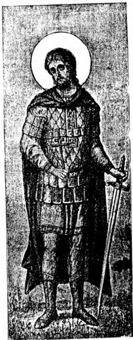
Св. муч. Никита.