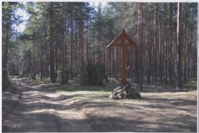
Поклонный крест на месте разрушенной часовни в честь преподобного Евфросина Синозерского рядом с прудом (освящен в 2006 году).