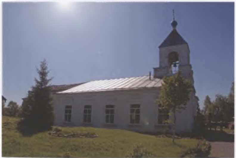
Храм Покрова Пресвятой Богородицы в пос. Сазоново Чагодощенского района. Здесь на церковном кладбище похоронен протоиерей Григорий Яковлевский.