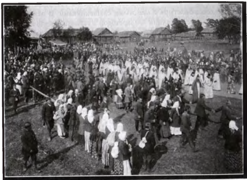
Крестный ход в 1912 году.