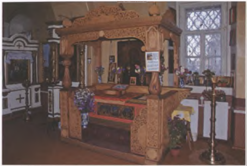
Рака с мощами преподобного Евфросина Синозерского в храме Казанской иконы Божией Матери г. Устюжна Вологодской области.