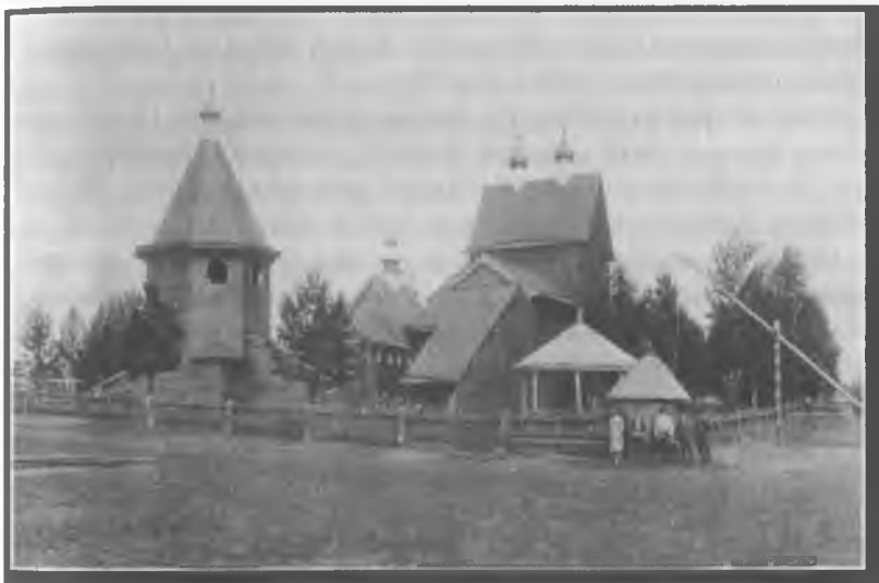
Храмовый комплекс Синозерской пустыни.