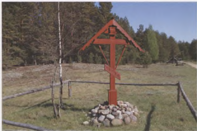
Поклонный крест на месте убийства преподобного Евфросина Синозерского (освящен в 2005 году).