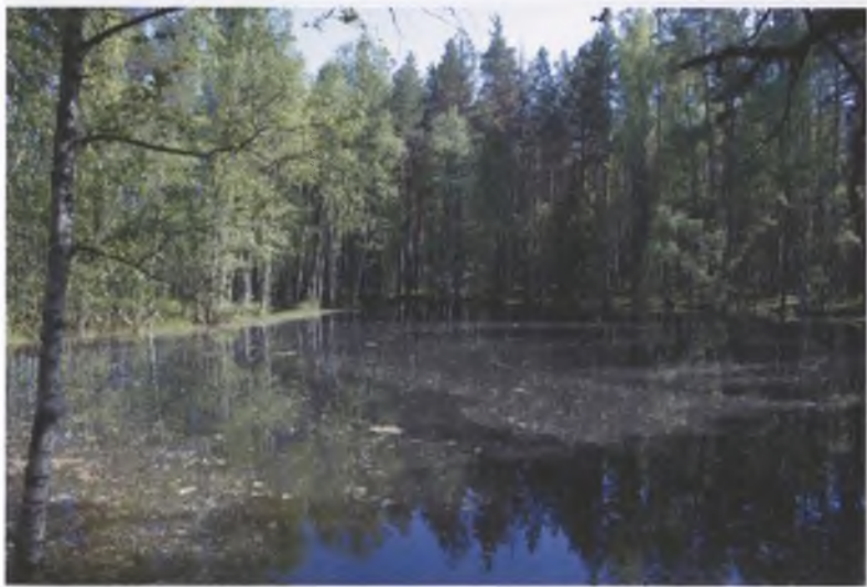
Пруд, который был ископан преподобным Евфросимом Синозерским.