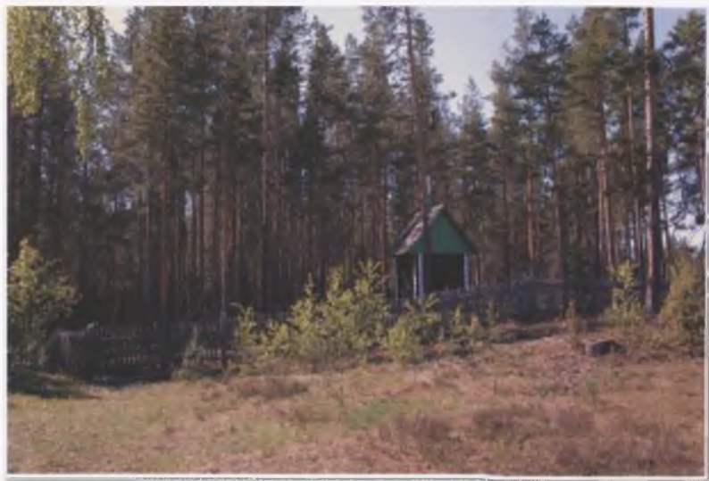
Часовня на месте старой Синозерской пустыни (освящена в 2002 году).