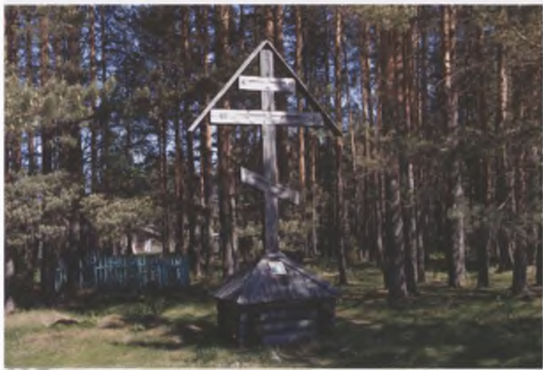
Поклонный крест на старом кладбище Синозерской пустыни.