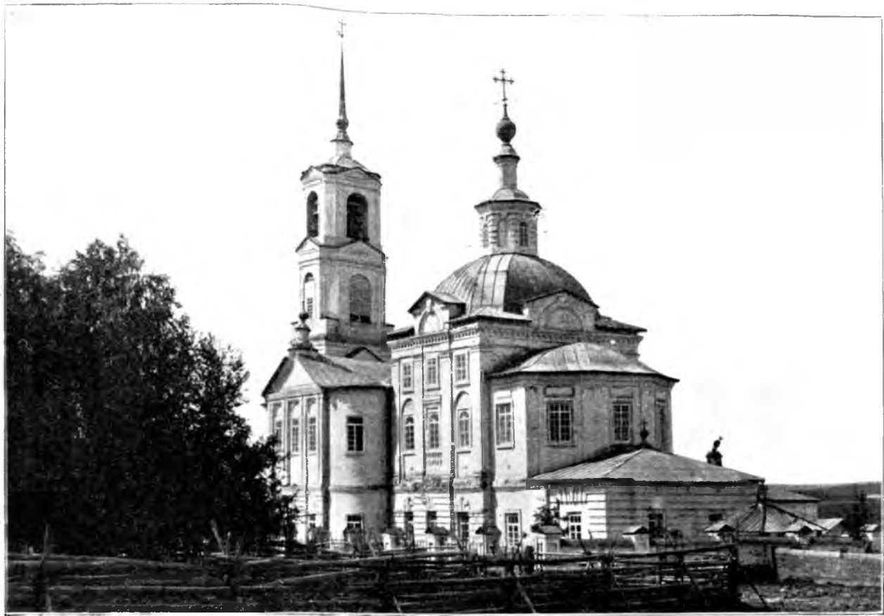
Ильинская церковь въ селѣ Кобыльскомъ (на рѣкѣ Югу) Никольскаго уѣзда, Вологодской губерніи, съ юго-восточной стороны; за алтаремъ погребены о. Василій Михайловичъ и о. Михаилъ Васильевичъ Поповы (рядомъ), а немного дальше къ юго-востоку теща Платонида Матвѣевна Глубоковская (урожденная Ивановская).