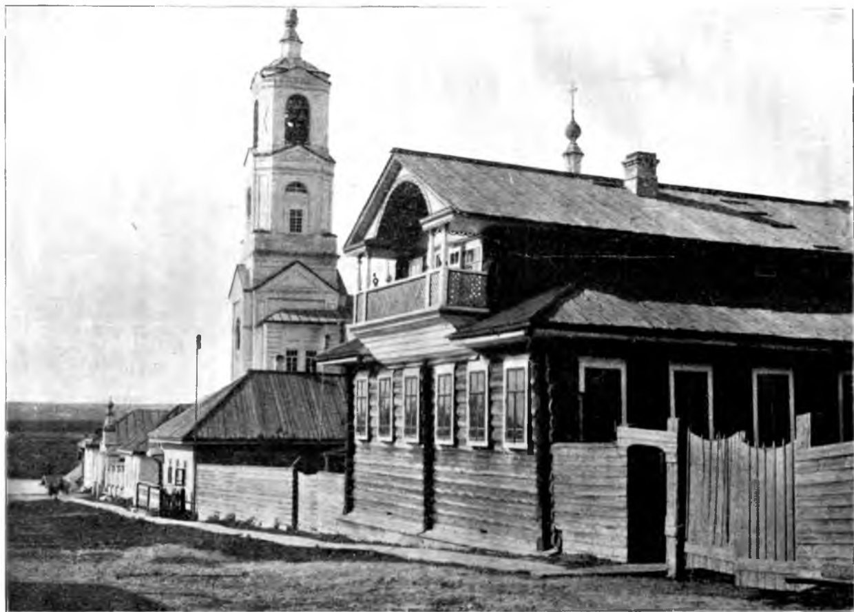
Домъ о. Михаила Васильевича Попова съ юго-западной стороны; нѣтъ большой флигель для его матери, церковная сторожка, Кобыльско-Ильинская церковь и церковно-приходская школа. По фотографическому снимку Н. Головина отъ понедѣльника 17-го юня 1902 года.