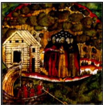
Сказание о Спасо-Каменном монастыре. Фрагмент рукописи XV в.