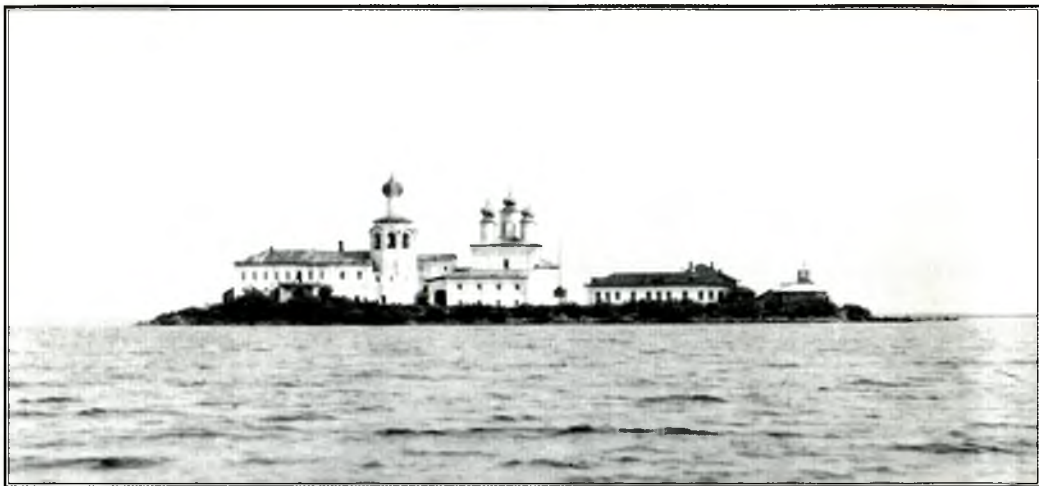
Спасо-Каменный монастырь с юга. Начало XX в.

духовной школой для многих подвижников, и выходцы из него — Дионисий Глушицкий, Александр Куштекский, Евфимий Сянжемский, в свою очередь, основали новые обители на побережье Кубенского озера.