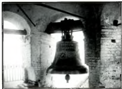
Один из уцелевших колоколов. 1926 г.

Монастырские здания кроме надвратного храма были отремонтированы. На колокольне установили новый кованый крест, прекрасно сохранившийся до наших дней как память о возобновлении монастыря.