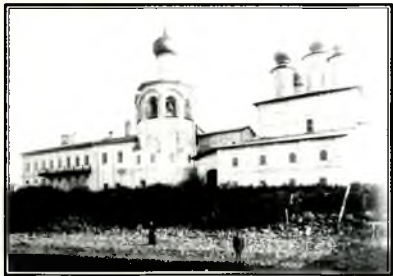
Спасо-Каменный монастырь. Начало XX в.

Через несколько лет обитель вновь отстроилась. В 1481 году на средства Вологодского князя Андрея Меньшого, сына великого князя Василия Васильевича Темного, был возведен каменный Спасо-Преображенский собор. «Первый каменный и первый по красоте!» — восклицает автор «Сказания». Для украшения собора белый камень привозили из Твери со Старицких карьеров. Кирпичи для сооружения храма изготовлялись вручную. Возводила собор артель ростовских зодчих.