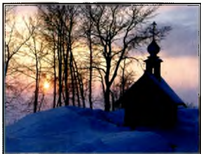
Часовня во имя всех Вологодских святых