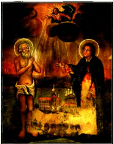
Икона «Преподобный Иоасаф и блаженный Василий Каменские». XVIII в.