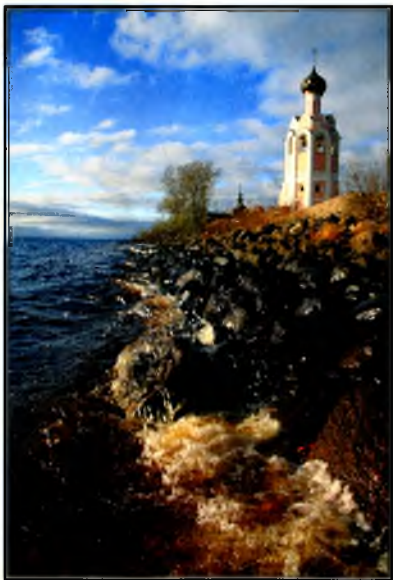
Отреставрированная колокольня и Успенская церковь

В 1812 году в монастыре нашли убежище сорок иноков московских монастырей, удалившихся из своих обителей при нашествии Наполеона. Во время трехлетнего пребывания здесь они надстроили на прежних одноэтажных кельях каменный братско-настоятельский корпус и подвели его под одну крышу с трапезной палатой, а также устроили прекрасный иконостас в Успенской теплой церкви.