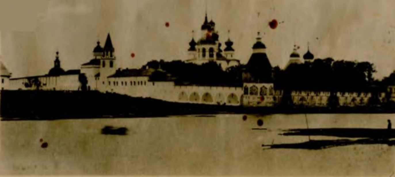
Видъ Вологодскаго Спасо-Прилуцкаго монастыря съ сѣверо западной стороны.