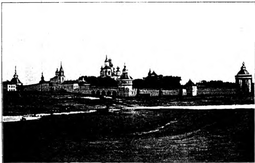
Видъ Спасо-прилущкаго монастыря съ р. Вологды.