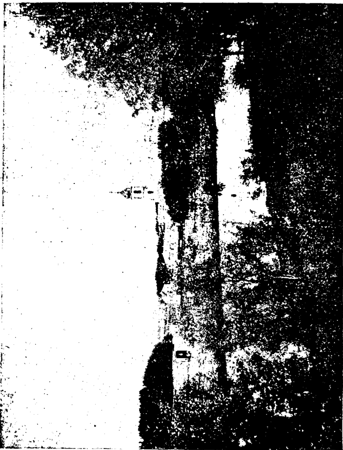
Павло-Обнорскій монастырь Вологодской епархіи.

Дорога ровная, гладкая, но пыльная, да и слѣпни одолѣваютъ. Проѣхавъ скучный и довольно гряз-