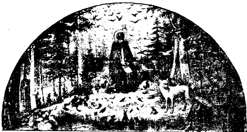
Преп. Павелъ среди птицъ и лѣсныхъ звѣрей; слѣва преп. Сергій Нуромскій.

Феодоровна. Высокая привѣтливость и ярко сквозившее во всѣхъ движеніяхъ высокорелигіозное чувство Царственной паломницы оставило глубокое, неизгладимое впечатлѣніе въ сердцахъ насельниковъ обители, съ величайшею радостью вспоминающихъ объ этомъ высокомъ посѣщеніи. Здѣсь невольно вспоминаются восторженные рассказы о томъ-же