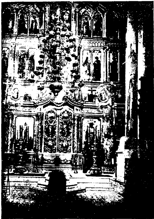
Новый иконостасъ монастыря преп. Павла Обнорскаго.

него обласканные и надѣленные либо добрымъ со- вѣтомъ и словомъ утѣшенія, либо св. образкомъ и назидательною книжкою, либо вкуснымъ монастыр-