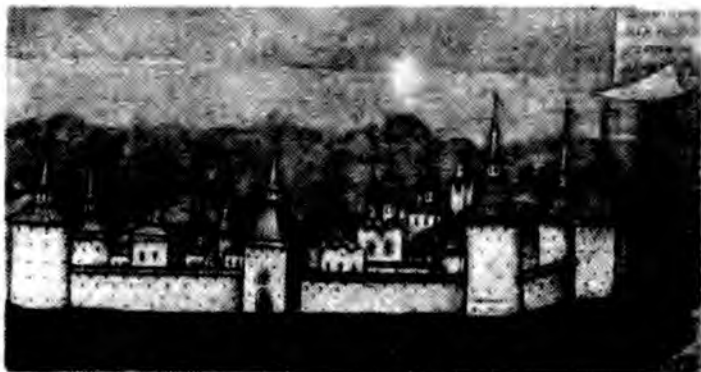
Кирилло-Белозерский монастырь. Фрагмент иконы «Кирилл Белозерский». XVIII век.

Успенский монастырь получил свое название по наименованию собора. В 1497 г. ростовский мастер Прохор с двадцатью помощниками в пять месяцев возводит Успенский собор, ставший третьей каменной постройкой в обширных северных землях. Поздние постройки и прилепив-