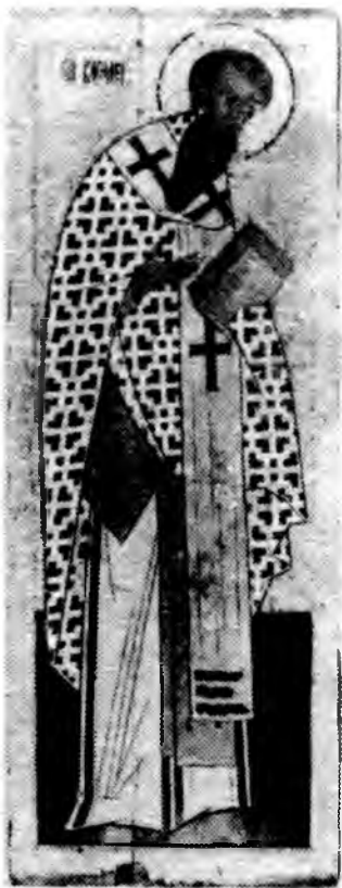
Дионисий. Икона «Василий Великий». XVI в.

о создании крепости, где можно укрыться во время народной смуты.