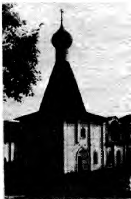
Церковь Евфимия. 1653 г.

В XVII в. в монастыре уже строят преимущественно местные зодчие. Братья Костоусовы возводят в 1643—1644 гг. строгое и лаконичное по формам здание Больших больничных палат в Успенском монастыре. Палаты крыты перехо-