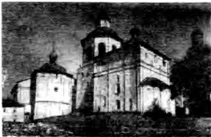
Церковь архангела Гавриила. 1531—1534 гг. Колокольня 1757—1761 гг. Церковь Введения с трапезной палатой. 1519 г.

дом соединялись с ц. Евфимия, известной под названием Никоновской. По преданию патриарх Никон, отбывавший ссылку в Ферапонтовском монастыре, а с 1676 г. переведенный в Кирилло-Белозерский, явил право молиться только в этой церкви.