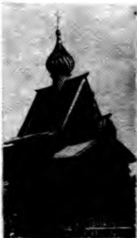
Церковь Ризположения села Бородава. 1485 г.

В 1500—1502 гг. собор Рождества Богоматери в Ферапонтовском монастыре украшают фресковой живописью прославленный иконописец Дионисий с сыновьями. Они же создают иконостас собора. В экспозиции находятся некоторые иконы местного, дейсусного и пророческого чинив иконостаса. Вопрос авторства в данном случае очень сложен, но несомненным творением Дионисия является икона «Василий Великий», поражающая необычайной одухотворенностью, изысканностью образа святого, тонким линейным ритмом, красотой светлой живописи.