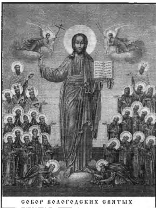
СОБОР ВОЛОГОДСКИХ СВЯТЫХ