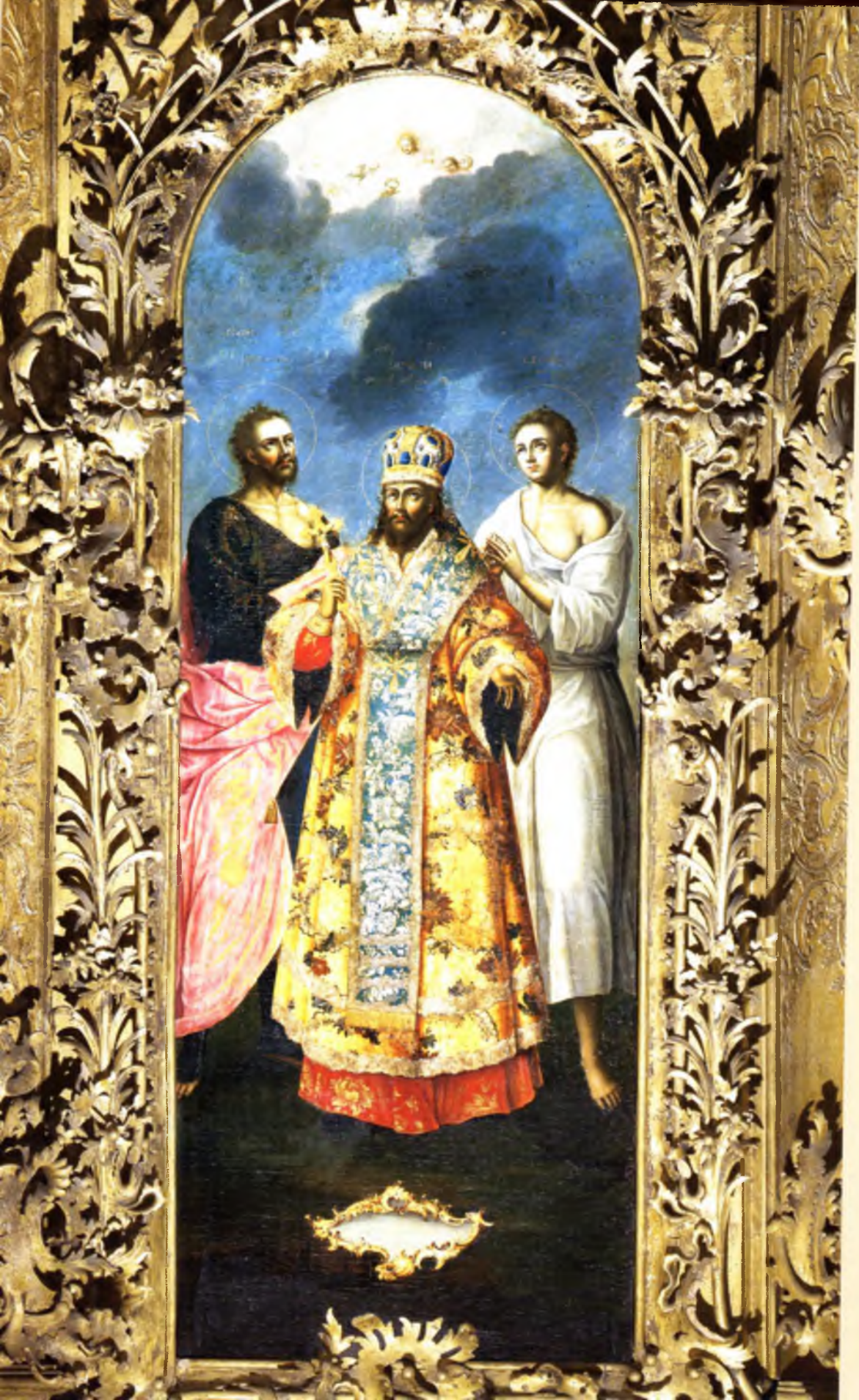
Святые Проконий Устюжский, Димитрий Ростовский, Иоанн Устюжский Алексей Колмогоров 1777 год Местный ряд (№ 10)