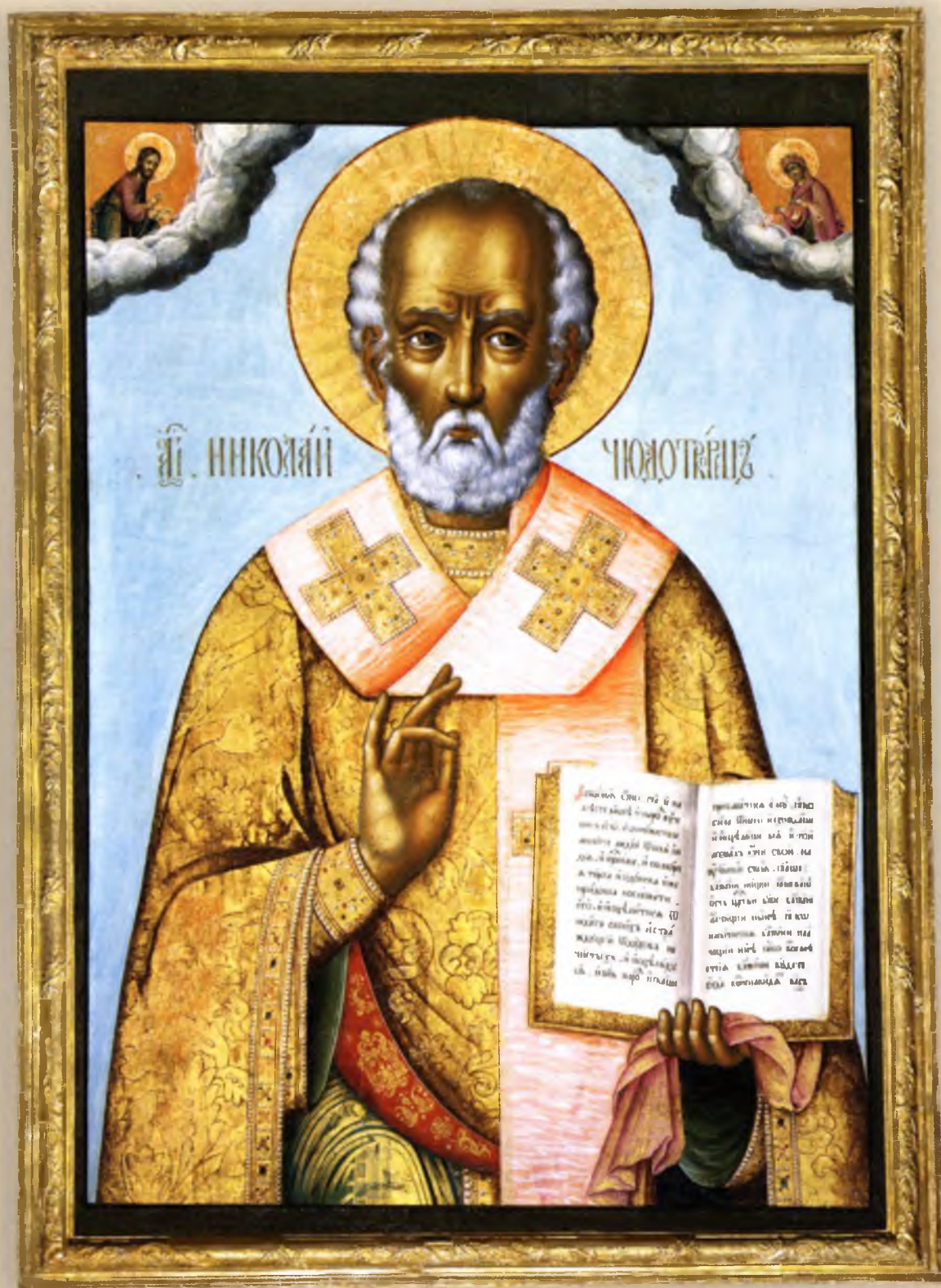
Святитель Николай Чудотворец Конец XVII — начало XVIII века Местный ряд (№ 13)