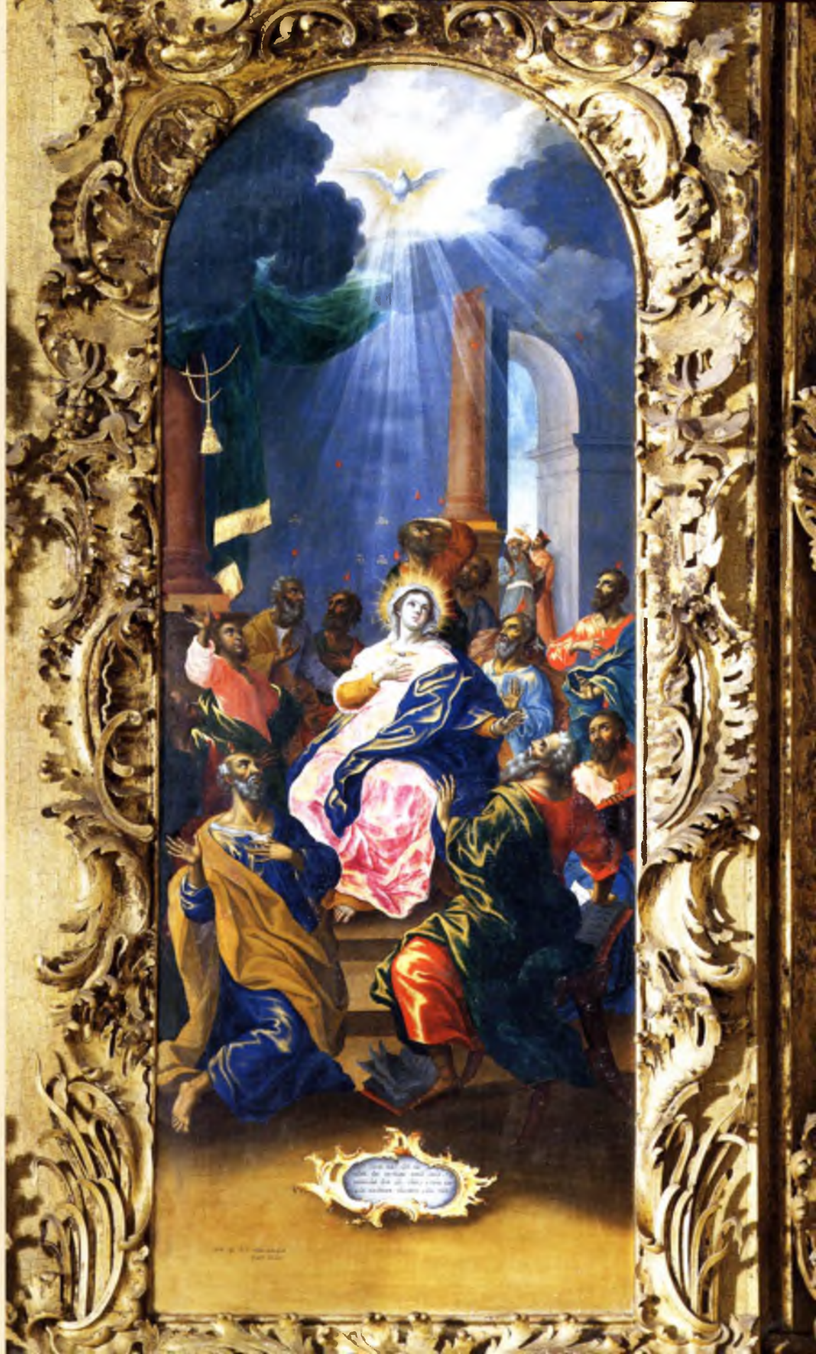
Сошествие Святого Духа Алексей Колмогоров 1778 год Местный ряд (№ 7)