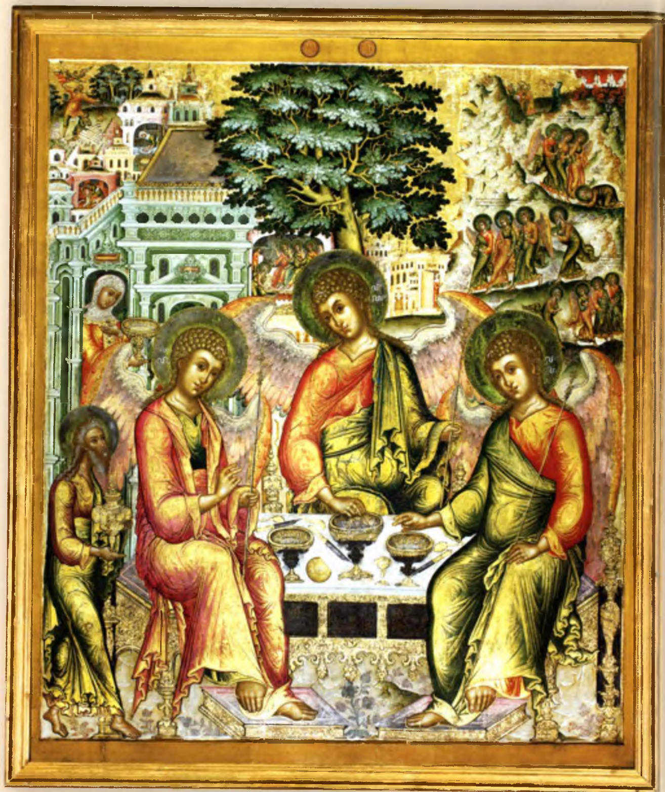
Троица Ветхозаветная, с Деяниями Вторая половина XVII века Местный ряд (№ 14)