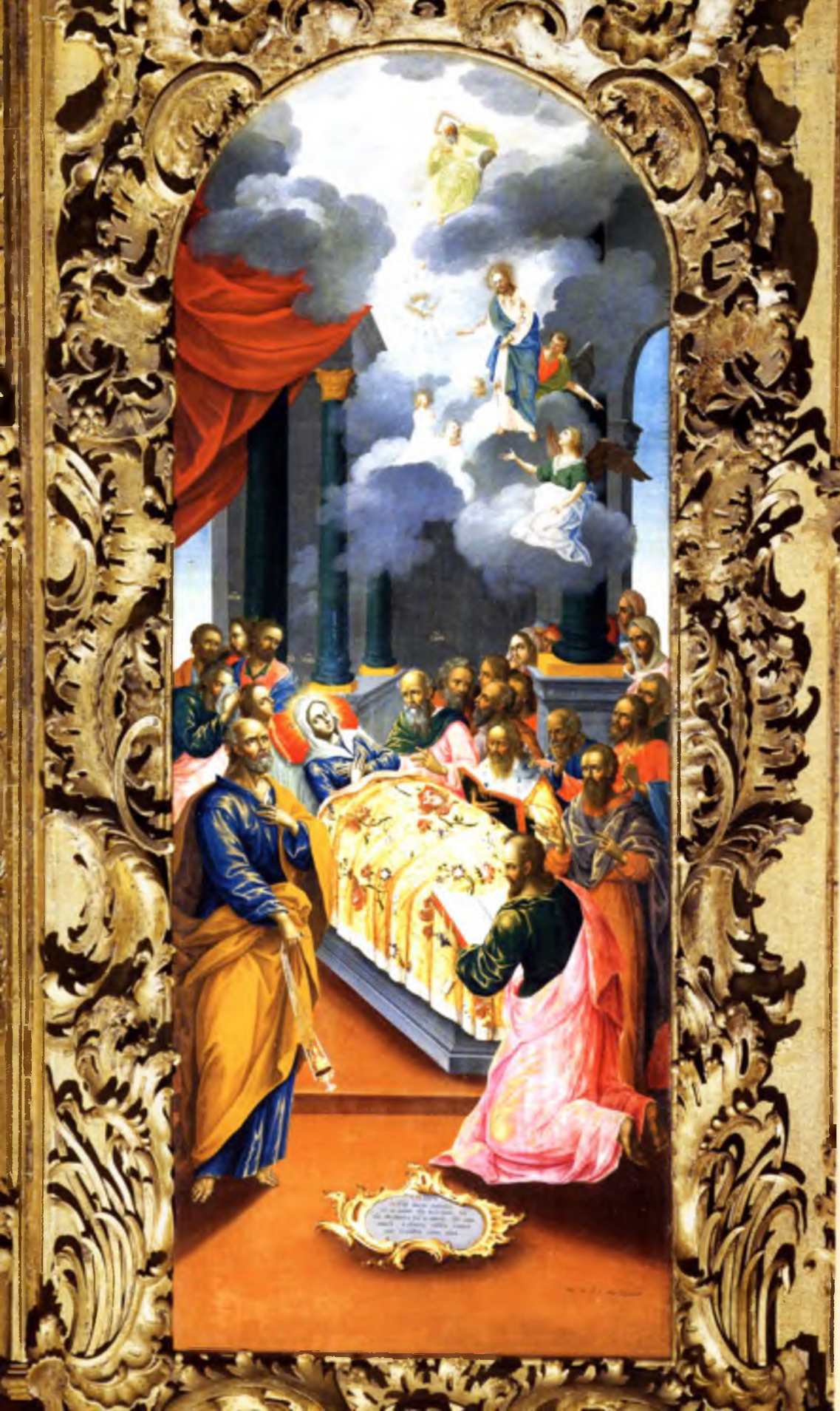
Успение Богоматери Алексей Колмогоров 1778 год Местный ряд (№ 6)