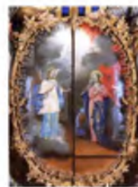
«Благовещение». Деталь Царских врат