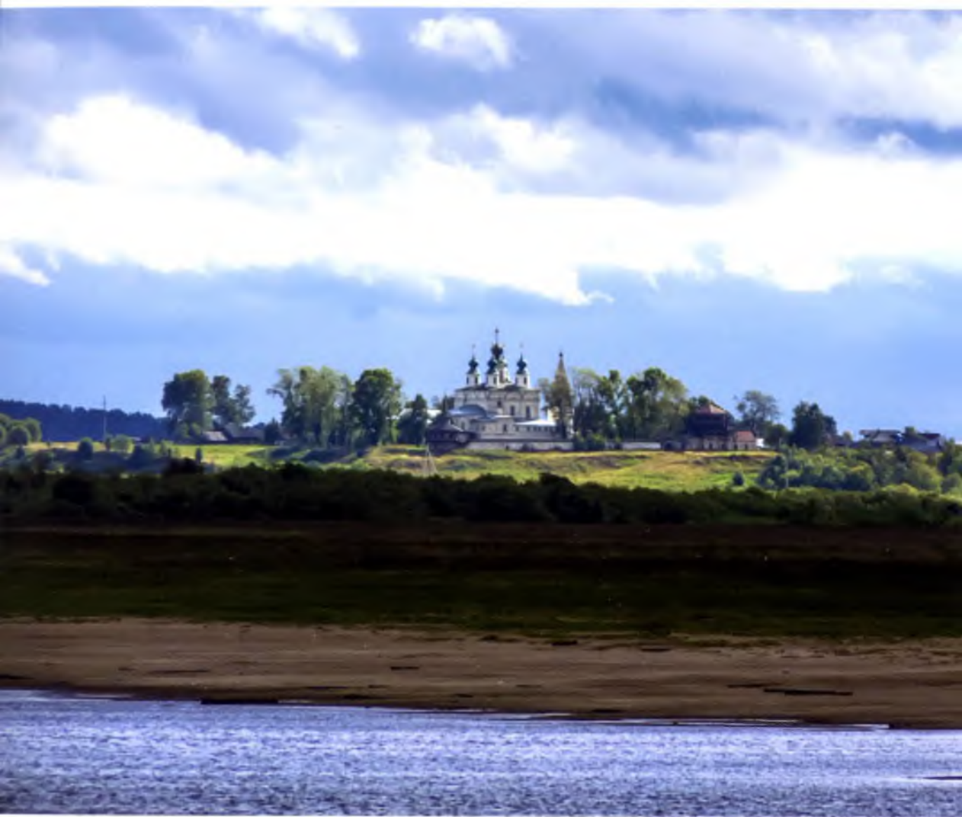
Троице- Игуденский монастырь. Вторая половина XVII – XVIII вв. Вид со стороны реки Сухоны