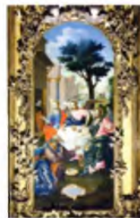
«Троица Ветхозаветная», Алексей Болмагоров. Икона местного ряда, 1778 г.