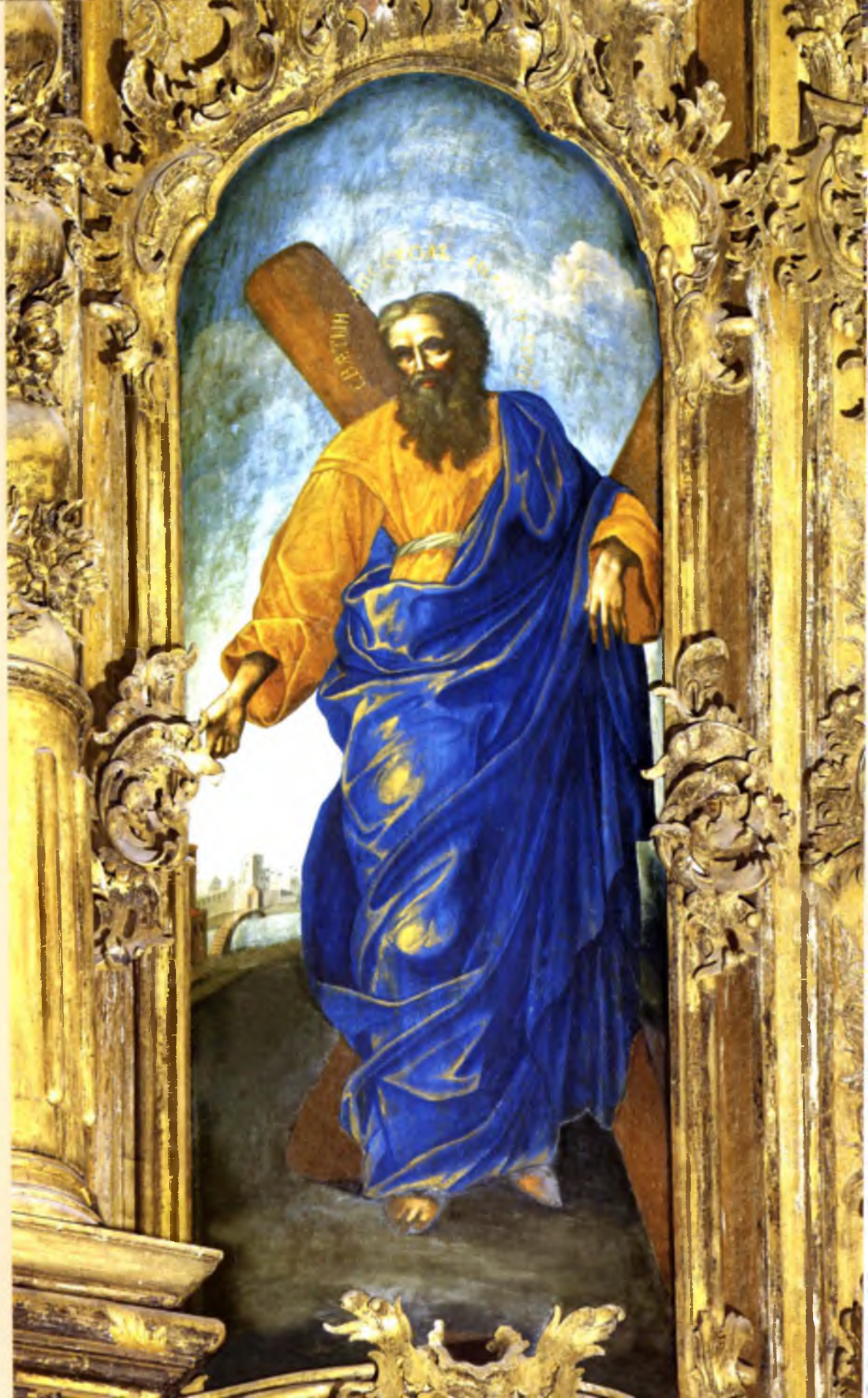
Апостол Андрей Первозванный Василий Алеев 1781 год Денежный ряд (№ 40)