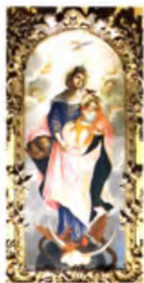
«Богоматерь с Младенцем». Алексей Колмагоров. Икона местного ряда. 1778 г.