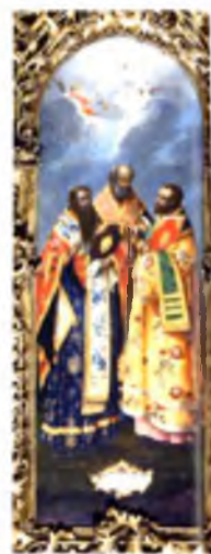
«Собор трех святителей». Алексей Колмагоров. Икона местного ряда. 1777 г.

Далее в местном ряду следуют икона «Успение Богоматери» и венчающая ее икона «Вознесение Богоматери». На северных воротах в жертвенник нанесен образ архидиакона Лаврентия, над которым в возносимом ангелами медальоне изображено «Пствование святого