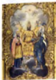
«Царь царем», Егор Шергин. Икона деисусного ряда, 1781 г.

Под карнизом нижнего регистра иконостаса размещены Царские врата, врата жертвенника и диаконника, восемь икон местного ряда и над ними десять икон меньшего размера, часть из которых представляет сцены «праздников», но большинство посвящено деяниям святых, чьи образы находятся на иконах местного ряда. У Царских врат справа установлена храмовая икона «Троица Ветхозаветная» в изводе «Гостеприимство праотца Авраама», над которой помещается образ «Встреча Девы Марии и Елизаветы». Образ святого Иоанна Предтечи в местном ряду иконостаса полностью повторяет его изображение на центральной иконе апостольского чина, но дополнен сценой Креще-