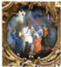
«Бичевание Христа». Егор Шергин. Икона страстного ряда. 1781 г.

Иконы страстного ряда, созданные в 1780–1781 годах Егором Шергиным, фланкируют резное Распятие под сводами храма. Они написаны на досках двух размеров: четыре иконы имеют форму тондо; шесть композиций приближаются по высоте к иконам апостольского ряда, что акцентирует на них внимание. Страстной цикл включает: «Поцелуй Нуды», «Приведение к Пилату», «Бичевание Христа», «Несение Креста», «Положение во Гроб», «Сопещение во ад»,