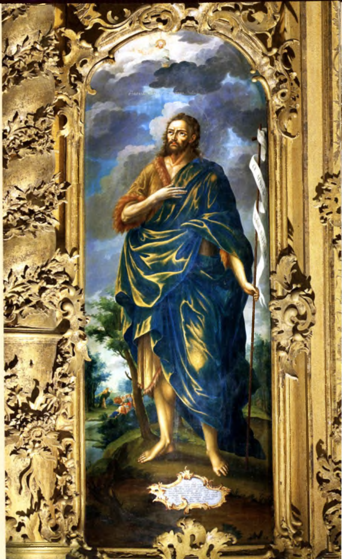
Иоанн Предтеча Егор Шергин 1781 год Местный ряд (№ 5)