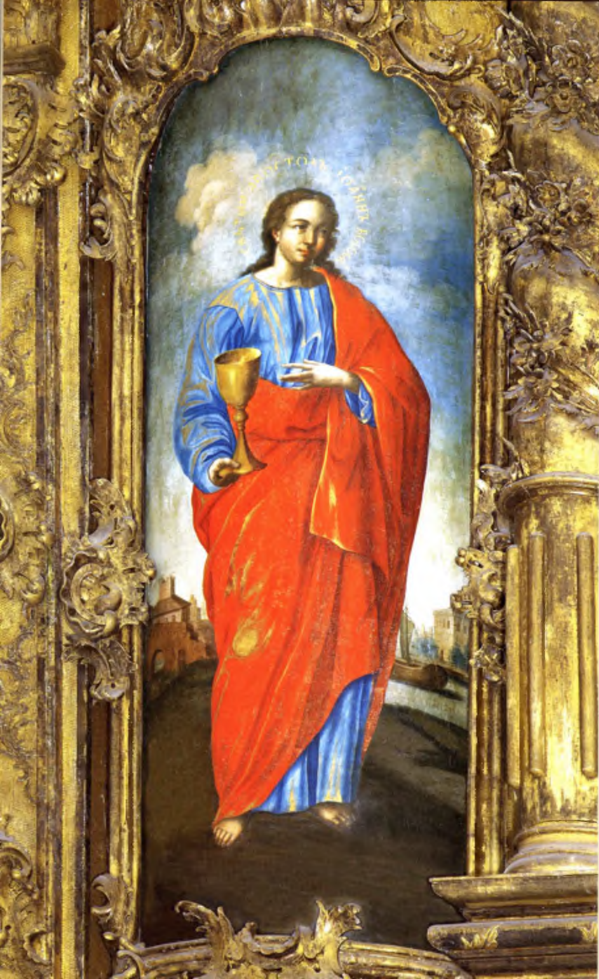
Апостол Иоанн Богослов Василий Алепев 1781 год Деисусный ряд (№ 39)