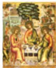
«Троица Ветхозаветная, с Деяниями». Пристенная икона. Вторая половина XVII в.