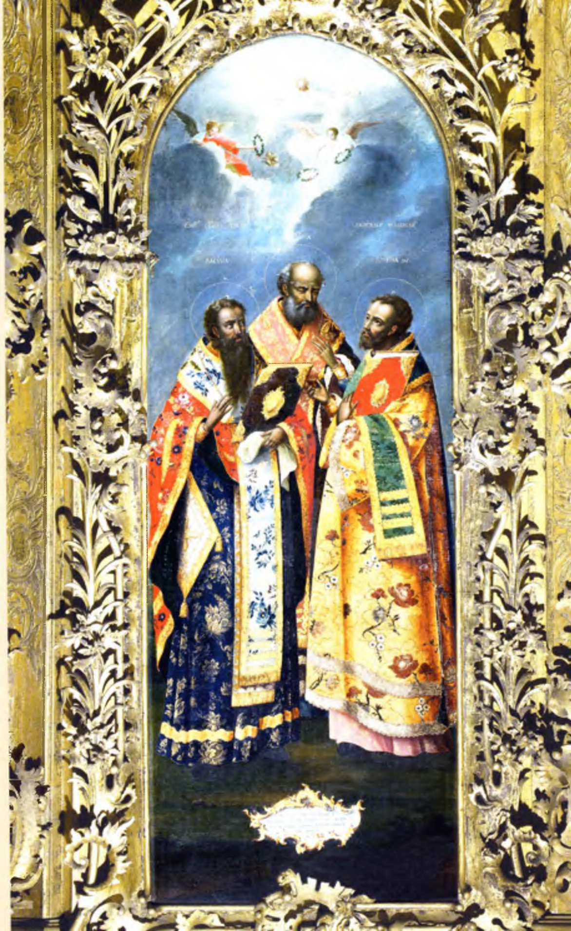
Собор трех святителей: Василий Беликий, Иоанн Златоуст, Григорий Богослов Алексей Колмогоров 1777 год Местный ряд (№ 11)