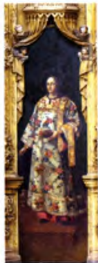
«Архидиакон Стефан», Егор Шергин, Диаконская южная дверь, 1781 г.