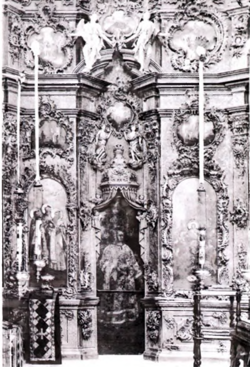
Деталь иконостаса с северными диаконскими дверями. Фото начала XX в.

Человек, занятый созерцанием декора и скульптур центральной части иконостаса, лишь через некоторое время переносит внимание на множество летящих и парящих ангелов, целого хора херувимов и серафимов, начинает обзирать большие плоскости живописных икон, раззолоченных мотивов рокайльной и травной орнаментики, воспринимает весь иконостас, с его сложными формами архитектуры, узорного богатства, наивной простотой скульптурных изображений и яркой красочностью живописных икон.