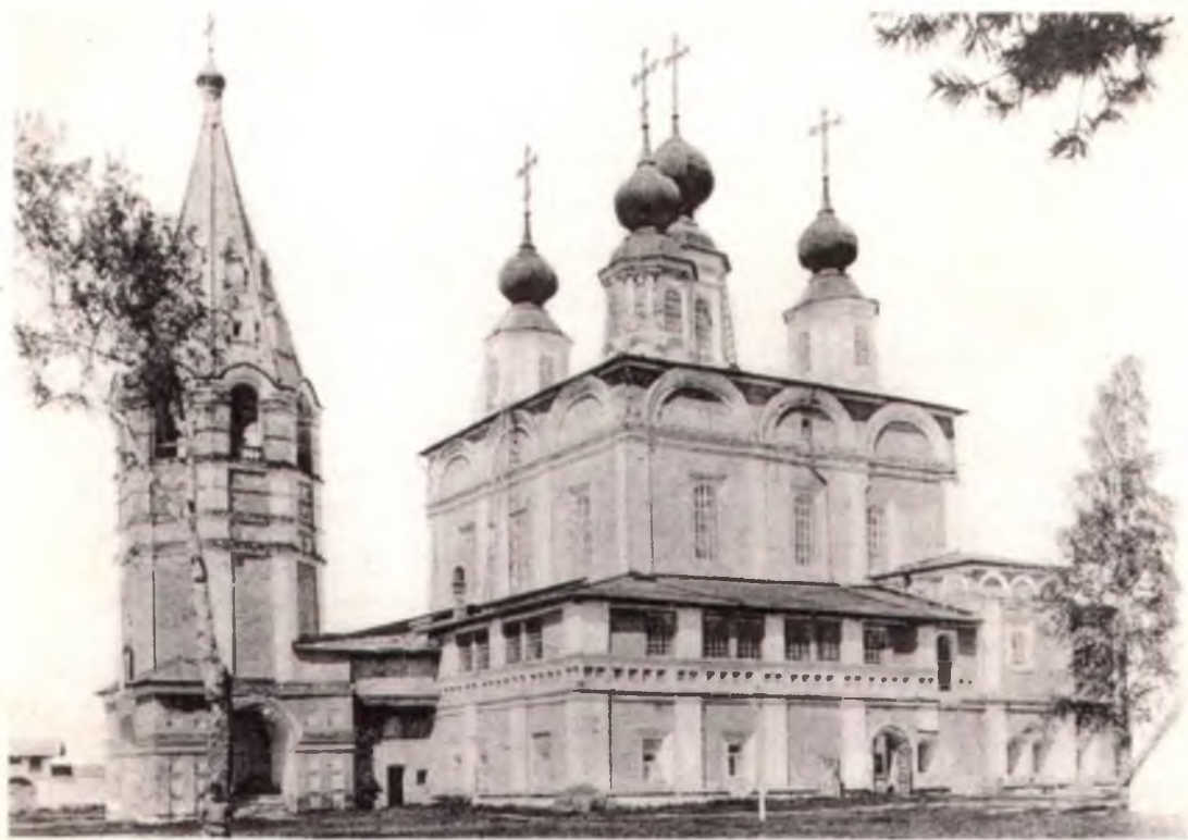
Троицкий Гledenский монастырь.

резного дела был вызван не только тем, что Тотма наряду с Устюгом Великим с 1682 года входила в Устюжско-Тотемскую епархию, но и тем, что, на 1770-е годы приходится расцвет барочной местной храмовой архитектуры и иконостасной орнаментальной и скульптурной резьбы по дереву. Характерно и другое. Тотма — один из немногих городов Русского Севера, находившихся в области искусства под сильным влиянием новой столицы России — Санкт-Петербурга. Именно в это время в Тотме велось активное строительство новомодных церквей. В убранстве барочных каменных храмов этого времени широко использовались орнаментальные мотивы и скульптурные изображения резных фигур ангелов, херувимов; деревянные композиции «Чудо святого Георгия о змие», «Распятие, с предстоящими», — характерны для «резного искусства» петербургских мастеров. Работы по исполнению мотивов такой орнаментики нового иконостаса Троицкого собора и частично его деревянной скульптуры были исполнены в домашних мастерских резчиков Тотмы. Крупные же архитектурные формы резного сооружения выполнялись в самом Гledenском монастыре, в существующей каменной Тихвинской церкви с трапезной палатой постройки 1740-х годов. Работы над резьбой затянулись до 1784 года, золочение и раскраску резных скульптур, Царских врат, витых колонн и всего пятиярусного иконостаса с его сложнейшим орнаментальным декором проводил Петр Лабзин с артелью помощников.