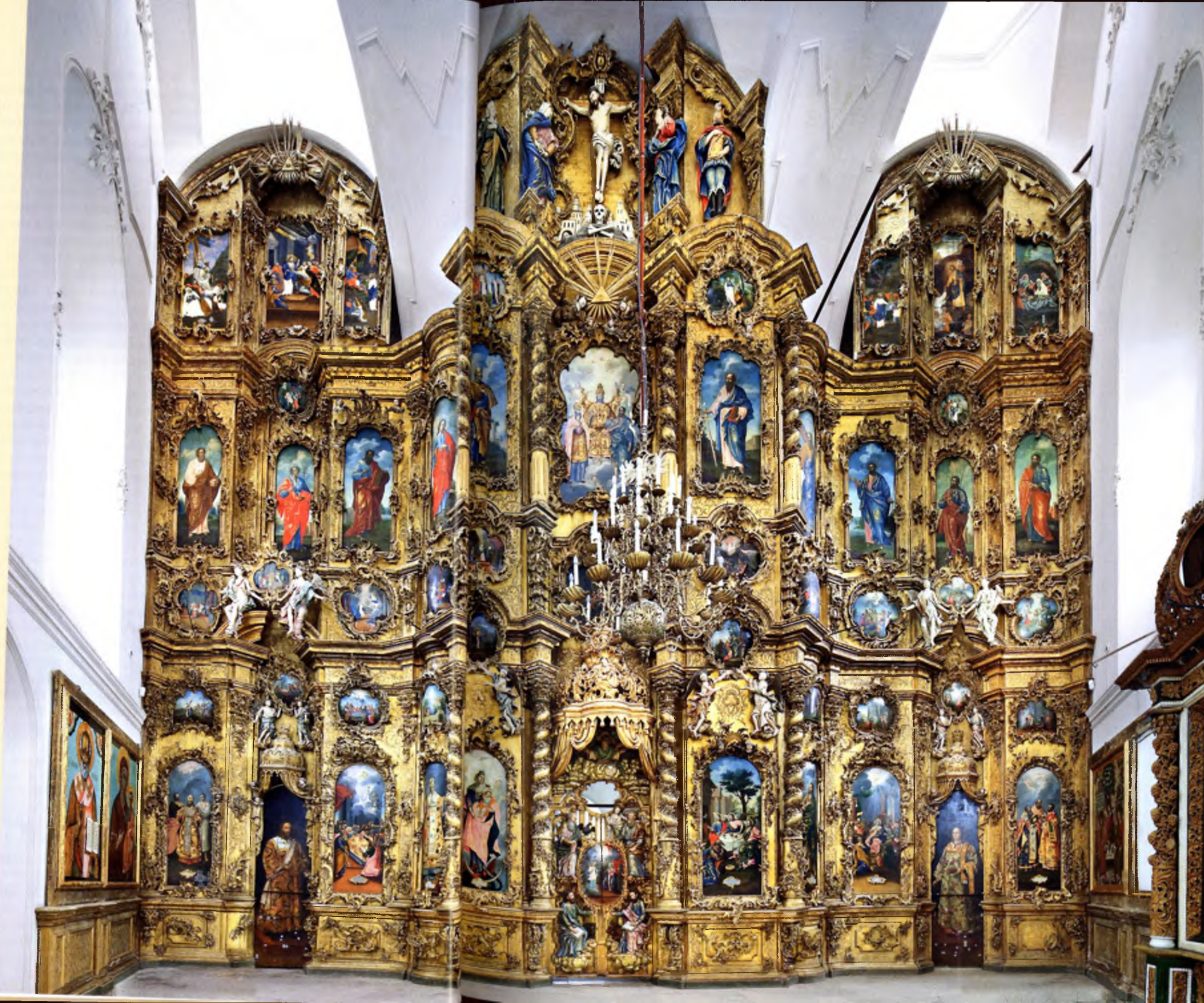
ИКОНОСТАС Троицкого собора Троице-Следенского монастыря