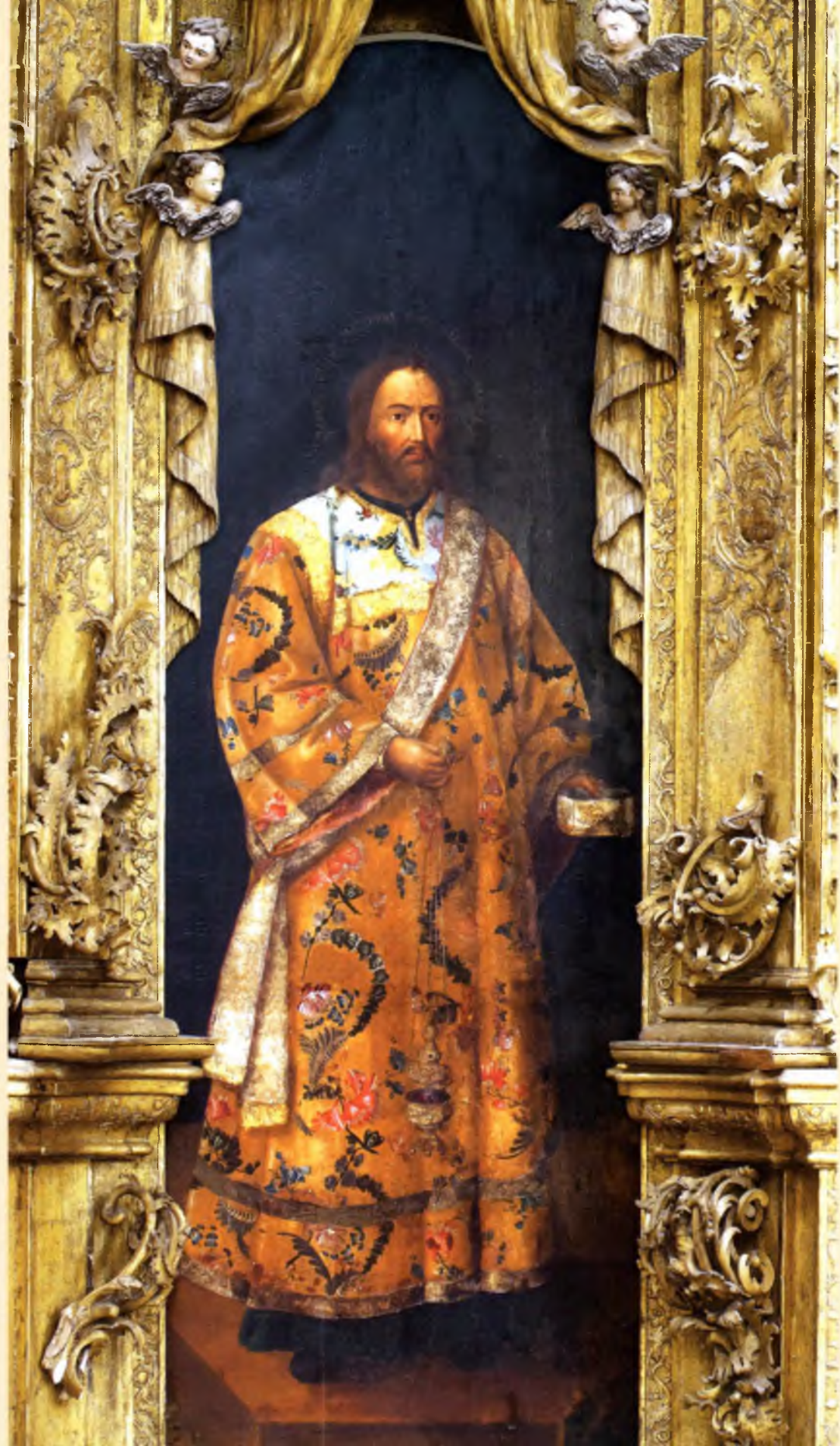
Архидиакон Лаврентий Егор Шергин 1781 год Диаконская северная дверь (№ 8)