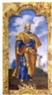
«Апостол Петр», Егор Шергин. Икона деисусного ряда, 1781 г.