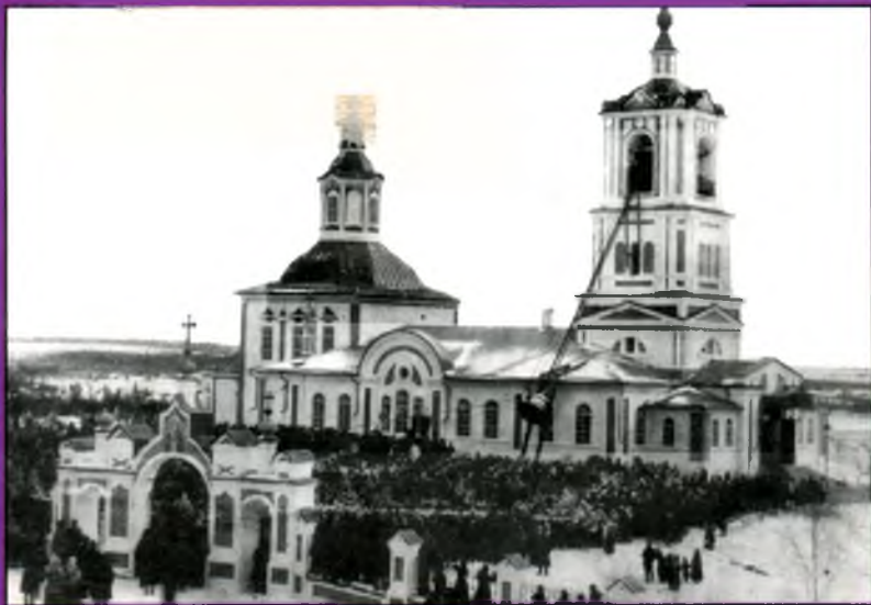
Шарденгско-Николаевская церковь. Поднятие колокола. фотография 1910 года.

На первой странице обложки Иоанно-Богословская Варженская церковь.