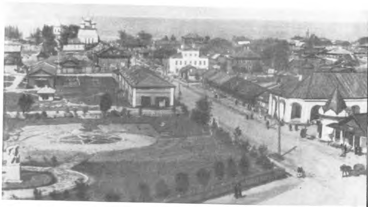
Белозерск, 40-е годы