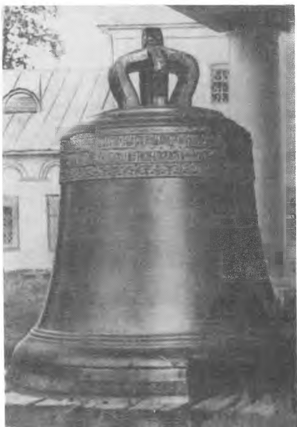
90-пудовый колокол у церкви Успения