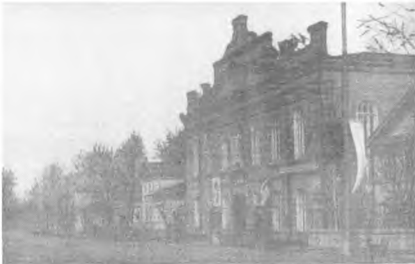
Здание, в котором 7—10 декабря 1917 года проходил первый съезд Советов рабочих, крестьянских и солдатских депутатов