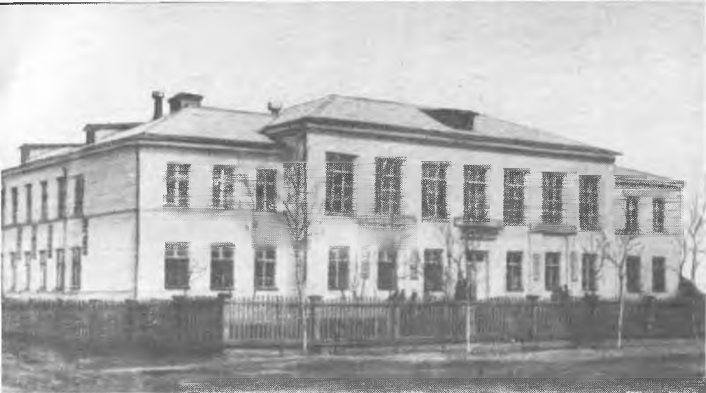
Средняя школа № 2