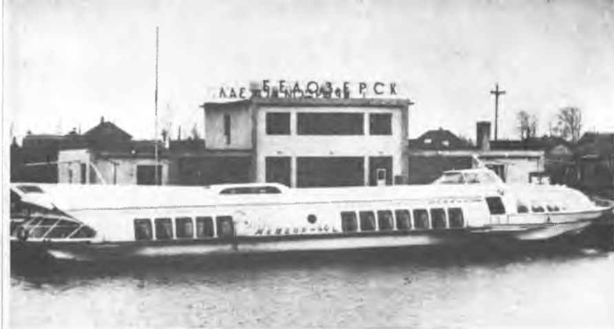
«Метеор» у пристани