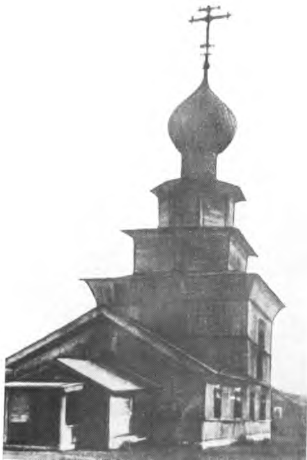
Церковь Ильи — памятник ревянского зодчества