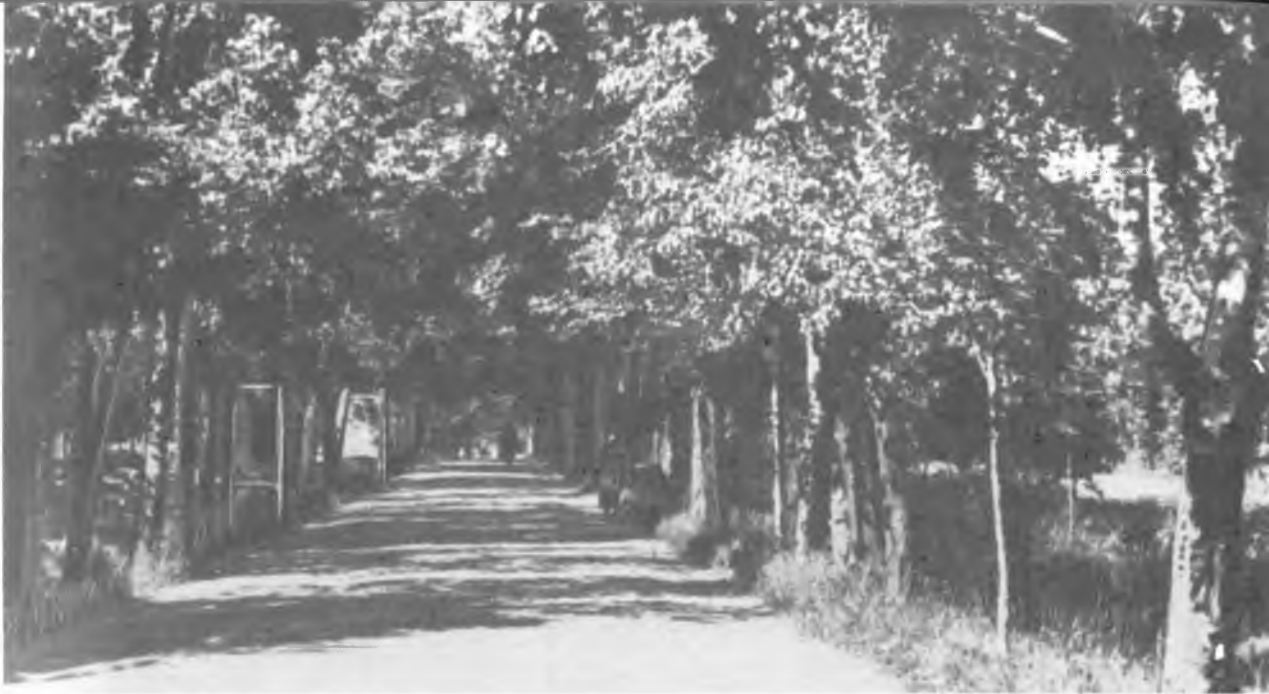
Любимое место прогулок