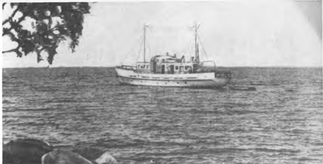
На водных просторах