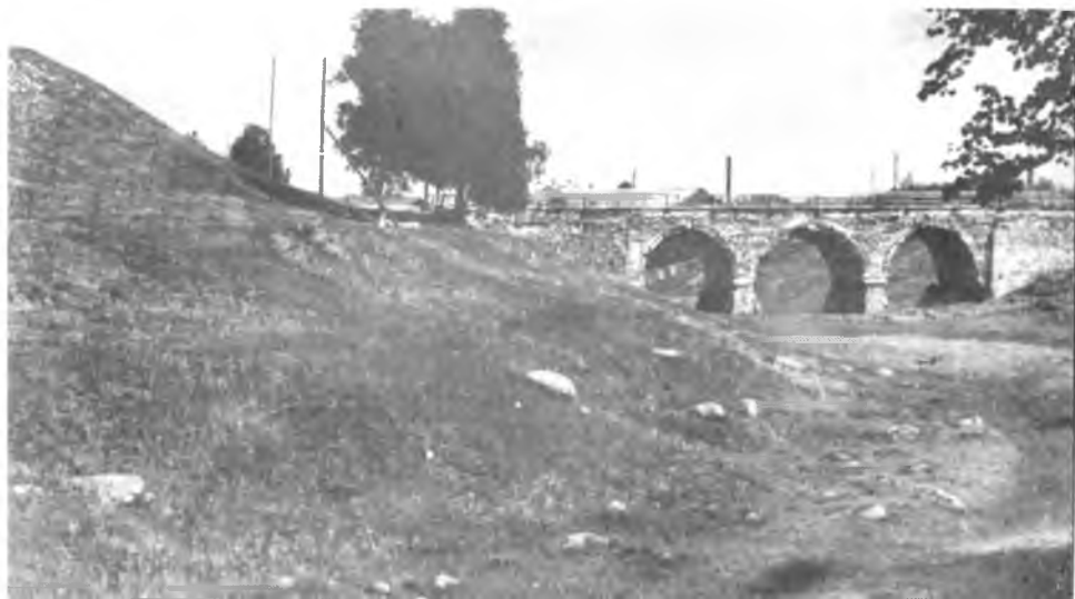
Трехпролетный кирпичный мост. XVIII век