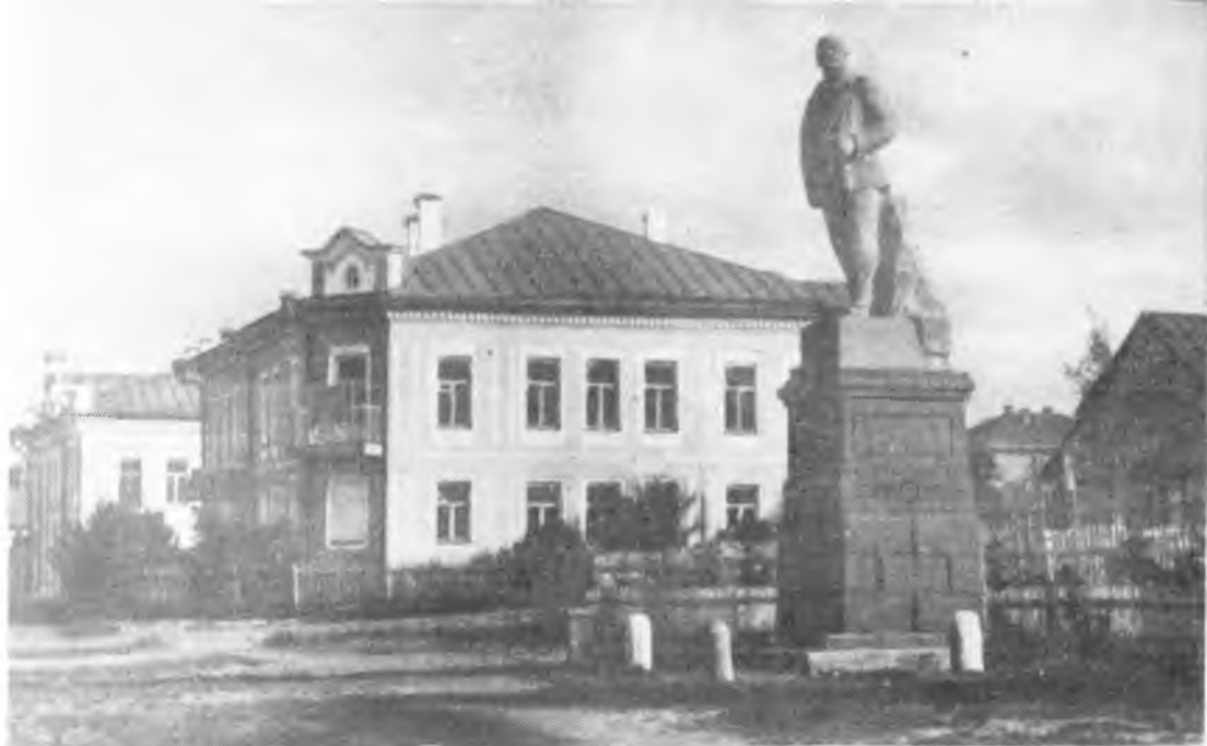
Бывшее здание городской управы, ныне мелитшское училище.