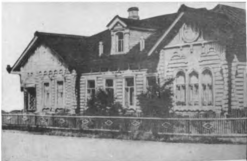
Памятник начала XX века — деревянный дом, в котором размещены детские ясли