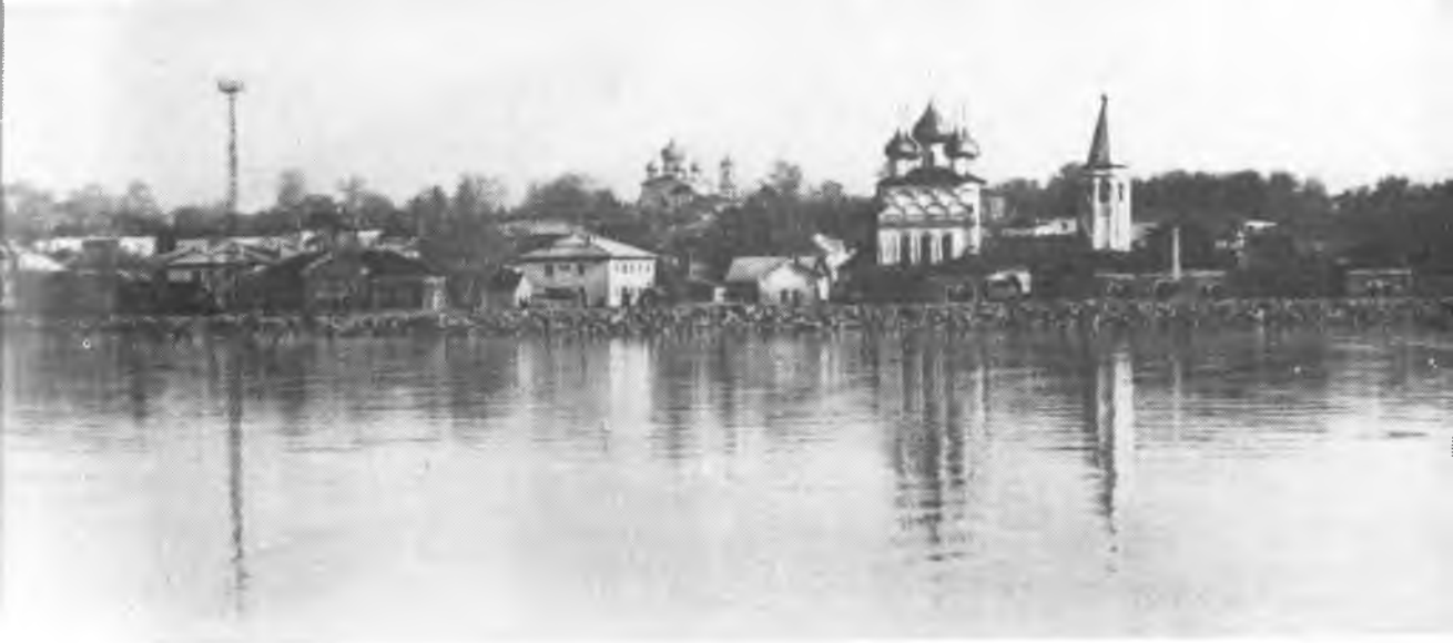
Вид на город Белозерск со стороны озера