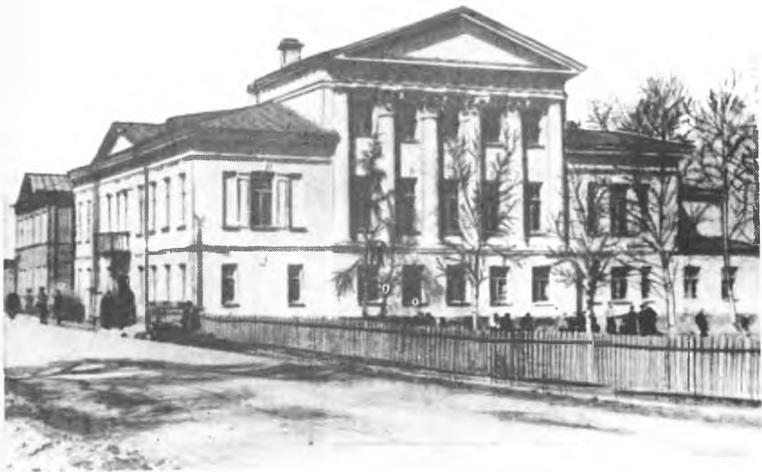
Каменный особняк первой половины XIX века. Фасад украшен шестиколонным коринфским портиком