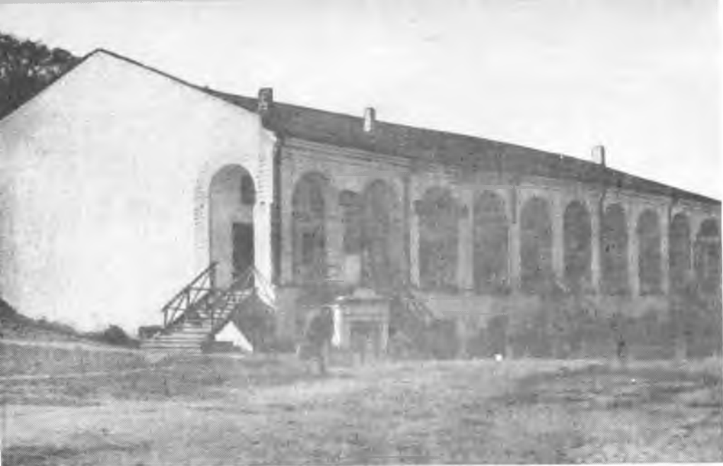
Гостиный двор. XVIII век