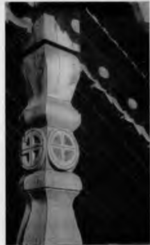
Церковь Петра и Павла в деревне Челмузи

Один из самых поздних памятников культовой архитектуры Заонежья, как бы подводящий итог развитию