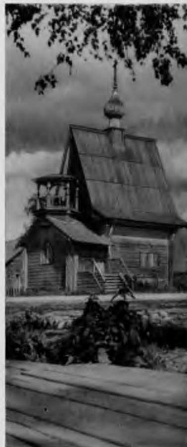
65. Часовня в селе Коневе

От Конева предстоит долгий и не очень легкий путь до судоходной части Онеги, до Ярнемы. По пути до железнодорожной станции Плесецкая довольно часто попадают ча-