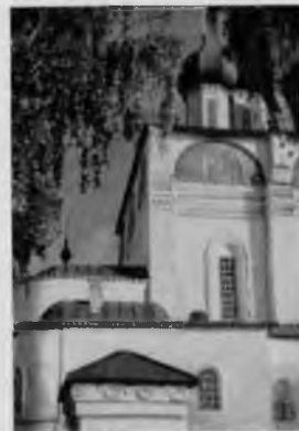
90. Фрагмент фасада

различных уровнях. Между ними по углам выложены небольшие тромпы — своды в форме части конуса, половины или четверти сферы и т. д., применяемые в качестве опорной конструкции. Они дают возможность укрепить восьмигранный сомкнутый свод, служащий основанием восьмигранному же барабану купола.