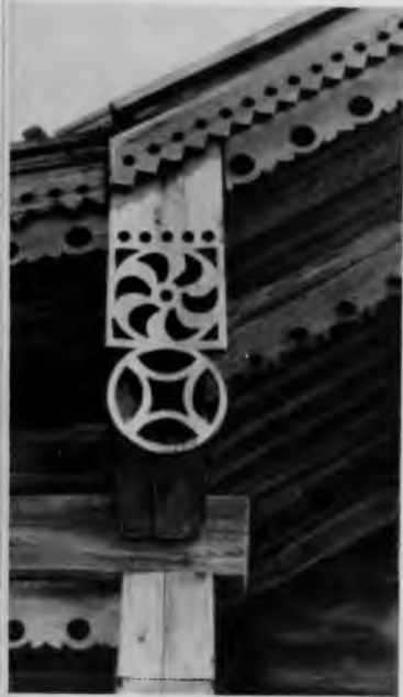
9. Покровская церковь. Деталь крыльца

сочетаются светлые — алые, розовые, зеленоватые и палевые тона. Фон и поля — золотисто-желтые.