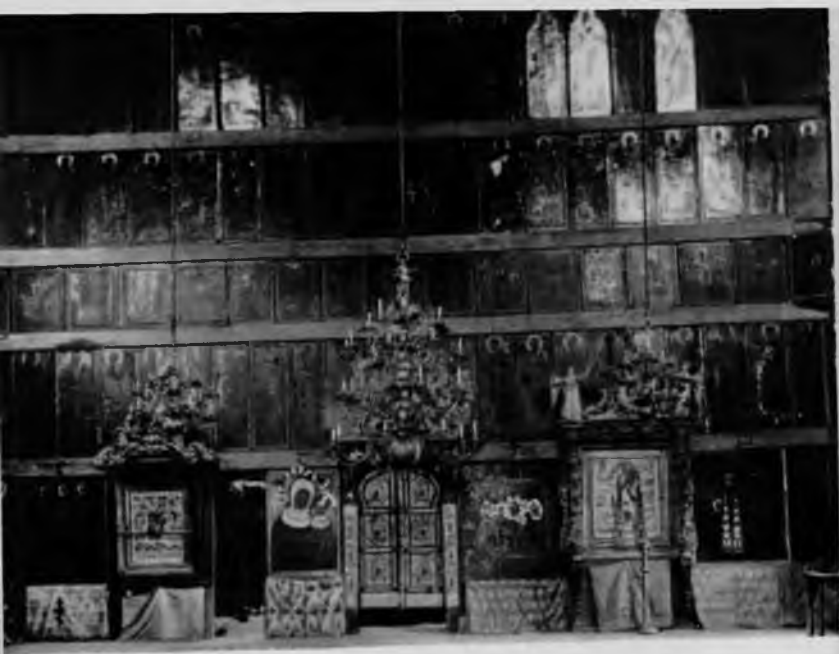
103. Ильинская церковь в селе Чухчерьме. Иконостас

В церкви был чудесный пятиярусный иконостас раннего времени. Он занимал полностью восточную стену храма и был весь заполнен древними иконами. Царские врата иконостаса были покрыты резьбой и украшены слюдой и басмой.