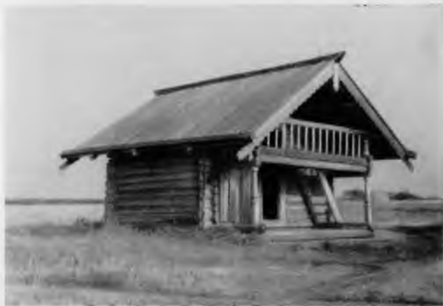
31. Амбар из деревни Коккойла

Дом кошелем — наиболее распространен в Заонежье. Однако здесь встречаются и дома «брусом». Это обычная четырехстенная или пятистенная изба с двором позади нее. Жилье и двор находятся под одной равноскатной кровлей. Примером может служить дом Сергеева, построенный в начале XX в. Он перевезен в Кижский заповедник из деревни Логморучей. Постройки брусом имеются и в деревнях Воробы, Сибово, Усть-Яндома, в Великой губе и т. д.