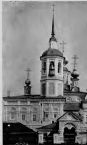
84. Вознесенская церковь в Великом Устюге

В одном комплексе с Успенским собором находится собор Прокопия, сооруженный в 1668 г. Это кубический пятиглавый бесстолбный храм, фасады которого завершены декоративными закомарами. Здесь же расположен и собор Иоанна Праведного, в