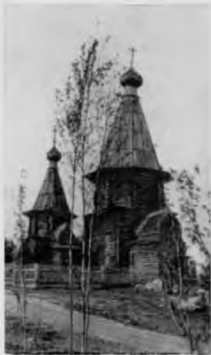
Успенский собор в городе Кемь