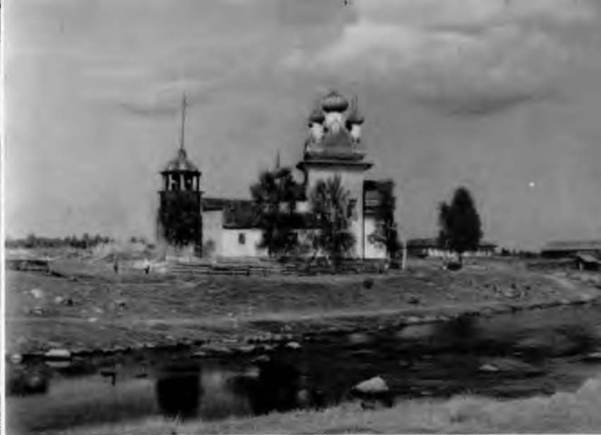
48. Вознесенская церковь в селе Кушерека

«Мы потомственные мореходы», — с гордостью говорят о себе старожилы села. Много веков смелые мореходы Кушереки бороздили воды Белого моря, выходили в бурное Баренцево, плавали к скалистым берегам Норвегии,