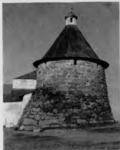
40. Соловецкий монастырь. Северная (Никольская) башня

Каким собор был первоначально, трудно сказать. В какой-то мере облик его помогает воссоздать многочисленный иконографический материал — старые гравюры,