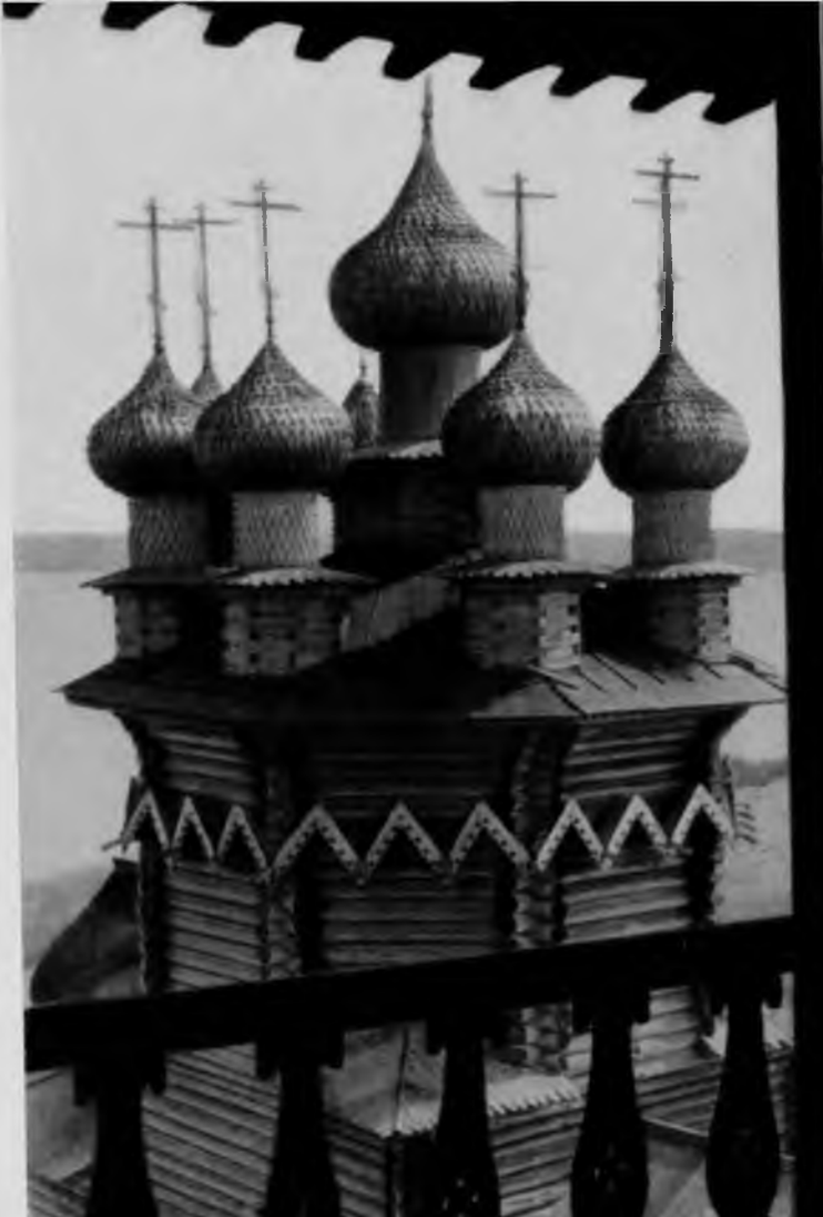
8. Покровская церковь в Кижях. Вид с колокольни

Архитектурные фоны заполнены многоярусными высокими зданиями с круглыми арками и бочкообразными кровлями. Фигуры, строения, горы — все передано объемом. Живопись отличается плотным письмом, в котором