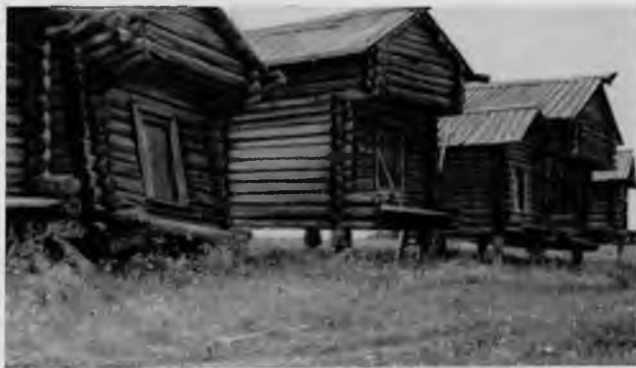
102. Амбары в селе Шардонем

ном четырехстенные, но встречаются и пятистенные, поставленные на шесть столбов. Перед входом на помост амбара устраивались лестницы из врытых в землю, последовательно возрастающих по высоте бревен, обычно двух или трех.