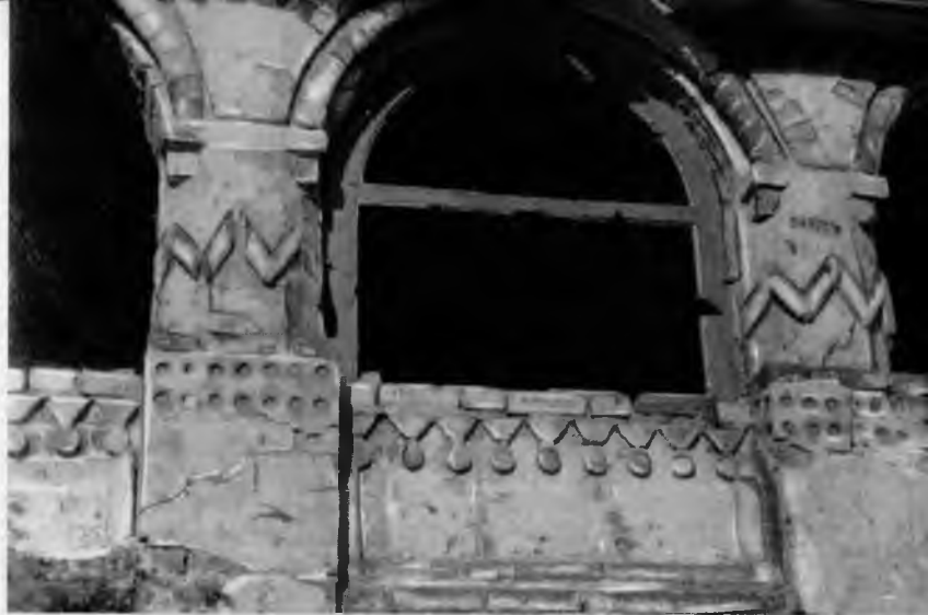
43. Соловецкий монастырь. Водяная мельница. Фрагмент

Из гражданских построек монастыря особенно интересна водяная двухэтажная мельница, примыкающая к южной стене около Белой башни. Она построена в XVII в. из крупноразмерного кирпича, как, впрочем, и большинство