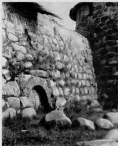
39. Соловецкий монастырь. Стена у Южной (Архангельской) башни и Архангельские ворота

Осмотрев стены и башни снаружи, войдем в приделы монастыря через Никольские ворота, расположенные у Северной башни. В длинном дворе слева находятся жилые и хозяйственные корпуса, справа — палаты, построенные в XVII в. Через ворота хозяйственного корпуса проследуем на главный двор монастыря. Здесь, вдоль западной стены, по обе стороны от надвратной Благовещенской церкви, возведенной в 1596—1601 гг., размещены кельи, торговые лавки, кладовые. Ворота под церковью были парадными. Они вели от моря к главному