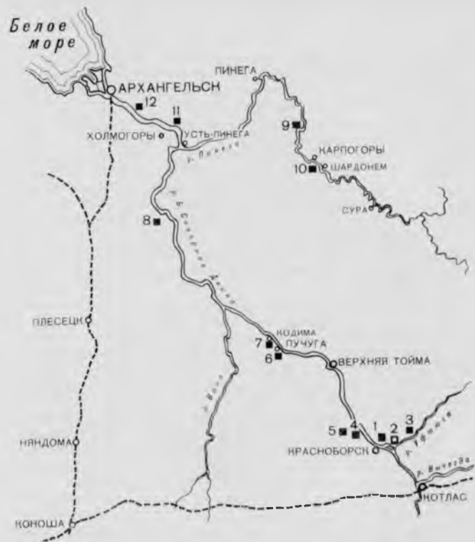
93. Схема расположения памятников в бассейне рек Северной Двины и Пинеги