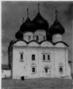
54. Воскресенская церковь в Каргополе

поставлены контрфорсы. Дата их установки вызывает споры среди специалистов. Но по хранящимся в архиве документам можно установить, что построены они были в период, когда велись основные восстановительные работы (1770—1780 гг.).