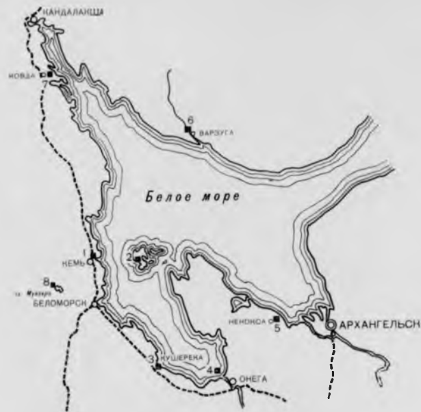
35. Схема расположения памятников в районе Белого моря

1. г. Кемь. Успенский собор. 1711 г.; 2. Соловецкий остров. Монастырь; 3. Село Кушерека. Вознесенская церковь. 1669 г.; 4. Кий-остров. Крестный монастырь; 5. Деревня Ненокса. Троицкая церковь. 1727 г.; 6. Село Варзуга. Успенская церковь. 1674 г.; 7. Село Ковда. Никольская церковь. 1705 г.; 8. Муезеро. Никольская церковь. XVII в.