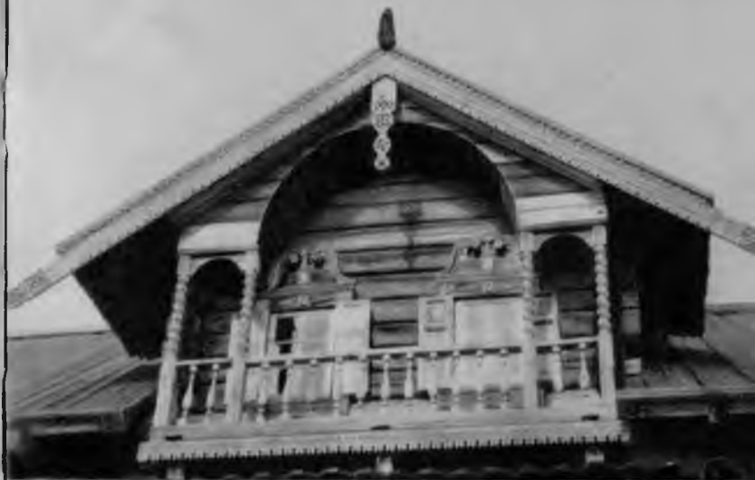
29. Дом Ошевнева. Балкон

Окна заонежских домов почти всегда имеют широкие резные раскрашенные наличники. В формах их нельзя не