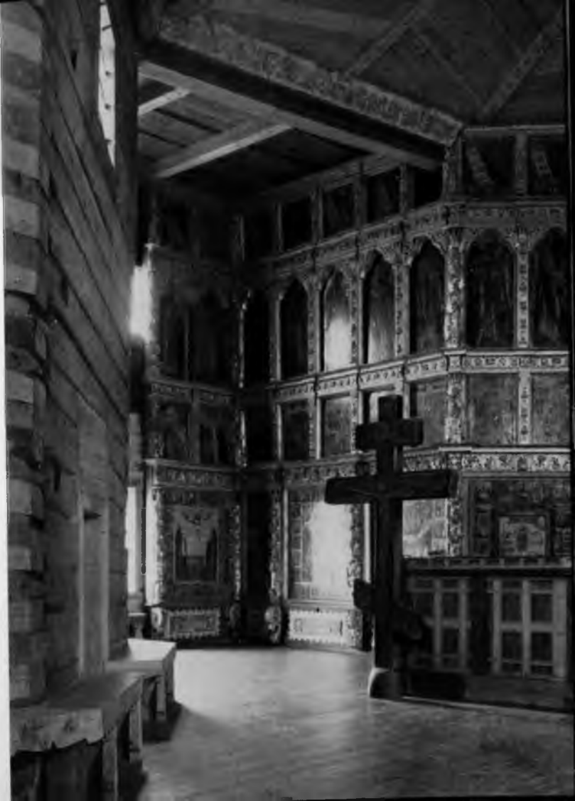
7. Преображенская церковь. Иконостас

Икон, относящихся ко времени постройки храма, осталось немного — не более десяти. Это в основном доски нижнего, так называемого «местного» ряда иконостаса, где