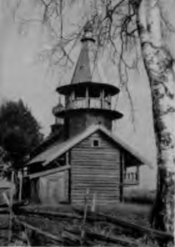
11. Часовня Петра и Павла на Волкострове

с четырьмя евангелистами, так как это было связано с расчленением плоскости створок на квадратные клейма.