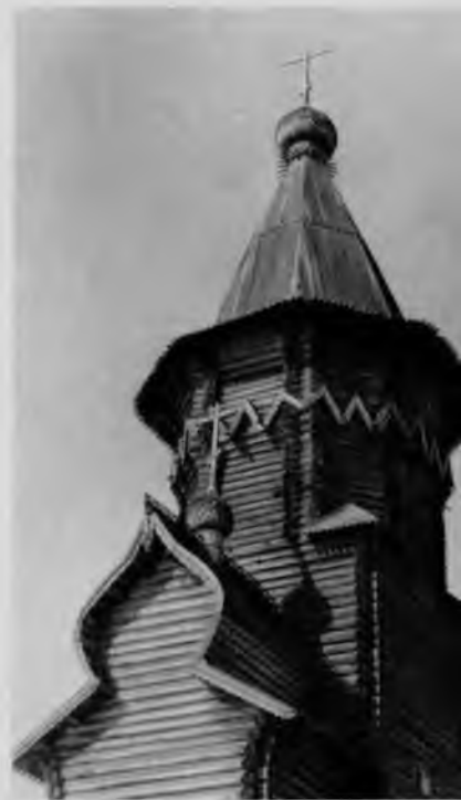
20. Успенская церковь в селе Кондопога

Наличие ряда гнезд в венцах над повалом четверика, идущих по ломаной линии, наводит на мысль,