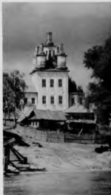
80. Троицкая церковь в Тотьме

Наиболее значительный по своим художественным достоинствам памятник — Троицкая церковь. В сооружении два этажа. Верхняя церковь — двухсветная. Храм имеет призматическую весьма вытянутую по вертикали форму. К главному кубу церкви