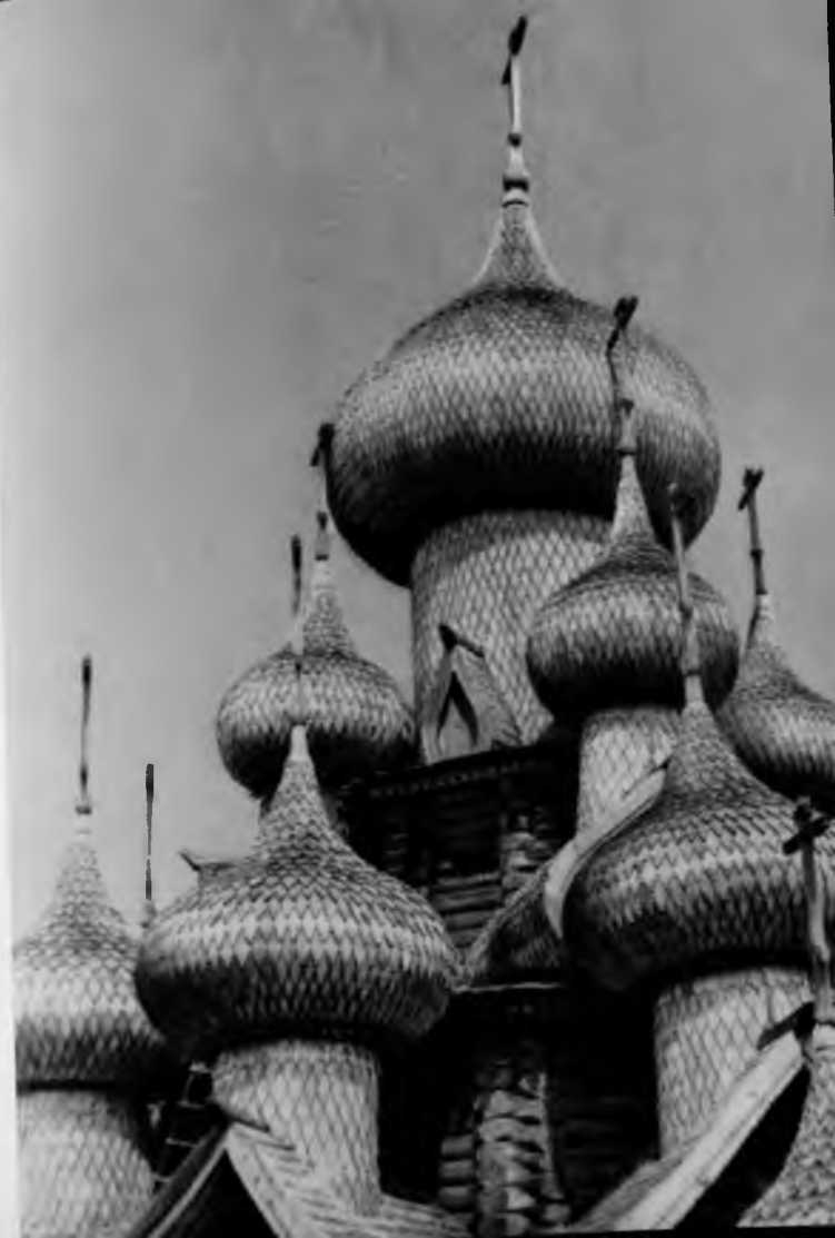
5. Преображенская церковь. Верхние главы

Зодчие-плотники не только использовали этот план восьмерика с четырьмя прирубями в постройке Преображенской церкви в Кижях, но развили и обогатили его. Кижская Преображенская церковь, отличающаяся необычайной цельностью композиции и гармонией всех своих частей, явилась как бы венцом деревянного зодчества на Руси. Не случайно и поныне в Заонежье бытует легенда, рассказывающая, что, «срубив свою многоверхую церковь