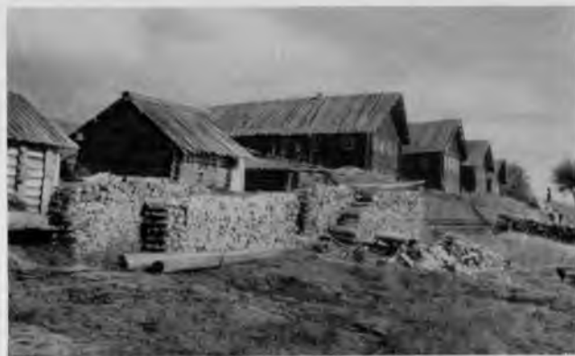
61. Деревня Бор. Жилые дома

Довольно часто в селениях на Свиди можно видеть и двухэтажные четырехстенные избы. Оба этажа — жилые и по планировке точно повторяются. Примером могут служить дома первого порядка деревни Бор, стоящие на возвышенном левом берегу. Такие жилища строили наиболее зажиточные крестьяне.