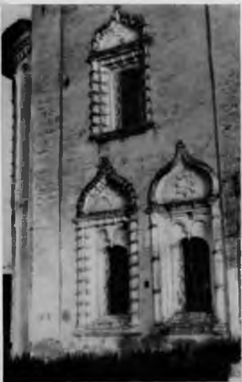
Благовещенская церковь 59. Фрагмент северного фасада