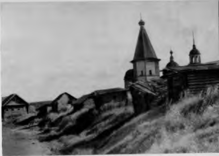
62. Никольская церковь в селе Астафьево

По пути к Коневу, в шести километрах от Каргополя, в открытом поле среди буйного разнотравья расположена небольшая деревня Саунино. В центре ее возвышается Златоустовская церковь, построенная в 1655 г.,