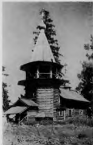
Георгиевская часовня в деревне Усть-Яндома