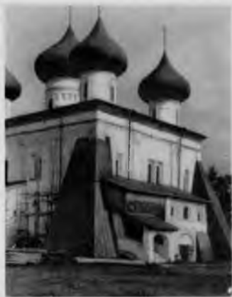
Рождественский собор в Каргополе