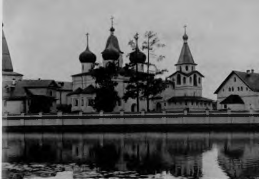
99. Сийский монастырь. Вид с озера

С южной стороны к собору присоединялась трапезная с небольшой шатровой колокольней, а с северо-запада —