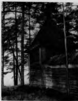
Крестный монастырь на Кий-острове