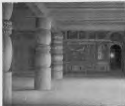
70. Благовещенская церковь. Трапезная

Весьма любопытная деталь церкви, очень редко встречающаяся в деревянной архитектуре, — трехлопастная бочка, которая увенчивает пятистенный алтарный прируб.