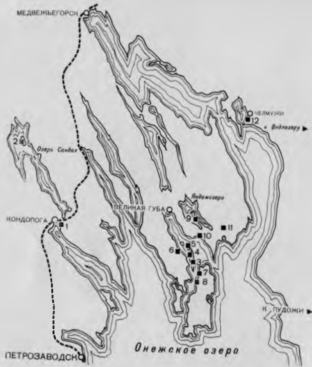
3. Схема расположения основных памятников Заонежья.

1. Кондопога. Успенская церковь. 1774 г.; 2. Длинный остров. Петропавловская церковь. 1620 г.; 3. Кижский остров. Погост и заповедник; 4. Деревня Васильво. Часовня. XVIII в.; 5. Волкостров. Часовня Петра и Павла. XVII в.; 6. Деревня Подельники. Часовня. XIX в.; 7. Деревня Воробьи. Часовня. XVIII в.; 8. Деревня Корба. Часовня. XVIII в.; 9. Деревня Яндомозеро. Варяжская церковь. 1656 г.; 10. Деревня Усть-Яндома. Георгиевская часовня. Конец XVII в.; 11. Село Тилиныцы. Вознесенская церковь. 1781 г.; 12. Село Челмуни. Церковь Петра и Павла. 1603 г.