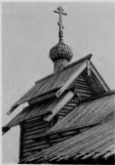
14. Часовня архангела Михаила из деревни Леликозеро. Фрагмент