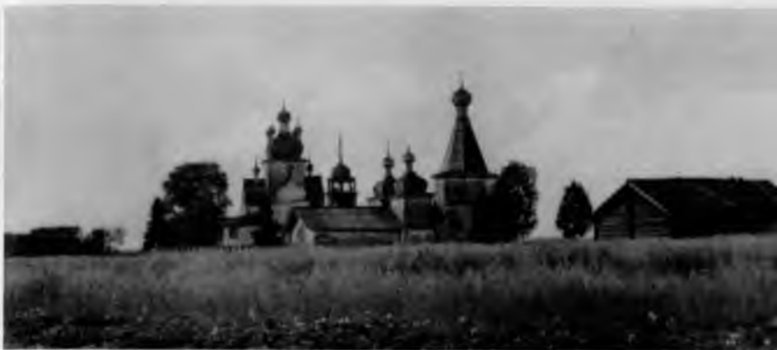
66. Село Турчасово. Погост

Основной тип здешнего крестьянского дома — изба-четырёхстенка на высоком подклете с обширным двухэтажным