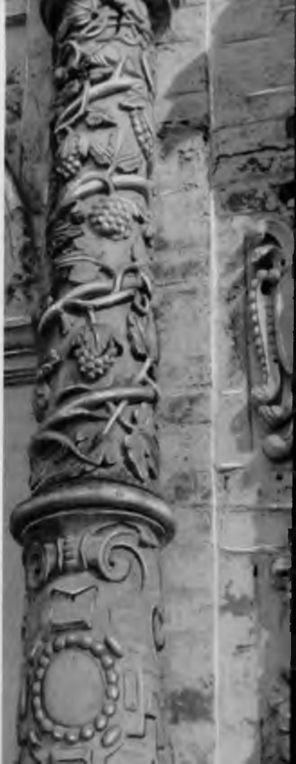
92. Колонна портала