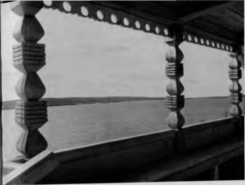
6. Преображенская церковь. Крыльцо

В Преображенской церкви хороши также детали. Наиболее богато убрано зодчими высокое крыльцо с двумя крутыми лестницами-входами. Оно не только было входом в храм, но и служило трибуной для многолюдных народных собраний. Резьба крыльца чрезвычайно проста и строга по рисунку. Доски «подзоров», кровель входов и крыльца прорезаны круглыми отверстиями. По краю досок идут мелкие фестоны. Квадратного сечения столбы, несущие перекрытия крыльца и лестниц, обработаны перехватами из резных жгутов, которые чередуются с вытянутыми по форме «дыньками». На фоне простого бревен-