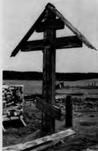
117. Поклонный крест. Деревня Заозерье

власти — пятиглавыми, но в то же время сохраняли и привычный, любимый в народе древний тип покрытия — шатер. Стремление совместить старые формы с требованиями времени привело к появлению покрытия главного объема храма в виде шатра на крещатой бочке с четырьмя главками. Эти бочки были чисто декоративными и предназначались только для несения главок.