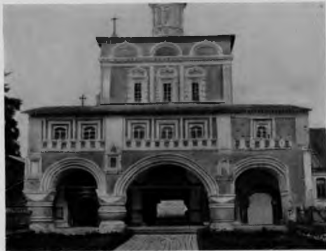
87. Михайло-Архангельский монастырь. Святые ворота

церкви, а также связанные с ней Святые ворота решены в обычных для русской архитектуры XVII в. формах. Однако наличники окон, опорные столбы и профили кокошников полны своеобразия и чрезвычайно совершенны по рисунку.