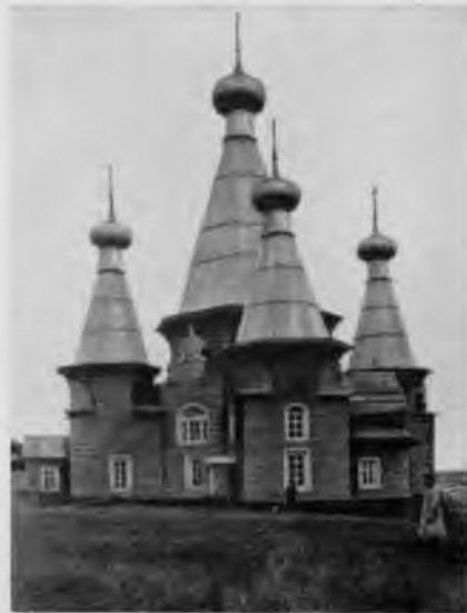
36. Троицкая церковь в деревне Ненокса

грубого дикого камня, заросшего желтым лишайником, или тяжелые приземистые башни с коническими шатровыми верхами, но прежде всего природа. Темные вековые пирамидальные ели, тихие задумчивые березы, огромные замшелые валуны, мягкие зеленые холмы, многочисленные зеркальные озера, бухты, заливы.