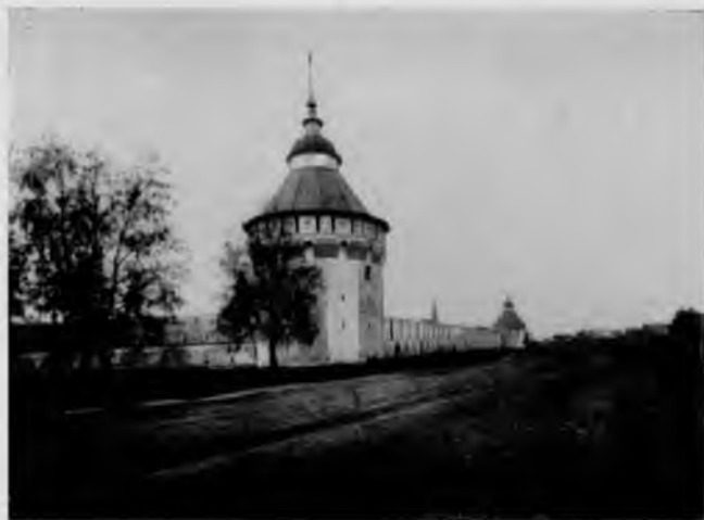
74. Спасо-Прилуцкий монастырь

Напомним, что во время Отечественной войны 1812 г. в Прилуцком монастыре хранились ценности, вывезенные из московских монастырей и соборов перед вторжением в столицу французских войск. Но вернемся в Вологду.