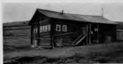
109. Дом А. Яковлева. Деревня Некрасово

Не менее важным элементом декоративного убранства дома было крыльцо. На Мезени и ее притоках наиболее часто встречаются двухстолбные крыльца. Они состоят из верхней и нижней площадок, соединенных наклонной лестницей. Две стойки верхнего рундука идут от земли, верхняя часть их в виде резных