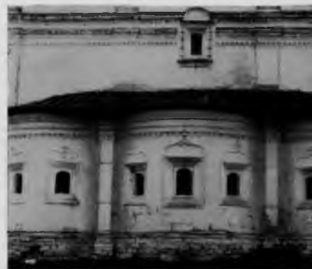
55. Воскресенская церковь. Апсиды

знать в Благовещенской церкви. Она, как говорится в клировых ведомостях, была построена «тщанием прихожан» на месте сгоревшей деревянной церкви 1542 г. Строилась Благовещенская церковь десять лет — с 1682 по 1692 год. В плане здание почти квадратное, все четыре фасада имеют трехчастное вертикальное членение. Плоскости стены между пилястрами прорезаны разными по форме и величине оконными и дверными проемами. Они обрамлены строгим, удивительно разнообразным по рисунку рельефным орнаментом, вырезанным из белого камня. Каждое окно, каждая дверь восхищают поистине бисерным узором. При всей своей рельефности они не нарушают плоскостности стен. Благовещенская церковь поражает каждого, кто видит ее впервые. И. Э. Грабарь писал, что южная часть Благовещенской церкви «может соперничать с дворцами раннего флорентийского Возрождения по изысканности пропорций и вкусу, с которым разбросаны по ней узорчатые