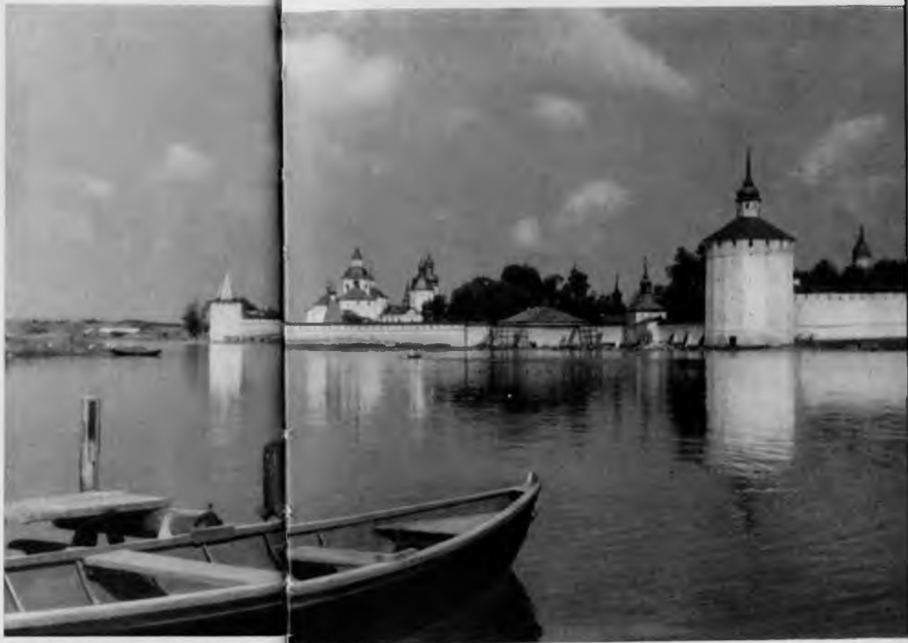
75. Кирилло-Белозерский монастырь. Вид с озера

Эта полная великолепия и покоя картина очаровывает всякого своей удивительной задушевностью и поэтичностью. Монастырь как бы задумался, погрузился в воспоминания своего бурного прошлого. Помнят эти старые крепостные