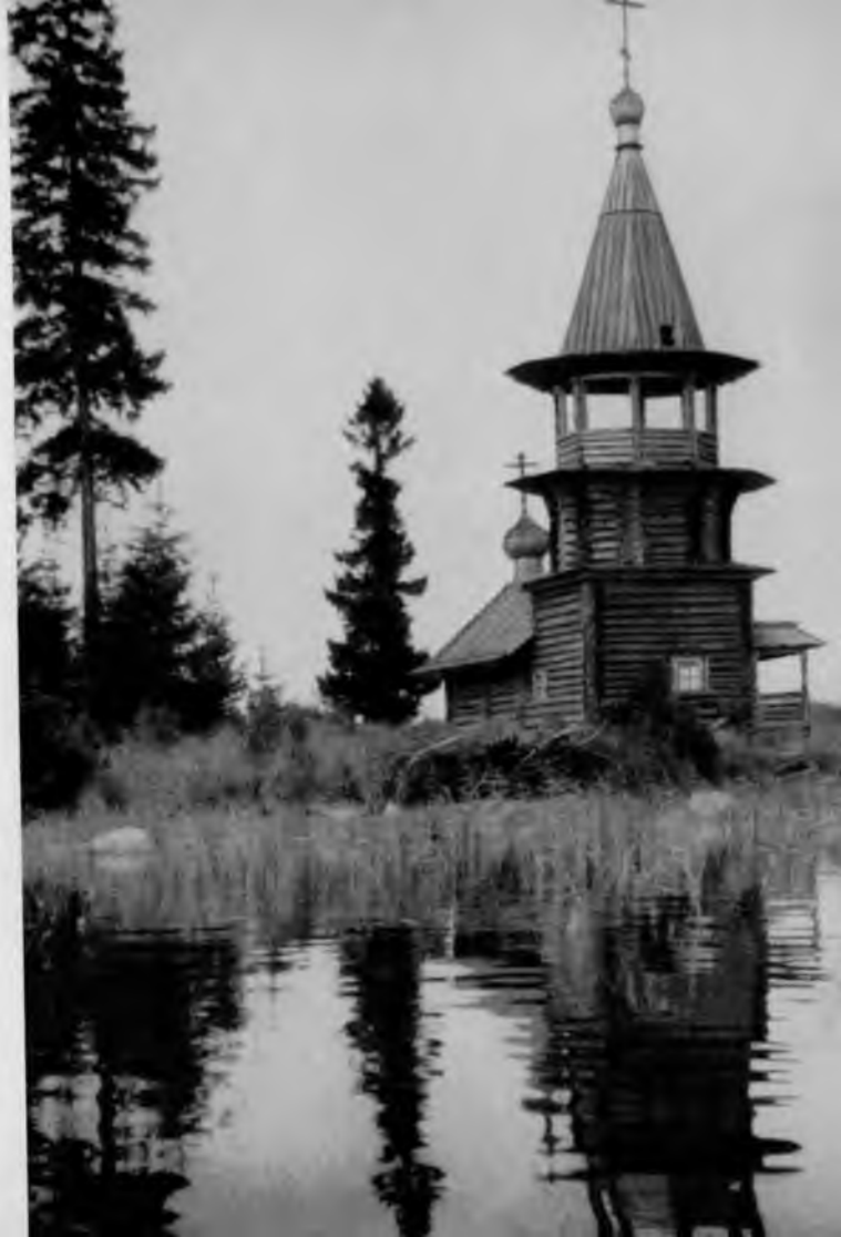
13. Часовня в деревне Корба

Строгости внешних форм и лаконичности деталей часовни в Корбе зодчие противопоставили праздничное звучание во внутреннем ее убранстве. Особой нарядностью выделяется «небо», покрытое сплошным узором стилизованных облаков, с вплетенными в них фигурами ангелов и серафимов. Эта роспись, напоминающая пеструю набойку, придает радостное настроение всему интерьеру часовни.