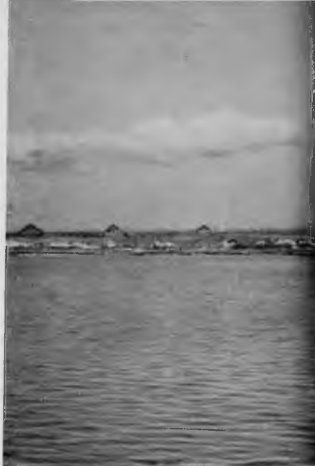
24. Церковь Петра и Павла в деревне Челмужи

Интерьер церкви сохранился достаточно хорошо, но в нем сосуществуют элементы первоначального убранства с более поздним. Очень скромная порезка тесовых лавок трапезной, традиционная яркая роспись «неба» четверика, тябла старого иконостаса, расписанные растительным орнаментом, по всей вероятности, ровесники самой церкви; раскраска же столбов, балок, дверей в бирюзовый, киноварно-красный и коричневый цвета — очевидно, была выполнена в XIX в. К этому же времени относится и нынешний иконостас.