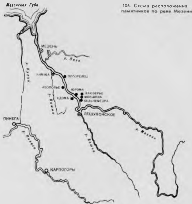
106. Схема расположения памятников по реке Мезени

старинные названия: Пылема, Кельчеггора, Юрома, Кеслома, Азополье, Лампожня. Почти все деревни тянутся вдоль узкой обрывистой береговой полосы в один или в два ряда домов.