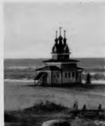
98. Георгиевская церковь в селе Пермогорье

по указу синода ее обшили тесом. И с этого времени, как с горечью писал И. Грабарь, «она потеряла больше, чем обыкновенно теряют деревянные церкви, так как ее линии и формы рассчитаны были на игру девственного сруба... Можно себе представить, что это была за сказка, эта славная нарядная церковка, венчающая береговую кручу Красавицы Двины, как раз здесь именно особенно широкой и особенно величавой».