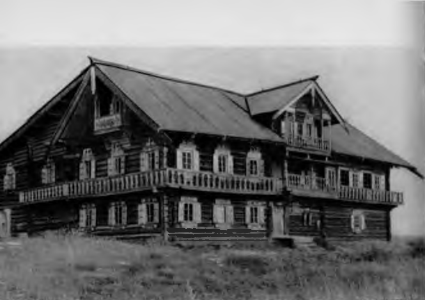
28. Дом Ошевнева в Кижях

К Ильинскому памятнику близка Вознесенская церковь в селе Типиницы, в 8 километрах от Усть-Яндомского погоста. Она отличается только завершением четверика, который увенчивается восьмериком с шатром, да большей, чем сама церковь, площадью трапезной.