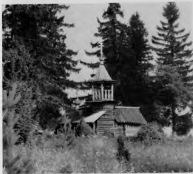
15. Часовня в деревне Подъельники

Много еще очаровательных маленьких часовен можно встретить, переезжая на кижанке с острова на остров.