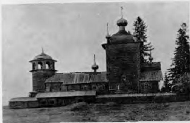
27. Ильинская церковь на Водлозере

До начавшейся в 1954 г. частичной реставрации церковь была чрезвычайно искажена. Она имела грубую сплошную