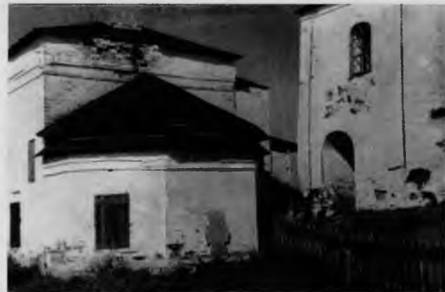
47. Апсида Надкладного храма

Фасады трапезной очень просты: западный, обращенный в сторону моря, представляет собою гладкую стену с узкими арочными окнами, южный расчленен лопатками, к восточному пристроена церковь с выступающей