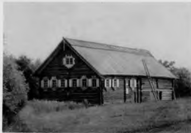
30. Дом Сергеева из деревни Логморучей

Отметим, что стены верхней части двора опираются не на низлежащие стены, а на столбы. Подобная конструкция позволяла без большого труда менять нижние венцы стен скотного двора, которые более всего подвергались разрушению. В этом проявилась мудрость народных мастеров.