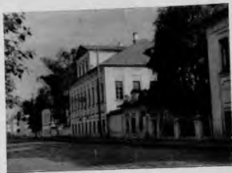
88. Великий Устюг. Жилые дома

Но в дальнейшем фортуна изменила городу. Сольвычегодск утратил былое значение. Торговые и промышленные пути, связывавшие Россию с Сибирью, передвинулись к югу. Строгановы центр своей деятельности также перенесли в иные места — на Урал, в район Перми. От прежнего Сольвычегодска сохранились только древние сооружения и тонкое мастерство местных умельцев. Сольвычегодск всегда славился производством чеканных, финифтевых (разноцветная эмаль) и других изделий из металла.