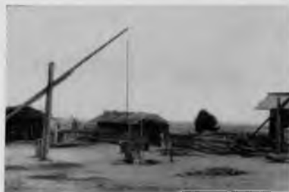
96. Село Белая Слуда. Хозяйственный двор жилого дома

Церковь-башня очень проста и строга, силуэт ее величествен и строен. Единственное, что смягчает суровость