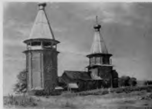
18. Варваринская церковь в деревне Яндомозеро

Здесь, на берегу тихого задумчивого озера, чуть поодаль от немногочисленных старых изб, стоит шатровая Варваринская церковь, построенная в 1656 г. Она