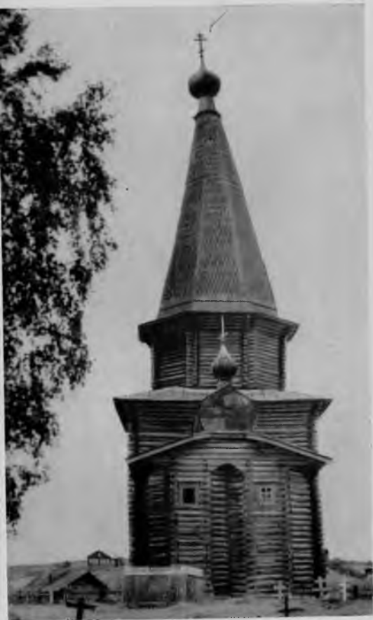
83. Георгиевская церковь в селе Поча

четырёхстенный сруб, стоящий на подклете, несет другой, восьмиугольный объем, покрытый очень высоким, стройным шатром с небольшой главкой. Вследствие малого сечения восьмерика по сравнению с четвериком, он опирается не на стены, а на балки перекрытия. Это — конструктивно ложный прием. К основному объему с востока присоединены два узких и высоких пятигранных сруба — апсиды, которые имеют общее покрытие, увенчанное небольшой бочкой с главкой. Единое покрытие сделано, очевидно, для облегчения конструктивной задачи. Но в композиционном отношении оно малоудачно. Едва ли не лучшей частью церкви является трапезная — большая, квадратная и примыкающее к ней крыльцо. Верхняя часть трапезной имеет не рубленую, а стойчато-дощатую каркасную конструкцию. Очень изящно и вместе с тем просто выполнена стена галереи, окна которой имеют фестончатые, вырезанные из досок перемычки. Внутри трапезной — два несимметрично стоящих резных столба. Крыльцо церкви — парадное, с широко раскинувшимися всходами — одно из самых эффектных в северном зодчестве.