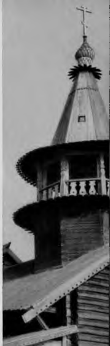
12. Часовня Петра и Павла. Звонница

Значительно чаще в Заонежье встречаются часовни XVIII и XIX вв. Они располагаются обычно по берегам озера, в устьях рек и по многочисленным островам. Поэтому надо сесть в кижанку и отправиться в увлекательную