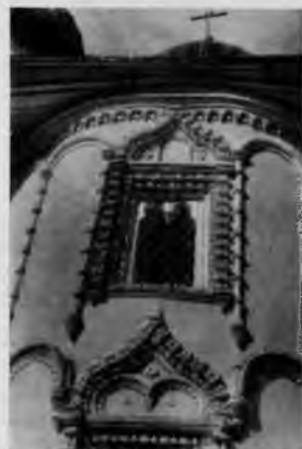
Благовещенская церковь в Каргополе