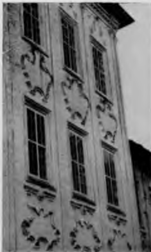
81. Троицкая церковь. Фрагмент фасада

примыкает просторная полу-круглая апсида, а с западной стороны—большая трапезная. Здание завершается пятью главами, из которых лишь центральная связана с внутренним помещением и является световой. Все главы опираются на сомкнутый кирпичный свод. Они очень своеобразны по форме. На основном граненом барабане возвышается тонкая шейка, которая несет непосредственно луковицу.