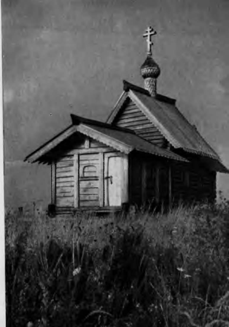
10. Лазаревская церковь Б. Муромского монастыря

Тябловый иконостас не совсем обычен. Он состоит из двух ярусов: верхнего «деисусного» и нижнего — «местного». Большинство икон написано в XV—XVI вв. Особенно привлекают красивые по цвету и тонкие по письму иконы верхнего ряда, изображающие архангелов Михаила и Гавриила, апостолов Петра и Павла и миниатюрные царские врата. Чтобы зрительно увеличить высоту помещения, на их створках, весьма удлиненной формы, написаны во весь рост фигуры Василия Великого и Иоанна Златоуста. Художник отказался от более распространенного сюжета