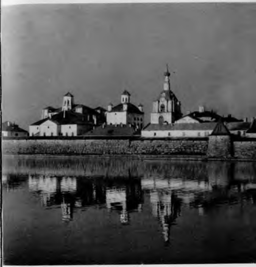
37. Соловецкий монастырь. Общий вид