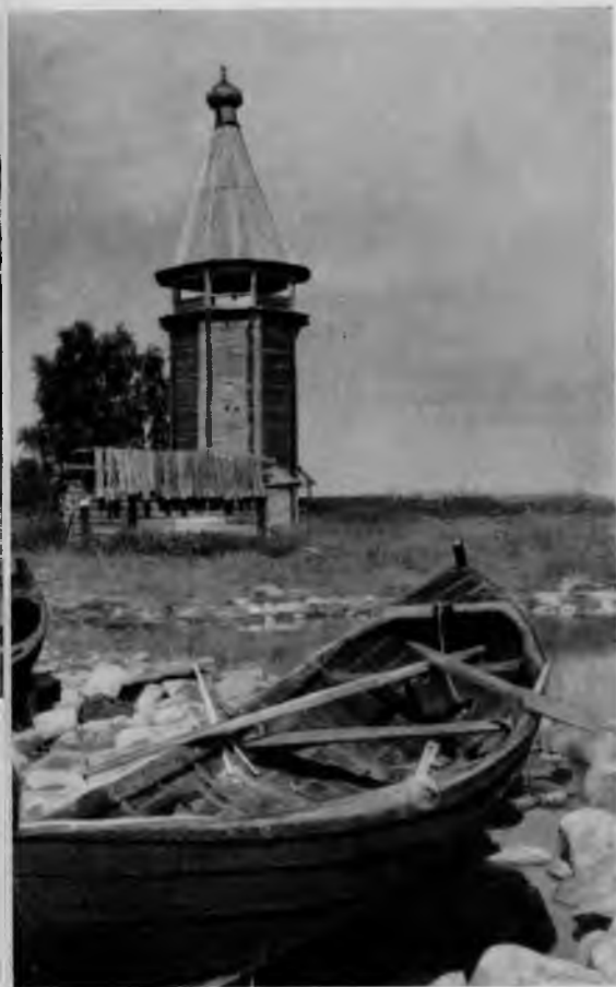
19. Колокольня Варваринской церкви.

представляет собой сруб, увенчанный шатром с двумя прирубам, восточным и западным. Церковь примечательна тем, что является одной из наиболее ранних, дошедших до нас построек типа «восьмерик на четверике».