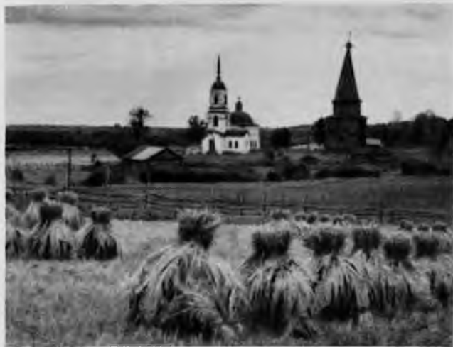
82. Село Поча

Необходимо отметить одну отличительную особенность церковной архитектуры Тотмы XVIII в.— фасады зданий в промежутках между ярусами окон заполняются картушами. Они выполнены из нескольких