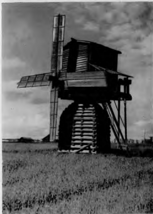
114. Мельница в селе Кимжа