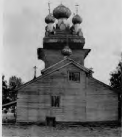
49. Вознесенская церковь. Западный фасад

Она сооружена в 1669 г. и принадлежит к тому типу церквей, которые строились со второй половины XVII в. вплоть до конца XVIII в. Особенно часто встречаются они на реке Онеге. Это храмы, завершенные кубоватыми крышами. В кубоватых церквях зодчие сумели, до некоторой степени, удовлетворить и требование московского духо-