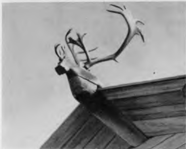
108. Охлупень жилого дома. Село Кимжа

жилых домов. Встречаются и другие изображения, но всегда они связаны с образами животных или птиц.