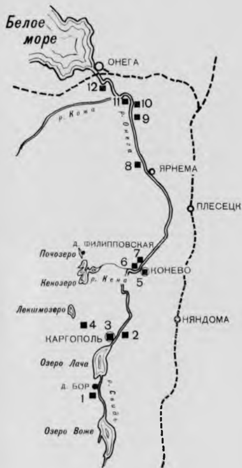
50. Схема расположения памятников в бассейне рек Свида и Онеги