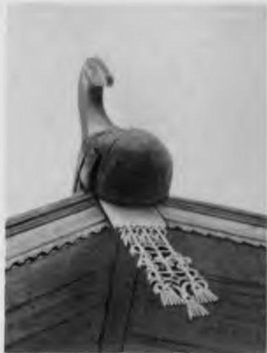
107. Охлупень и «полотенце» жилого дома. Село Кельчемгора