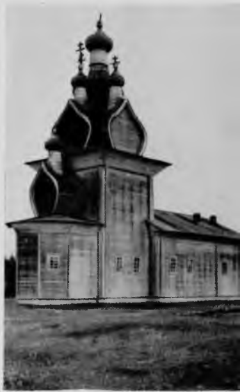
100. Никольская церковь в селе Едома

Церковь, построенная в 1700 г., чрезвычайно оригинальна по своему общему композиционному строю. Здесь нет традиционного восьмерика, все сооружение, по существу, состоит из одного вытянутого по вертикали квадратного сруба-четверика, к которому с востока примыкает большой пятигранный сруб — апсида, а с запада — трапезная. Основной объем покрыт невысоким граненым шатром, в который со всех