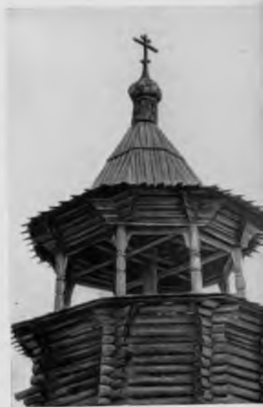
Колокольня в деревне Цывозеро

Колокольня стоит уже более трех веков. Ее замшелый сруб осел и накренился, и теперь кажется, что он вырастает из земли. Цывозерская колокольня принадлежит к так называемым «девяностолбным» сооружениям. Ее каркас, состоящий из девяти вертикально стоящих толстых бревен, защищен на большую часть своей высоты восьмиугольным срубом. На уровне яруса звона эти столбы открыты и украшены резьбой — овальными «дыньками» и тонкими «жгутами». Еще выше — четыре венца образуют повал, поддерживающий полицы невысокого восьмиугольного шатра, покрытого тесом.