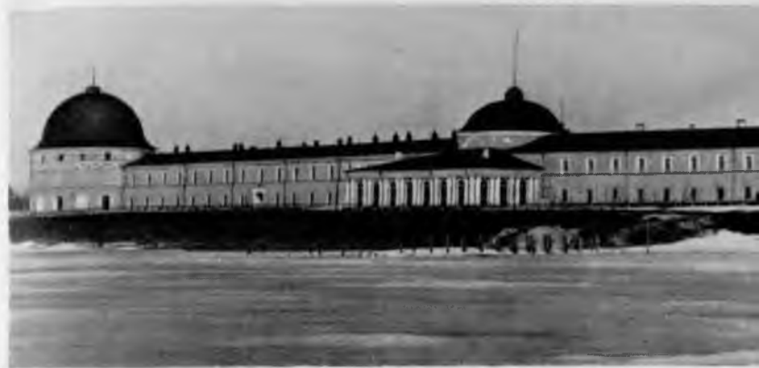
105. Архангельск. Гостиный двор

Главное место в старинной архитектуре Архангельска занимает Гостиный двор — один из крупнейших и интереснейших памятников русского зодчества второй половины XVII в. Он находится в самом центре города и выходит главным фасадом на набережную Северной Двины. Это огромное каменное сооружение было заложено в 1668 г. и строилось до 1684 г. Образцом для него послужил московский Гостиный двор. Фактически создавался, как его тогда называли, «каменный город» — торгово-административный центр Архангельска. Он состоял из двух основных частей: русского Гостиного двора и находившегося по соседству «немецкого» Гостиного двора (то есть Гостиного двора для иностранцев) со складом товаров и