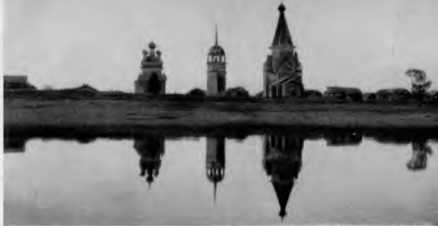
71. Погост Вазенцы

Еще до недавнего времени в центре села стояло три сооружения: пятиглавая, покрытая кубом, церковь Климента (1685 г.); шатровая Вознесенская церковь (1651 г.)