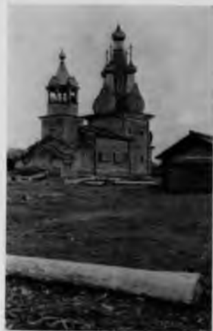
Одигитриевская церковь в селе Кимжа