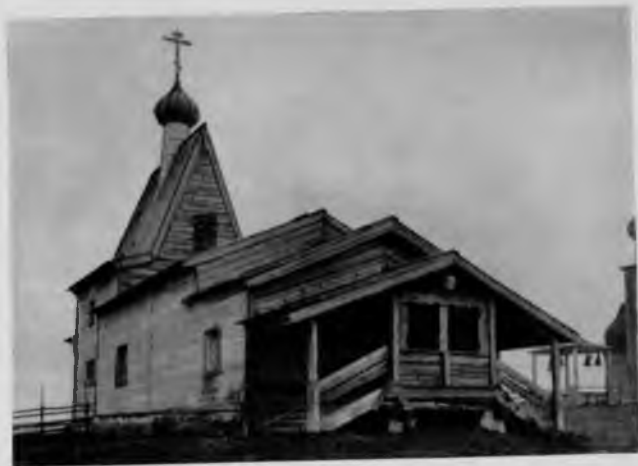
104. Васильевская церковь в селе Чухчерьма

Среди восьмигранных церквей встречаются постройки, возведенные по древнему правилу «храма о двадцати стенах» (церковь в Заостровье и др.). Своеобразным вариантом двадцатистенного сооружения является Троицкая церковь в Неноксе, где над прирубами возвышаются шатры, отчего вся постройка становится пятишатровой.