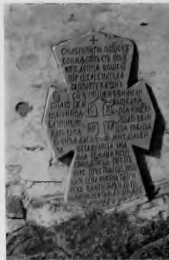
44. Надлежный храм. Крест, вмурованный в стену апсиды

Сооружение монастыря на Кий-острове приобретало для Никона первостепенное значение.