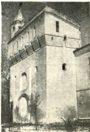
Северо-Западная башня кремля.

В 1671-1672 гг. во время страшного голода в Вологде были построены вокруг двора большие каменные стены с бойницами, с несколькими