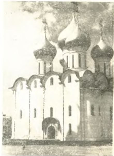
→ Софийский собор.

В 1848-1851 годах на средства, собранные из «добрыхотных» пожертвований вологжан, произвели третий капитальный ремонт Софийского собора. Как и при первом обновлении, работы начались со стенной росписи. Поблекшие от времени фрески были «возобновлены» ярославским иконописцем Колчиным. Но это «возобновление» представляло собой грубую «запись» высокохудожественной живописи Плеханова. Во время ремонта ко всем трем соборным порталам были при-