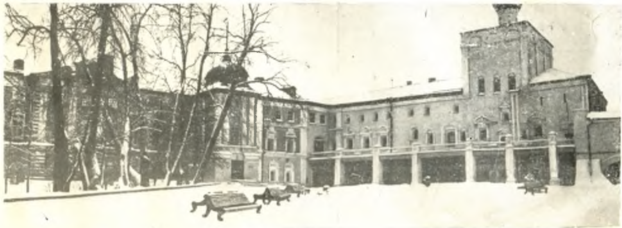
Внутренний двор кремля.

В XIX столетии за Архиерейским двором утвердилось название Вологодского кремля, хотя он занимает лишь небольшую часть территории построенного при Иване Грозном подлинного городского кремля.