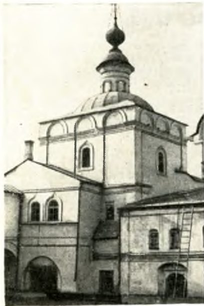
← Надвратный комплекс.

В 1680 году над воротами восточной стены, прямо против Софийского собора, поставили небольшую каменную надвратную Воздвиженскую церковь. С запада