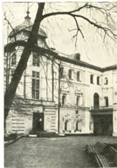
→ Гаврииловский корпус.

к Симоновскому корпусу примкнуло еще одно трехэтажное здание, получившее название Гаврииловского корпуса. В первой половине XVII столетия, до появления более поздних построек, оба эти трехэтажных корпуса выглядели как одно Г-образное великолепное здание. Такое впечатление усиливалось большим сходством их фасадных деталей — наличников, поясков, карнизов.