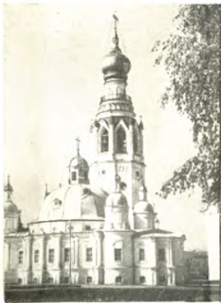
Воскресенский собор и колокольня.