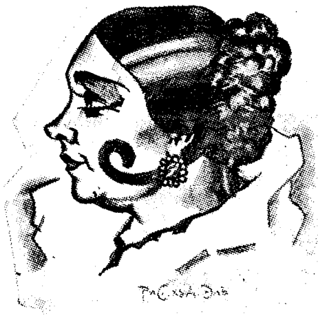
Аглая, арт. Р. И. ТАМАРИНА.

зависимость от той социальной группировки, в которую эта личность включена. В этом отношении драматургия Киршона является действительно новой. Она нова не только по формальной драматической структуре, сколько по тем общественным и социальным предпосылкам, которые стоят за формальной структурой и которым еще только предстоит выработать новую форму театра.