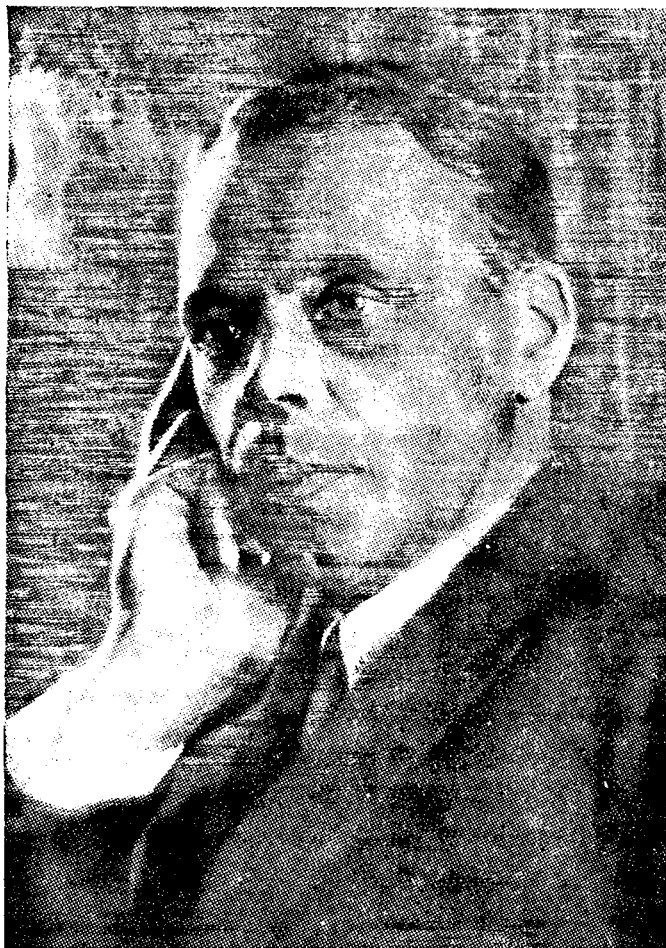
Артист Ленинградских театров