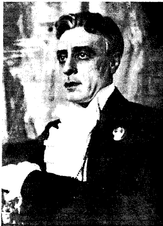
Заслуженный артист (КССР) Д. А. ЛЕТКОВСКИЙ