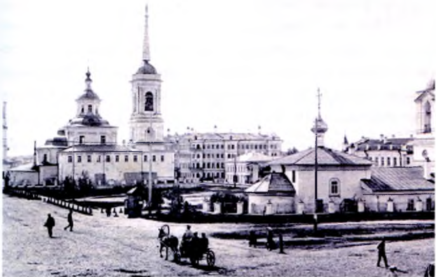
Вологда. Сенная площадь. Конец XIX века.

Учитель откровенно рассказал, о чём шла речь, и закончил так: