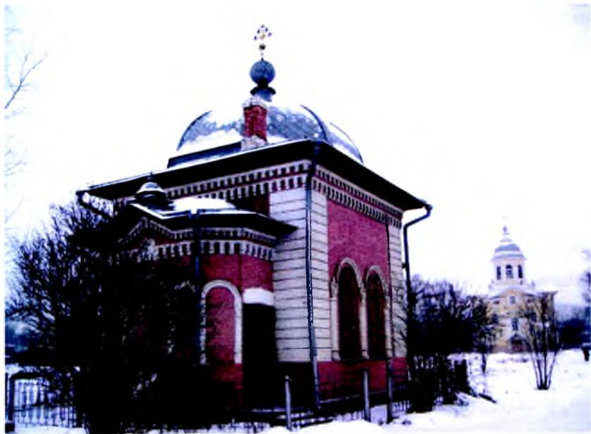
Часовня на могиле святого праведного Николая Вологодского. Вдали собор Рождества Пресвятой Богородицы

Народный обычай брать песочек для исцеления может показаться не вполне христианским, скорее языческим. Однако по слабости нашей нам нередко нужна опора в молитве, а вещественная связь с угодником Божиим в виде песочка с его могилы помогает нам молиться. Так же, как помогает нам молиться икона святого.