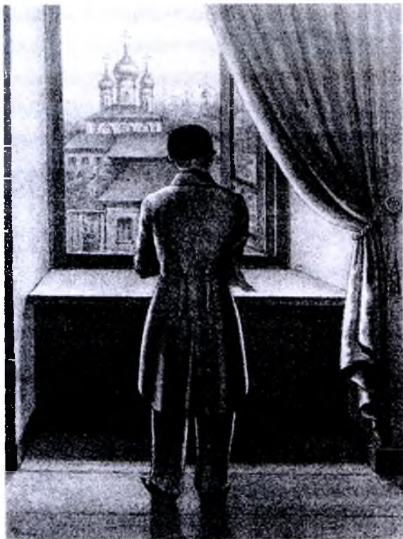
К.Н. Батюшков. С рисунка Н.В. Берга

– Я его старый приятель из Устюжны. Доложите, пожалуйста.