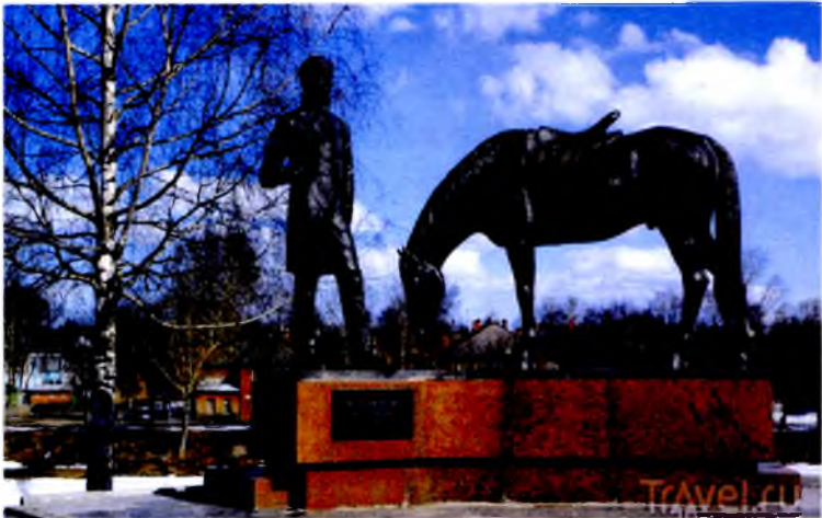
Памятник Константину Батюшкову в Вологде. Скульптор В.М. Клыков