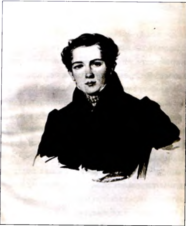
К.Н. Батюшков. 1830 г.

друзья - Жуковский, Карамзин, Гнедич узнали о моём приезде и начали меня навещать. Они были очень обеспокоены моим состоянием. Пошли преувеличенные слухи о моём сумасшествии. Я подал просьбу министру иностранных дел Нессельроде о поездке в Крым и на Кавказ, получил разрешение и отправился на юг.