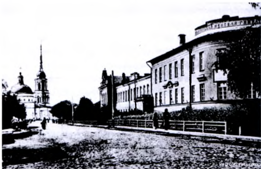
Дом на улице Малой Благовещенской, в котором жил поэт Константин Батюшков с 1833 г. по 1855 г. Фото начала XX века

– Ещё одно видение! – недовольно подумал учитель и уже хотел пройти мимо Николая. Он с каким-то презрительным недоверием относился к этому безумному человеку. Однако тот вдруг остановился и, глядя пронзительными чёрными глазами, произнёс грубым голосом: