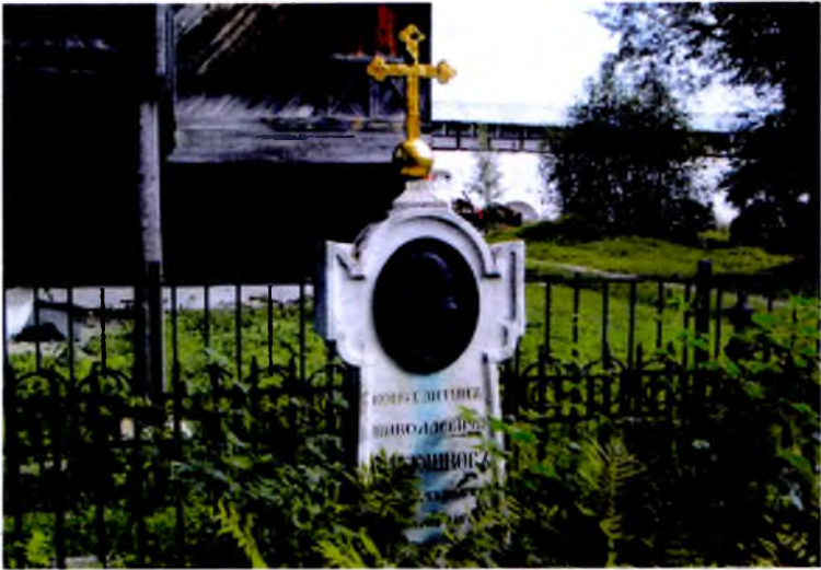
Могила К.Н. Батюшкова в Спасо-Прилуцком монастыре под Вологдой