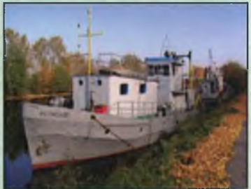
Теплоход «Ихтиолог». Белозерский канал.

В 1970-1980-е годы коллективом лаборатории изучались малые озера области с целью реконструкции ихтиофауны и повышения рыбопродуктивности. Проведены кадастровые исследования малых водоемов, на базе нескольких озер Лозско Азатской группы Белозерского района создано опытное товарное хозяйство по искусственному воспроизводству сиговых рыб. Наряду с этими исследованиями проводились работы по оценке ущерба рыбному хозяйству от ввода