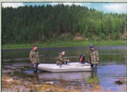
На реке Сухоне

В рамках научно-исследовательских работ лаборатории разрабатываются основы биотехники выращивания сиговых и карповых рыб в Кадуйском тепловодном хозяйстве. В 1987 году проведено вселение судака в озеро Воже, что послужило началом изучения закономерностей формирования его популяции. В период с 1989 по 1992 годы сотрудниками лаборатории проводилось комплексное изучение реки Сухоны с её притоками.