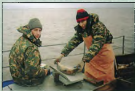
На озере Воже.

В последнее десятилетие наряду с традиционными направлениями исследований водных экосистем