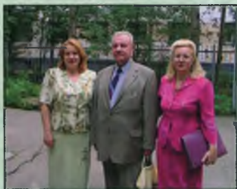
Конференция в Архангельске (2005)

За 35-летний период деятельности Вологодской лаборатории ФГНУ «ГосНИОРХ» сотрудниками