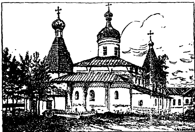
Соборъ Рождества Пр. Богородицы.

ниже) и, конечно, много помогла устройству обгорѣвшей обители. Можно думать, что именно на средства владыки Іоасафа въ концѣ XV вѣка построенъ былъ каменный соборный храмъ во имя Рождества Пр. Богородицы, для росписи котораго былъ приглашенъ лучшій художникъ того времени иконописецъ Діонисій, который по заказу Государя Іоанна III расписывалъ въ Москвѣ соборы Успенскій и Благовѣщенскій. Эти фрески Терапонтовскаго собора представляютъ