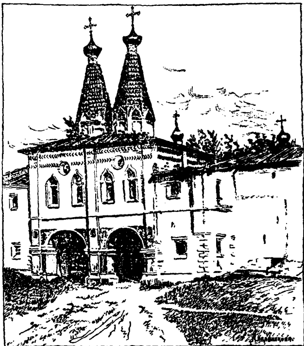
Церковь патриарха Никона надъ св. вратами Оерапонтова монастыря.

посланнаго въ соборъ иноческій, умоляль открыть тайную причину зова княжескаго, потому что не разумѣль какое дѣло можетъ имѣть державный до человѣка грубаго и невѣжественнаго, тѣмъ паче, что инокамъ подобаетъ у себя безмолствовать, а не ски-