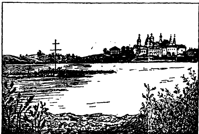
Островъ, сдѣланный патріархомъ Никономъ на Бородавскомъ озерѣ вблизи Ферапонтова монастыря.

плакалъ, услышавъ о намѣреніи удалить его прис- ныхъ, и со слезами просилъ оставить ихъ при немъ, ради его старости, обѣщая впредь поминать Іоакима святѣйшимъ патріархомъ, чего прежде не дѣлалъ потому, что почиталъ его причиною всего зла. Онъ даже намекнулъ, что при началѣ своего удаленія въ Новый Іерусалимъ, когда дѣло шло объ избраніи ему