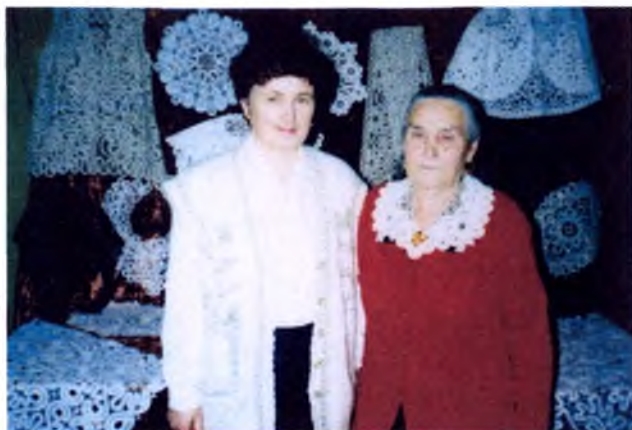
Районный фестиваль Семья России» 2000 год