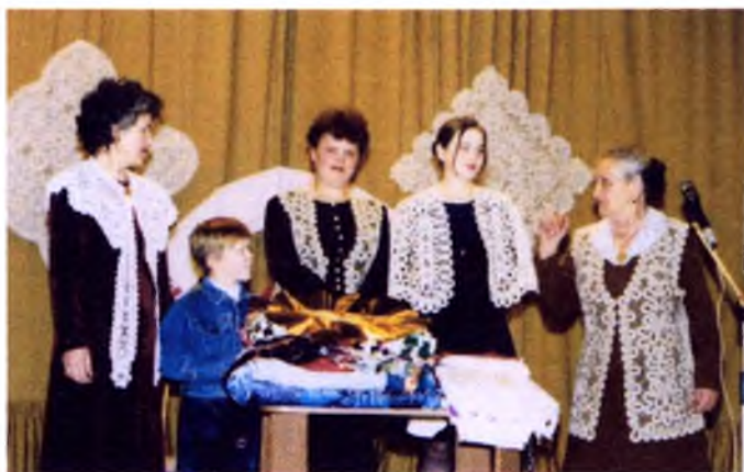
Праздники: в Борисовском доме культуры Мастера земли борисовской. 1995год