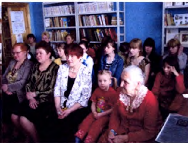
Праздник кружева в библиотеке «Ах, вологодский кружевной узор». 2010г.