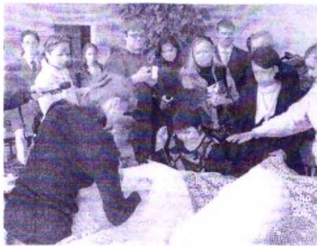
За работой кружевниц наблюдали почетные гости конкурса Татьяна Михалкова и знаменитый модельер Валентин Юдашкин