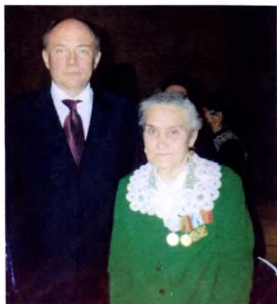
с Губернатором Вологодской области Позгалевым В.Е. на торжественном приеме «Женщина года-2003»