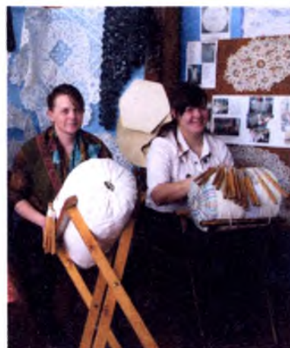
На празднике кружева в библиотеке «Ах, вологодский кружевной узор!»