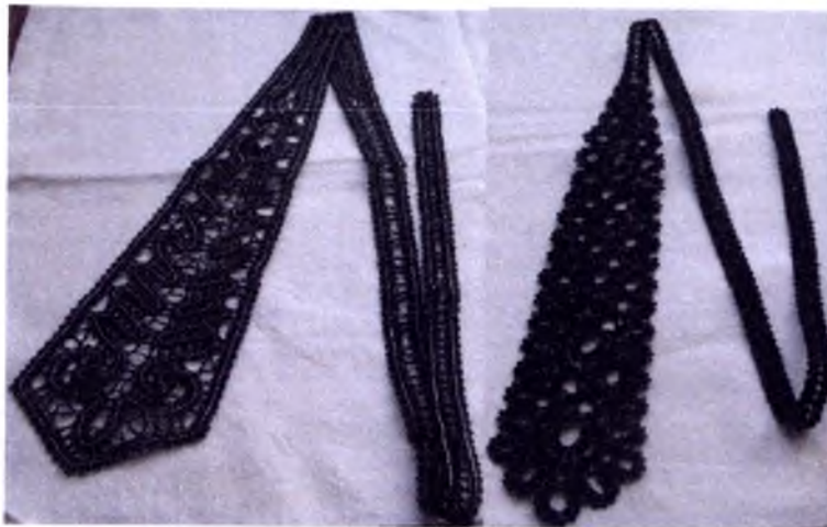
Мужской и женский галстуки