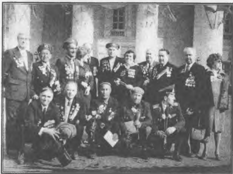
Ветераны 98-й Гвардейской воздушно-десантной Свирской Краснознаменной ордена Кутузова дивизии. Начало 80-х гг.