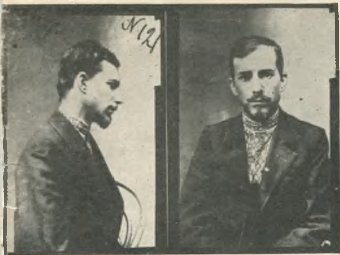
Тюремные снимки Луначарского.

Луначарский сближается с рабочими винного склада и ведет среди них революционную пропаганду. Под его влиянием создается в Вологде артель каменщиков, для которой он написал Устав.