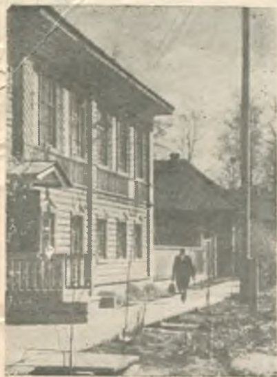
Дом Упадышевой на Стретенской улице (ныне Советской) в Тотьме, где в 1903—1904 гг. жил Луначарский.