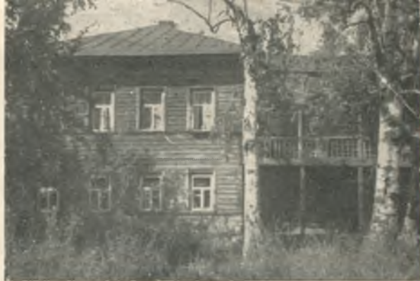
Дом почтовой станции на Архангельском шоссе (ныне ул. Чернышевского, 60) в г. Вологде. Здесь часто бывал Луначарский.

Связь Луначарского с рабочими, его выступления в печати и на собраниях интеллигенции встревожили местное начальство. По распоряжению губернатора за «возмутительное» поведение Луначарский направляется этапом в более далекое место ссылки, в уездный город Тотьму. По дороге Анатолий Васильевич несколько дней содержался в кадниковской тюрьме.