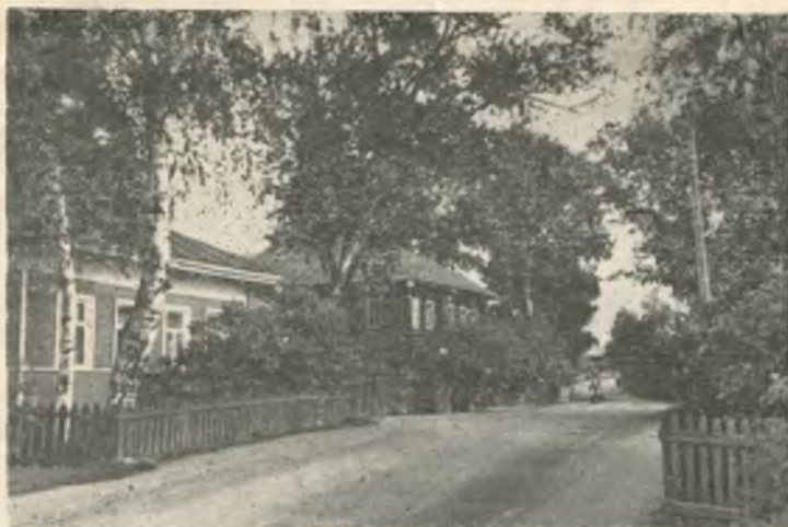
Улица А. В. Луначарского в г. Волгоде.

Дом-музей М. И. Ульяновой открыт ежедневно с 11 до 17 часов.