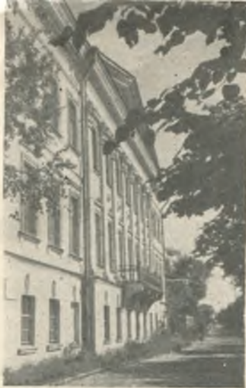
Дом купца Витушенникова в г. Вологде, в котором помещалось губернское земство, где бывал Луначарский в 1902 году.