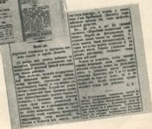
Издавания, в которых сотрудничал Луначарский во время ссылки.