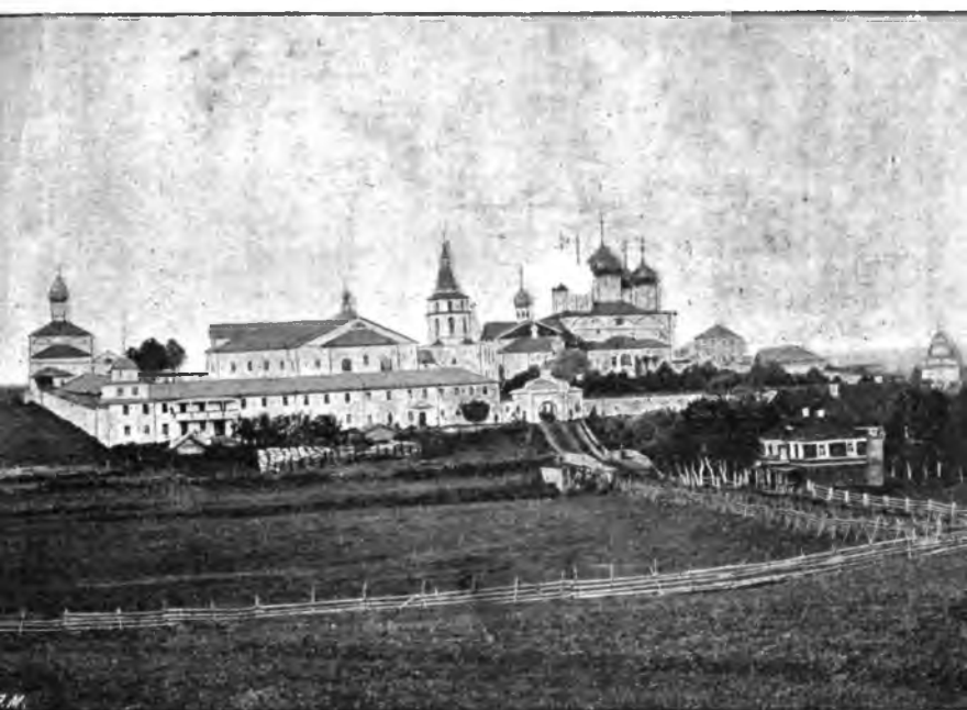
ВИДЪ КОРНИЛІЕВО-КОМЕЛЬСКАГО МОНАСТЫРЯ, ГРЯЗОВЕЦКАГО УВЪЗДА, ВОЛОГОДСКОЙ ГУБЕРНІИ, ВЪ 1904 ГОДУ.