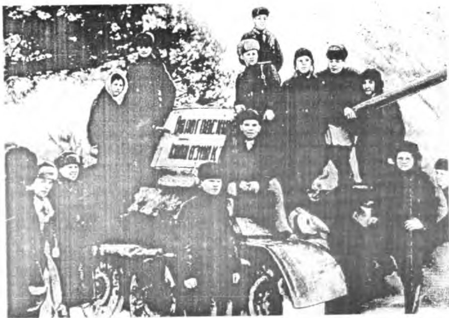
Делегация вологжан передает танковую колонну «Вологодский колхозник» 1-й танковой армии. Северо-Западный фронт. 2 марта 1943 года