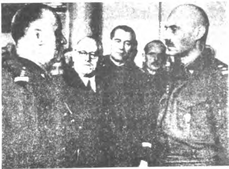
Генерал В. Сикорский (справа), приглашенный из Лондона в Москву, принимает рапорт от генерала В. Андерса во время смотра польской дивизии. В центре — заместитель наркома иностранных дел Союза ССР А. Я. Вышинский

Сикорского еще в 1941 году доходила информация о том, что поляки содержатся не только в Грязовце, но и «в различных лагерях Вологды и вокруг». Сегодня можно с уверенностью сказать: сведения подобного рода не были лишены оснований. В архивных делах есть, к примеру, данные об освобождении из Вытегорского лагеря более 300 поляков. По идее все они должны были прибыть в Грязовецкий лагерь, который осенью 1941 года превратился в сборный мобилизационный пункт. Однако никаких сведений, подтверждающих или опровергающих данную версию, в архивах обнаружить не удалось. Зато есть списки умерших поляков, которых по неизвестным причинам Указ об освобождении обошел стороной.