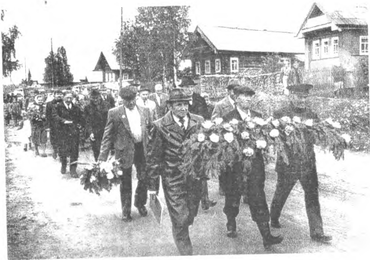
22.06.90 г. На открытии памятника погибшим землякам в колхозе им. Кирова Нюксенского района.