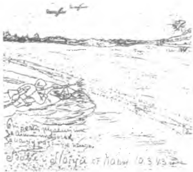
Рисунок А. И. Садового для своих детей Наташи и Вовы