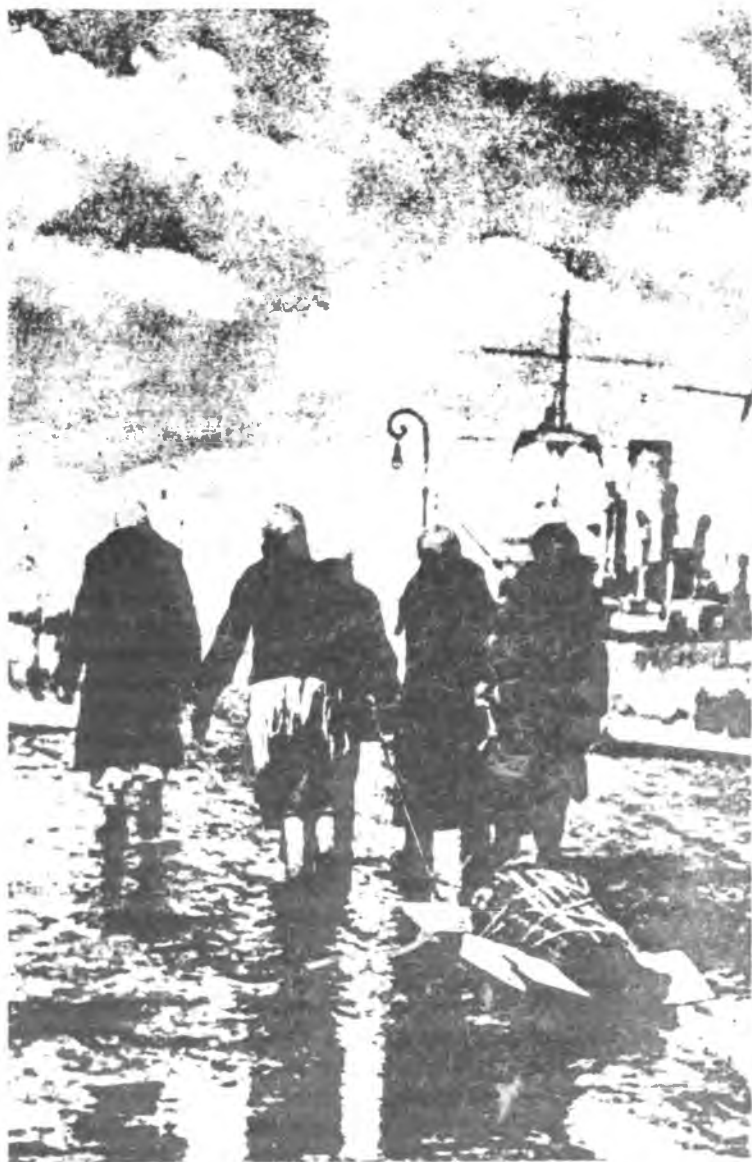
В последний путь