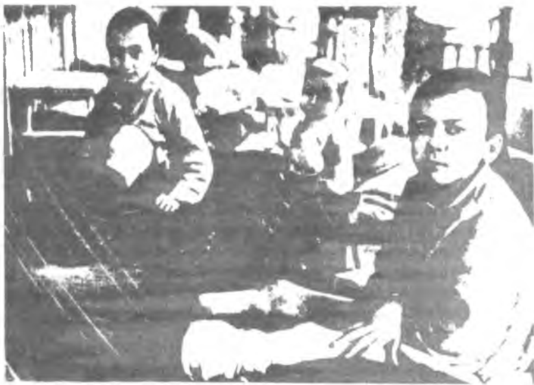
Ленинградские дети, изувеченные осколками снарядов

Изначально медленные темпы эвакуации позднее до предела обострили проблему транспортировки людей в тыл. В августе Октябрьская и Северная железные дороги ежедневно не укладывались в графики отправки эшелонов. Вражеская авиация все чаще и чаще наносила ощутимые удары по узловым станциям, разрушала пути, бомбила эшелоны с эвакуированными. Постановление горкома партии и исполкома Ленгорсовета об отправке в тыловые районы дополнительно 700 тысяч женщин, детей, пенсионеров, больных так и осталось на бумаге. Успели, правда, эвакуировать 147 тысяч беженцев, которые ютились в переполненных общежитиях, дневали и ночевали на железнодорожных вокзалах.