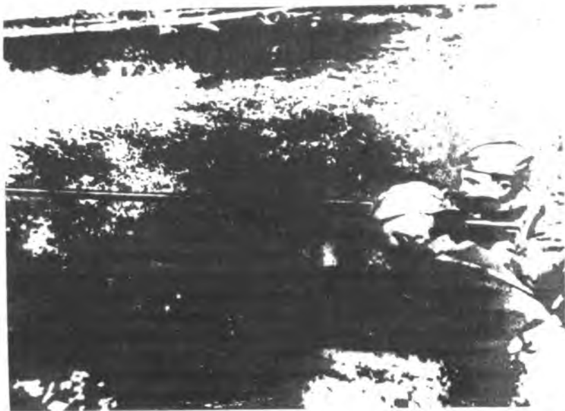
Лето 1941 года. На Лужском рубеже