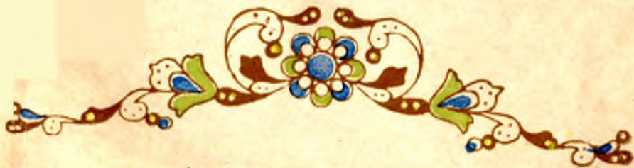
Финифтяный рисунок с венчиком