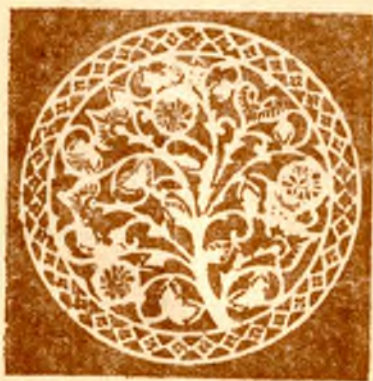
Узоры резной берёсты на шкатулках. Шемогодский комбинат.