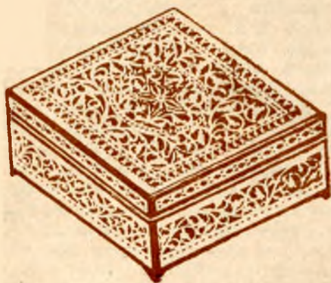
Узор резной берёсты на шкатулке. Артель „Солидарность“.