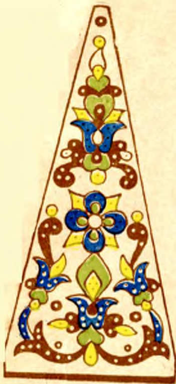
Одна из граней восьмигранной ладоницы XVII в.