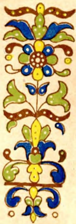
Рисунок рукоятки кропила XVII в.