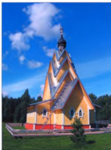
Часовня в д. Никиткино. XXI в.