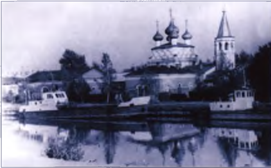
Набережная, по которой главный герой убежал от милиционеров.