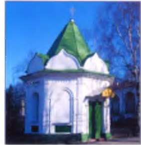
Часовня Кирилла Новозерского.