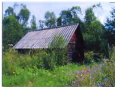
Банька на берегу Мериновского озера.

Выезд в д. Садовая: прогулка к «дому Любы Байкаловой», к «дому матери Егора Прокудина, бабушки Куделихи», к баньке и на озеро Мериновское.