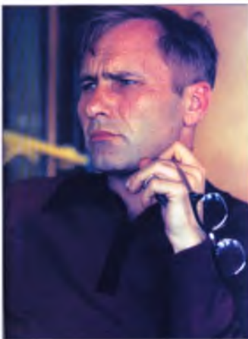
Василий Макарович Шукшин.

Василий Макарович Шукшин (1929-1974). Лауреат Ленинской и Государственной премий СССР, заслуженный деятель искусства РСФСР. Рано лишившись отца, В. Шукшин работал с двенадцати лет в колхозе на Алтае (военные и первые послевоенные годы), затем на заводе во Владимире, был разнорабочим, слесарем... С 1954 году поступил во ВГИК на режиссерский факультет. К этому времени В.Шукшин был уже вполне сложившимся двадцатипятилетним человеком, много повидавшим, закалённым в жизненных испытаниях и житейских невзгодах. Его наставник М. Ромм скоро и достойно оценил необычайный талант Шукшина и сделал всё возможное, чтобы он смог плодотворно и широко развиваться.