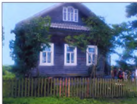
Дом, где располагается экспозиция «Стоп-кадр».