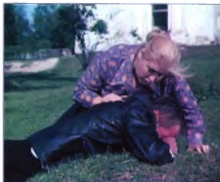
Сцена покаяния снималась у разрушенного храма в д. Садовая.