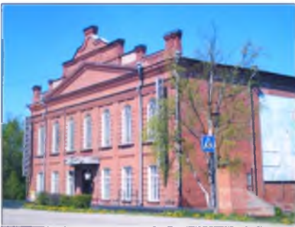
В Доме культуры состоялся первый показ фильма.