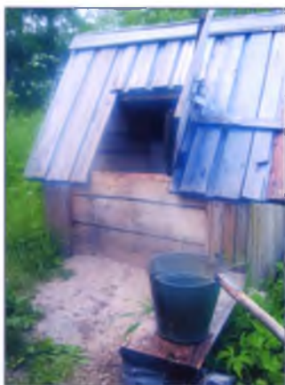
Святой источник в д. Никиткино.