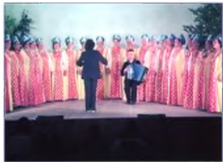
Хор Дома культуры.