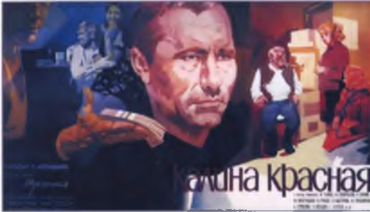
Афиша фильма «Калина красная».

Выйдя из тюрьмы, Егор Прокудин, по кличке Горе, решает податься в деревню, где живет синеглазая незнакомка Люба, с которой он переписывался — ведь надо немного переждать и осмотреться.