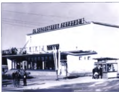
Кинотеатр «Балтика». Здесь съемочная группа смотрела отснятый за день материал.