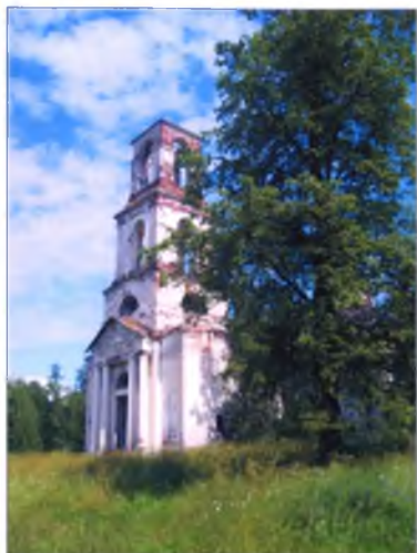
Церковь Рождества Богородицы. XVIII в.

В.М. Шукшин, сын репрессированного крестьянина-средняка, в Белозерске нашел то, что искал—место, где преображается человек под влиянием труда, матери-природы и православной веры. От имени своего поколения кинохудожник принес покаяние за поруганные святыни, за разрыв с православными корнями и деревней.