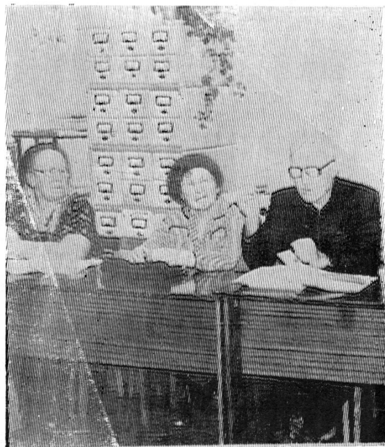
На занятии клуба «Краевед».

В 1977 году образована в районе централизованная библиотечная система, и Кадниковская библиотека—центральная районная. Увеличен штат библиотекарей. Кроме отдела об-