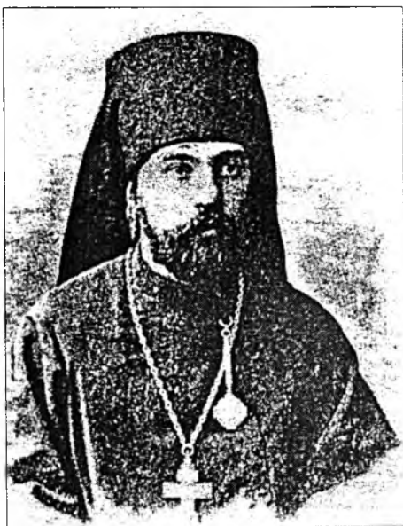
Архиепископ Кирилловский Тихон (Тихомиров)

После революции в 1920-е годы Антониево-Черноезерская Богородичная пустынь была закрыта, насельники репрессированы. В эти скорбные годы обитель посещал архиепископ Кирилловский Тихон (Тихомиров) [5]. По воспоминаниям людей, близко знавших владыку, он был молитвенником и аскетом [2; 5; 6] В 1920 г., незадолго до своего ареста, владыка написал свой первый акафист преподобному Антонию Черноезерскому . «Текст акафиста свидетельствует о том, что владыка бывал на Черном озере, служил в храме упраздненного в XVIII веке монастыря. В акафисте преподобному Антонию прославляется монашеский подвиг, подвиг великих отцов Северной Фиваиды. И через преподобного владыка молитвенно обращается ко всем преподобным отцам и подвижникам о помощи всем сохранившим верность Богу в лютое время гонений на Церковь и верующих. «Стена неборимая и прибежище спасительное буди... прибегающим и просящим твоего заступления в годину бед и напастей. Буди стена крепкая и покров надежный, ограждая нас от всяких злоключений и козней... Радуйся, воине Царя Небесного, пошли нам победу противу плоти, мира и диавола» (икос 11) [5; см. также 6].