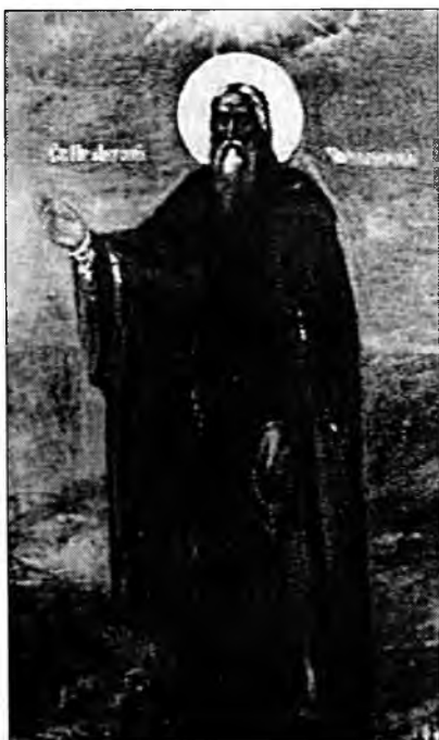
Преподобный Антоний Черноезерский 17 января (ст.ст.) 30 января (нов. ст.)

Яко избранник Божий, Антоние, прославися на езере Черном, не иский славы от человек, и Бог прослави тя в чудесех Своих.