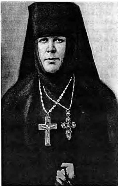
Игуменья Таисия Леушинская

На следующий день после Божественной Литургии икона отправилась Крестным ходом в Черноезерскую пустынь. Во время шествия из каждой деревни навстречу образу выходили крестные ходы с хоругвями и иконами. В каждой деревне служился молебен [3: 19]. Напротив деревни Квасюнино «на переправе у реки Шексны грандиозный Крестный ход встретили два других – из пустыни и погоста Веретья. Все крестные ходы соеди-