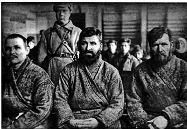
Крестьянам объявляют приговор