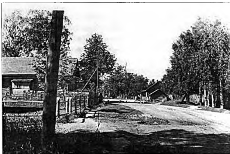
Улица в деревне Квасюнино