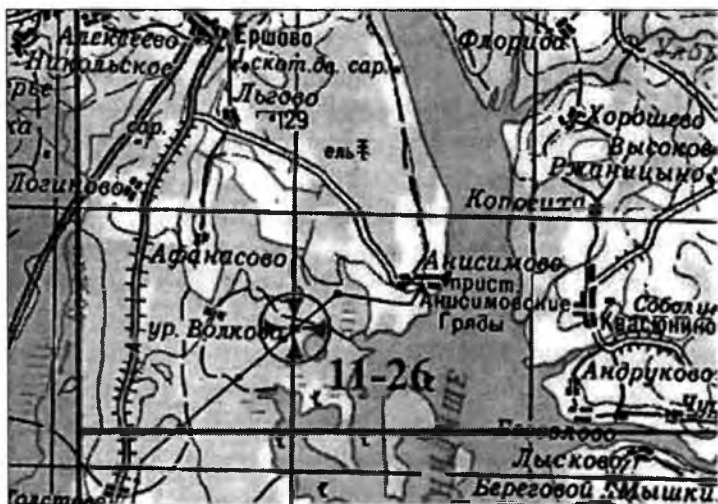
Фрагмент листа 92 из 2-го тома «Церковно-исторического атласа Вологодской области». Шифр 11-26 – Антониева пустынь.

До революции деревня Квасюнино была приписана к Чуровско-Черноезерскому приходу. Церковь, прихожанами которой были жители деревни, находилась за рекой Шексной и называлась Богородице-рождественской Черноезерской. Она находилась в урочище Чёрные Озерки юго-западнее деревни Анисимово. В церкви под спудом покоились мощи преподобного Антония Черноезерского , пришедшего спастись в глухие леса в XVI веке. В рукописных святцах отнесен он к Вологодским подвижникам и наименован «пустынником за лесом». Память его чтится 17-го января по старому стилю (30 января по новому стилю). Преподобный основал Черноезерскую в честь Рождества Пресвятой Богородицы мужскую пустынь (монастырь). Пустынь дважды разоряли поляки (в 1585 и 1610 гг.), она была сожжена, а потом восстановлена. Затем в конце XVIII века монастырь был упразднён. Сохранилась лишь деревянная монастырская церковь, заново построенная в 1875 году, которая стала приходской [1; 3; 7].