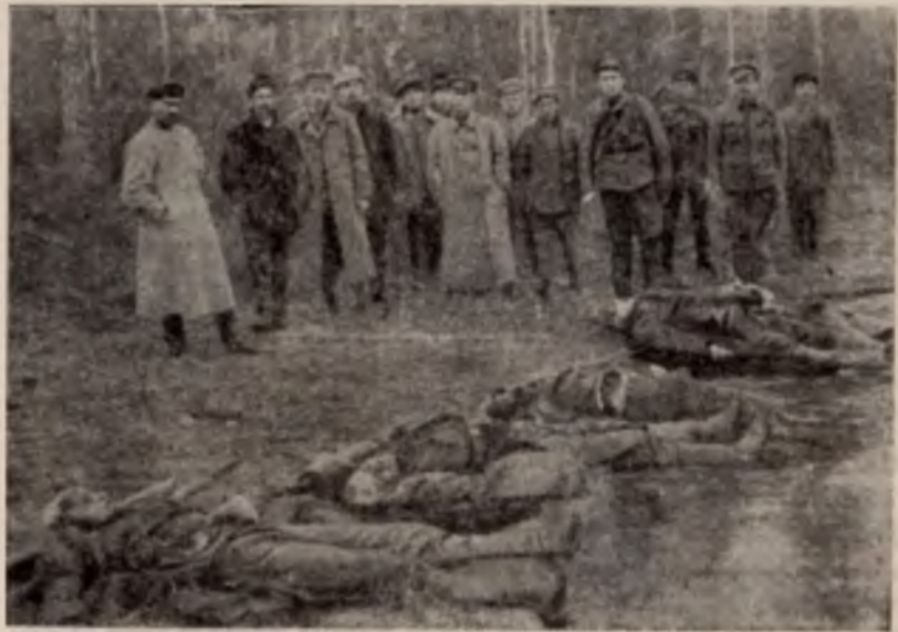
Жертвы интервенции на севере