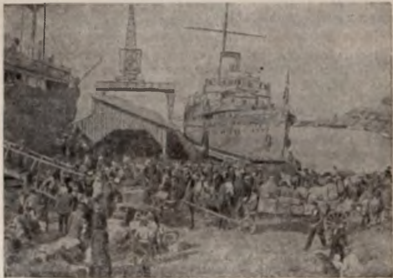
Эвакуация белых из Архангельска