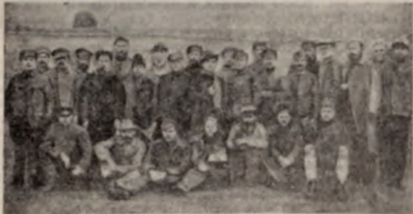
Заложники, взятые оккупантами