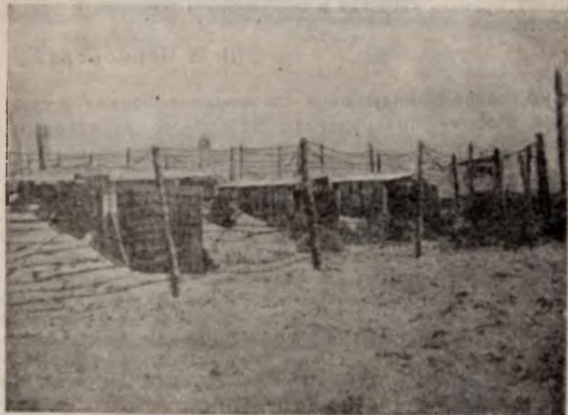
Английский контргражданский лагерь на о. Мудьюг