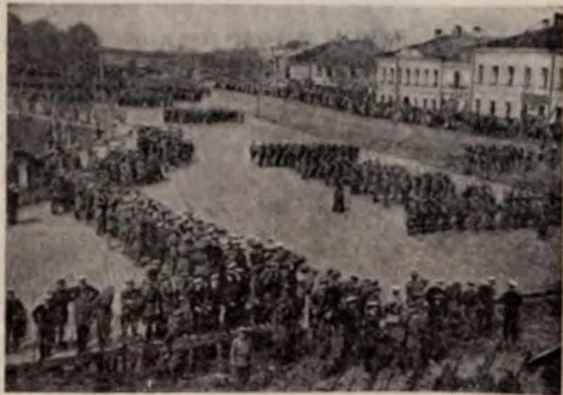
Парад английских войск в Архангельске