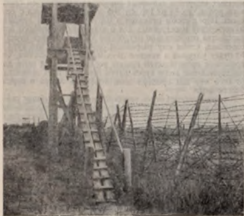
Сторожевая английская вышка на о. Мудьюг