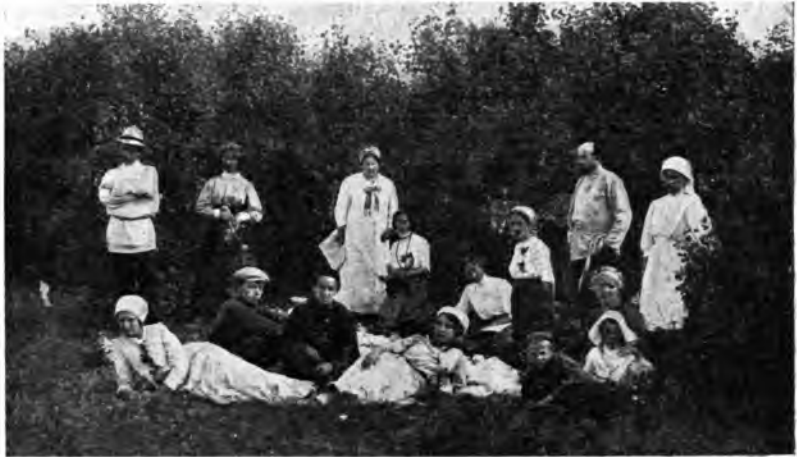
Рис. 21. Пикникъ.

Къ числу вреднаго времяпрепровожденія кумысниковъ принадлежатъ еще сидѣнія группами въ комнатахъ. Къ удивленію, это нерѣдко бываетъ. Сидѣтъ въ комнатѣ, когда надо пользоваться воздухомъ!