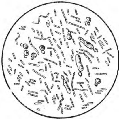
Рис. 4. Микроскопическая картина закваски. Палочки—кумысные бактеріи; овальныя фигуры—дрожжевые грибки.

Кобылье молоко бродитъ подъ вліяніемъ закваски. Но въ закваскѣ дѣйствующимъ началомъ являются бактеріи, какъ причина всякаго броженія. Если взять каплю закваски и „разсмотрѣть ее“ подъ микроскопомъ, то увидимъ слѣдующую картину. Все поле занято палочками, то короткими, то