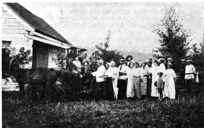
Рис. 22. Отъѣздъ.

Существуетъ мнѣніе, что кумысная прибавка въ вѣсѣ быстро пропадаетъ. Это невѣрно. Кумысный вѣсѣ держится