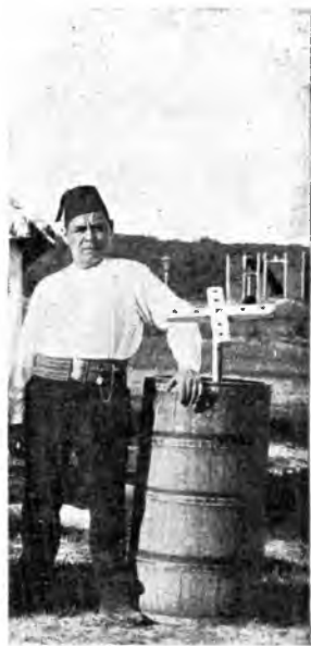
Рис. 8. Кадка для приготовления кумыса. Въ ней мутовка.

Рис. 7. Холодильникъ. Сверху чрезъ кинку течетъ ледяная вода. Молоко наливаютъ въ воронку змѣвиднаго цилиндра; чрезъ отверстія, продѣланныя въ воронкѣ сбоку внизу, протекаетъ по желобкамъ молоко и такъ какъ внутри змѣвика ледяная вода, молоко охлаждается.