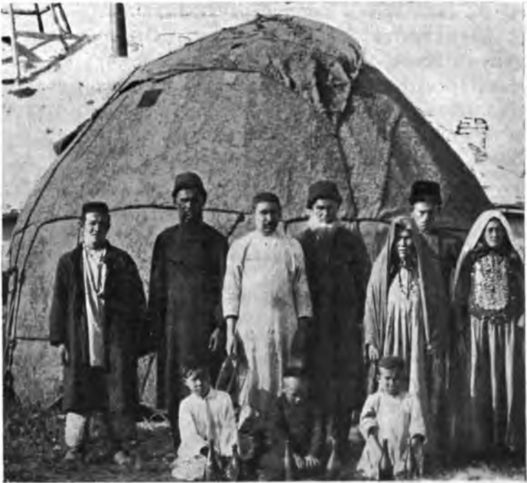
Рис. 18. Типы башкировъ и киргизовъ. Юрта.

Во имя своихъ интересовъ кумысникъ долженъ подчиняться режиму, предписанному врачомъ.