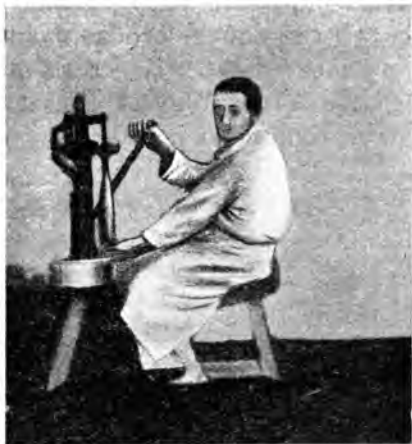
Рис. 10. Машина для закупорки бутылочъ.

пузырится. Если ввернуть сифонъ и открыть его, газъ съ шумомъ вылетаетъ струей. Налитый въ стаканъ, кумысъ пѣнится. Пѣна осѣдаетъ постепенно и, когда стаканъ опорож-