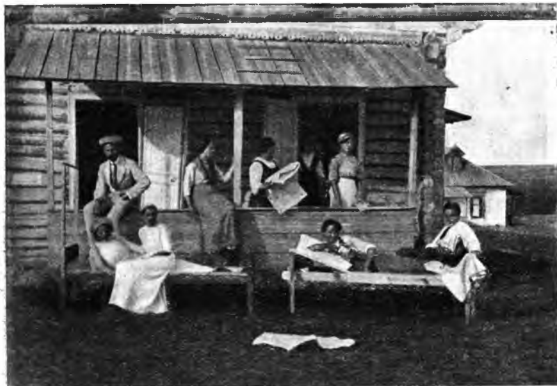
Рис. 14. Брезентовыя кровати для лежанія на воздухѣ.

Въ нѣкоторыхъ кумысолечебницахъ полагается каждому больному складное изъ парусины или брезента кресло (шэзъ-лонгъ). Очень удобны вмѣсто шэзъ-лонговъ, брезентовые или парусиновые кровати (см. рис. 14).