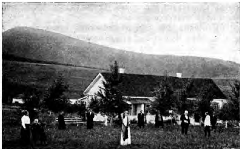
Рис. 19. На кумысѣ.

Послѣ завтрака многіе отдыхаютъ въ комнатѣ. Это не полезно. Отдыхать надо на воздухѣ, для этого пользоваться либо особыми креслами, либо парусиновыми кроватями. Къ сожалѣнію въ очень немногихъ кумысолечебницахъ имѣются эти приспособленія въ достаточномъ количествѣ. Прямо по-