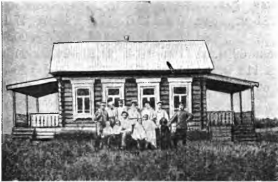
Рис. 12. Домикъ-особнякъ.

оставляет желать лучшаго. Звонковъ къ прислугѣ почти нигдѣ нѣтъ. Клозеты большей частью вблизи помѣщеній, кой гдѣ при самомъ помѣщеніи.