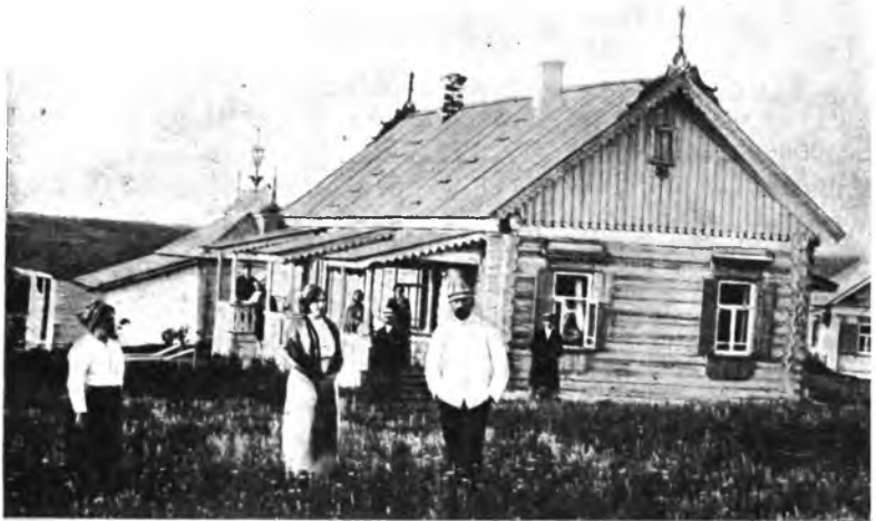
Рис. 13. Домъ съ 6 отдѣльными комнатами.

Обстановка. Кровати деревянные, желѣзныя и желѣзныя съ сѣтками. Матрацы или изъ морской травы, или