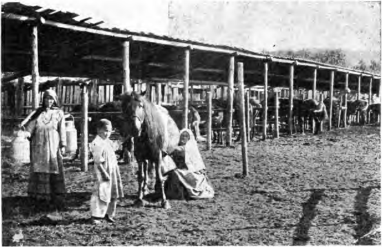
Рис. 6. Дойка кобылицъ. Переноска молока въ кумыску.

Закваской служитъ въ началѣ лѣта, когда приступаютъ къ первому выпуску кумыса, старый, прошлогодній кумысь. Изъ сохранившихся бутылокъ крѣпкаго кумыса сливають кумысь въ кадку и къ этой закваскѣ затѣмъ, когда