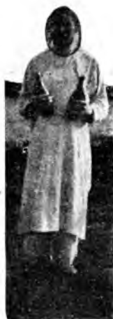
Рис. 11. Взбалтываніе кумыса. Предохранительная сѣтка на лицѣ.

ненъ отъ кумыса, на немъ остается уторчатый налетъ, точно стаканъ покрытъ инеемъ.