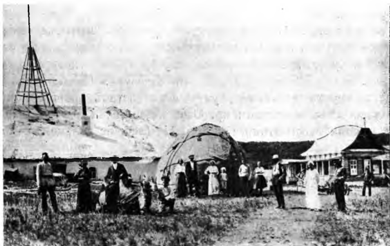
Рис. 3. На кумысѣ. Кумыска. Юрта.

То, что найдено для Бугурусланскаго уѣзда, вѣроятно, подходитъ ко всей степной полосѣ. Есть основанія думать, что степное солнечное сіяніе приближается по своему дѣйствию къ горному и морскому. Степной загаръ очень близокъ къ горному загару.