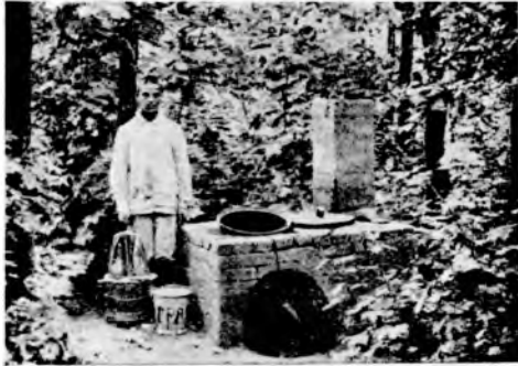
Рис. 17. Печь для сжиганія мокроты.

Для обеззараживанія мокроты и для сжиганія нечистотъ только въ двухъ-трехъ кумысолечебницахъ существуютъ спеціальныя печи (см. рис. 17).