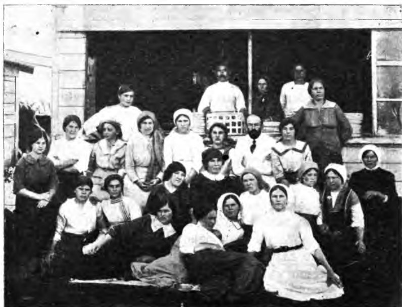
Рис. 16. Прислуга и помѣщеніе для дезинфекціи посуды. Въ плиту вдѣлано 3 котла. Въ одномъ кипящая вода съ зеленымъ мыломъ и содой, въ другомъ съ одной содой а въ третьемъ—чистая кипящая вода. Посуда кладется въ рѣшетчатую корзинку и на роликъ передвигается изъ одного котла въ другой, изъ послѣдняго котла выходитъ совершенно сухая.

Аптека. Организованныя аптеки являются рѣдкимъ исключеніемъ. Обычно имѣются при амбулаторіи наиболѣе простыя лекарства, а болѣе сложныя—получаются изъ ближайшей сельской аптеки за плату. Химико-бактеріологическія изслѣдованія за плату.