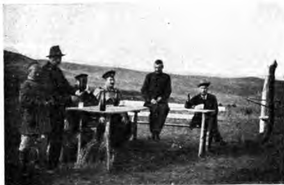
Рис. 2. На Кумысѣ. Степь.

Солнце. Солнце — второй факторъ кумысолеченія. Огромная роль его для человѣческаго организма давно известна. Существуетъ поговорка: „куда не заглядываетъ солнце, туда заглядываетъ врачъ“. Солнце проникаетъ внутрь организма, улучшаетъ составъ крови, усиливаетъ обмѣнъ веществъ и пр. Особенную роль играетъ солнце въ леченіи бугорчатки. Геліотерапія (леченіе солнцемъ) при