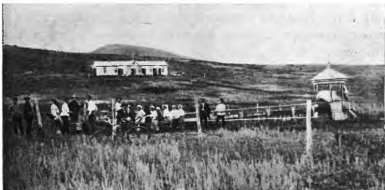
Рис. 20. Кегельбанъ.

Далеко не всѣ кумысники могутъ принимать участіе въ развлеченіяхъ. Надо поставить себѣ за правило: безъ раз-