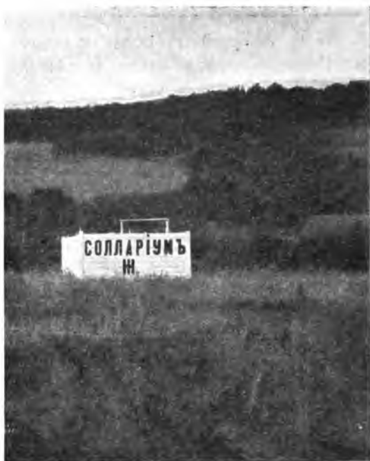
Рис. 23. Для солнечныхъ ваннь.

отдѣленіе, словомъ, усиливается обмѣнъ веществъ: отжившія частицы организма выводятся и замѣняются новыми. Последнее дѣлаетъ солнечныя ванны полезными при разныхъ болѣзняхъ, гдѣ затрудненъ обмѣнъ веществъ, или гдѣ онъ совершается неправильно: при подагрѣ, тучности, малокровіи, неврастеніи и др. Полезны солнечныя ванны при расцасыва-