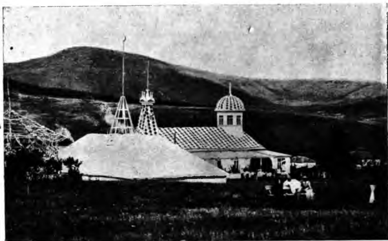
Рис. 15. Столовая (курзалъ) и „кумыска“.

Врачебная помощь. Постоянные врачи имѣются лишь въ благоустроенныхъ кумысолечебницахъ. Обычно приглашеніемъ одного врача и ограничивается хозяйнѣ ку-