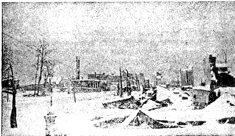
Город Истра, сожженный немецкими оккупантами. Снимок

Вскоре население из окопов выгнали. Немцы приспособивали эти окопы для своих надобностей, для стрельбы. Я укрылась в подвале, где находилось сорок человек. Было очень много маленьких детей. Немцы решили приспособить подвал для военных целей и стали выгонять нас вечером на мороз, холод. Одна мать не могла быстро вывести сразу всех своих четверых детей из подвала. Фашисты схватили двухмесячного ребенка за ноги и выбросили на снег. Мы вышли на улицу. Кругом пламя пожаров, мороз, дети зябнут, плачут. Мы не знали, куда идти. Вдруг кто-то сказал, что неподалеку есть сарай. Мы поспешили в него, но сарай от холода не защищал. Сидим, мерзнем. Приходит немец: