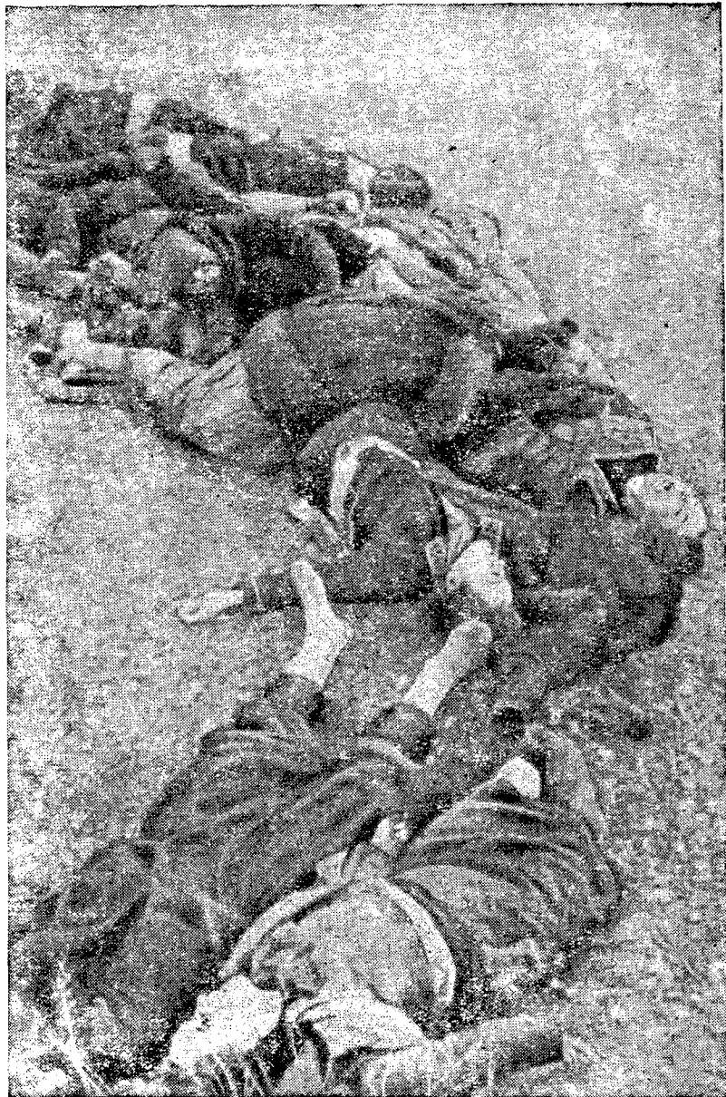
Волоколамск. Фашистские стервятники с бреющего полета расстреливали мирное население