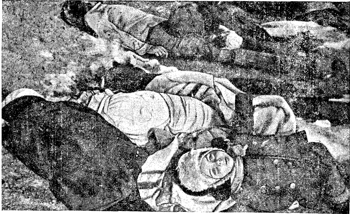
Семь тысяч мирных жителей расстреляли немецкие фашисты в Керчи. Гитлеровцы не пощадили женщин, стариков, детей