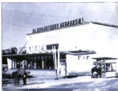
Кинотеатр «Баалтика». Здесь съемочная группа смотрела отснятый за день материал.