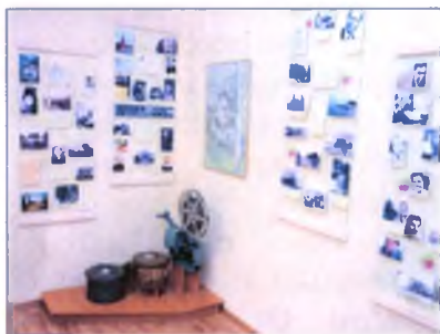
Выставка «Калина красная».

Посещение документальной выставки «Калина красная» с просмотром фильма, краткое знакомство с творчеством В.М. Шукшина.