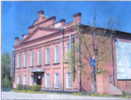
В Доме культуры состоялся первый показ фильма.