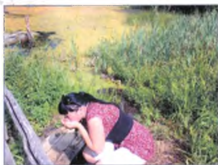
Святой источник в д. Никиткино.

построил в 2008 году в родной деревне Никиткино на свои средства и своими руками часовню, обустроил святой источник.