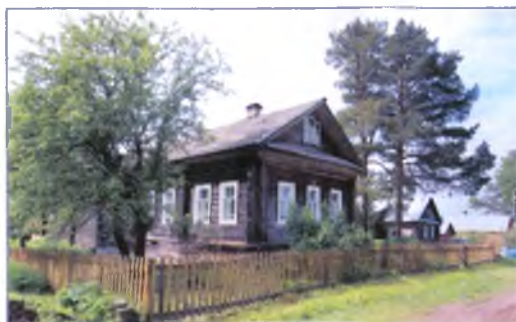
Дом, где располагается экспозиция «Стоп-кадр».