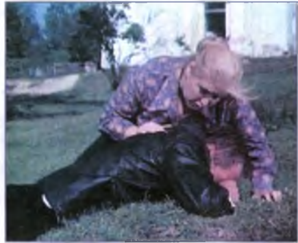
Сцена покаяния снималась у разрушенного храма в д. Садовая.

«Поруганная церковь, без креста, - фоном будет объяснять не только Егора Прокудина, а нацию – собирательно».