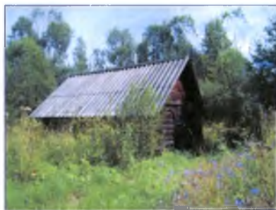
Банька на берегу Мериновского озера.

Выезд в д. Садовая: прогулка к «дому Любы Байкаловой», к «дому матери Егора Прокудина, бабушки Куделихи», к баньке и на озеро Мериновское.