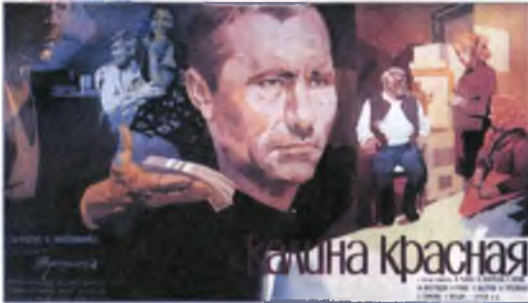
Афиша фильма «Калина красная».

Выйдя из тюрьмы, Егор Прокудин, по кличке Горе, решает податься в деревню, где живет синеглазая незнакомка Люба, с которой он переписывался — ведь надо немного переждать и осмотреться.