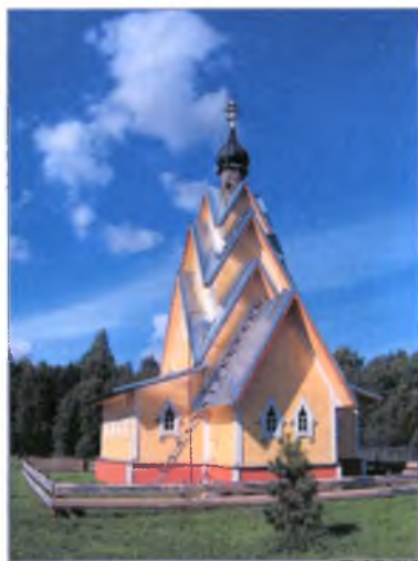
Часовня в д. Никиткино. XXI в.