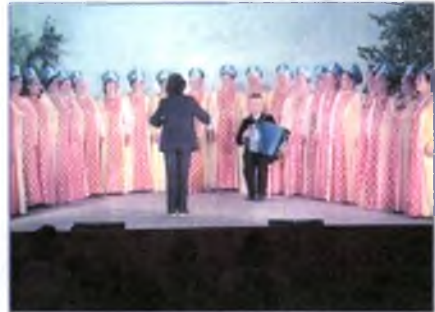
Хор Дома культуры.