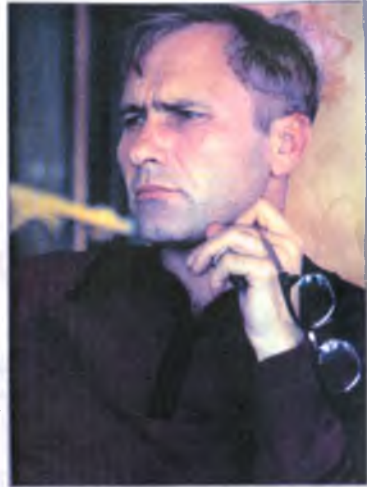
Василий Макарович Шукшин.

Василий Макарович Шукшин (1929-1974). Лауреат Ленинской и Государственной премий СССР, заслуженный деятель искусства РСФСР. Рано лишившись отца, В. Шукшин работал с двенадцати лет в колхозе на Алтае (военные и первые послевоенные годы), затем на заводе во Владимире, был разнорабочим, слесарем... С 1954 году поступил во ВГИК на режиссерский факультет. К этому времени В.Шукшин был уже вполне сложившимся двадцатипятилетним человеком, много повидавшим, закалённым в жизненных испытаниях и житейских невзгодах.