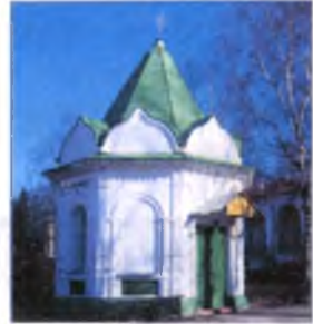
Часовня Кирилла Новозерского.