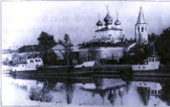
Набережная, по которой главный герой убегал от милиционеров.