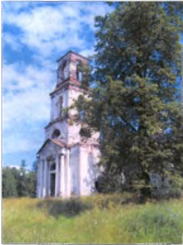
Церковь Рождества Богородицы. XVIII в.