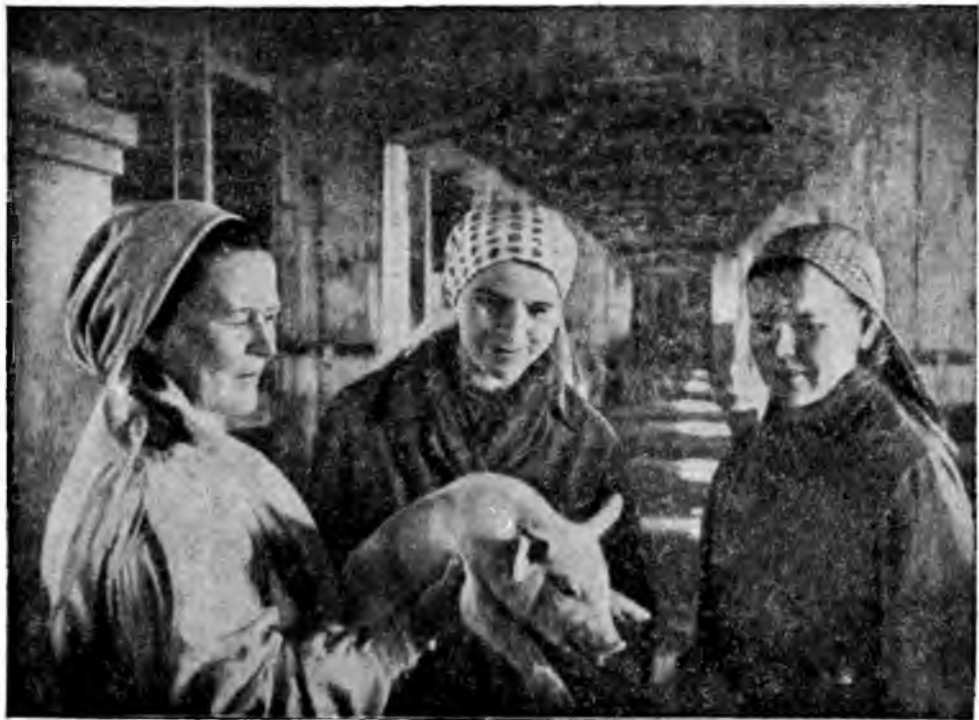
Этот малыш требует особого внимания.