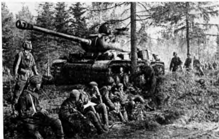
Своей особой жизнью живет фронтовая дорога. Весна 1945 года. Берлинское направление