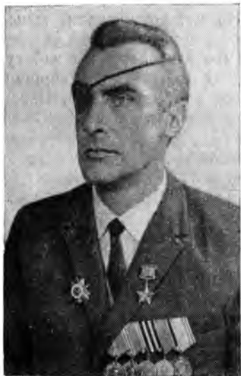
Михаил Ильич Климов. 1970 г.