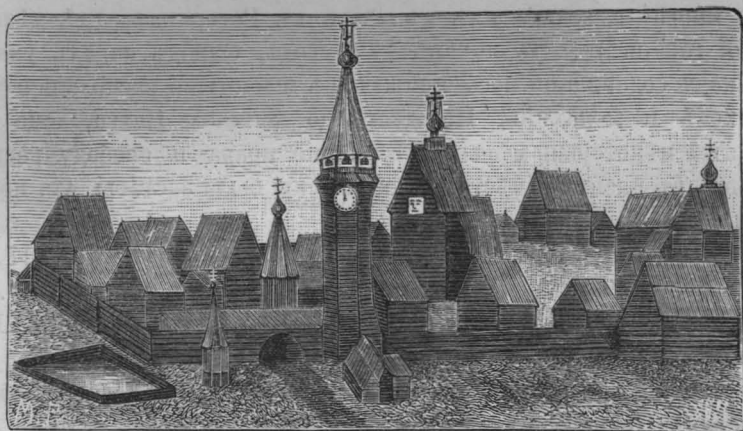
Старообрядческая Выгорѣцкая пустынь въ XVIII столѣтіи.

Мы помнимъ, что Василій Васильевичъ Голицынъ былъ покровителемъ іезуитовъ. Петръ, напротивъ, неразъ выражался довольно рѣзко о іезуитскомъ орденѣ. Въ 1719 году, 18-го апрѣля, маіоръ