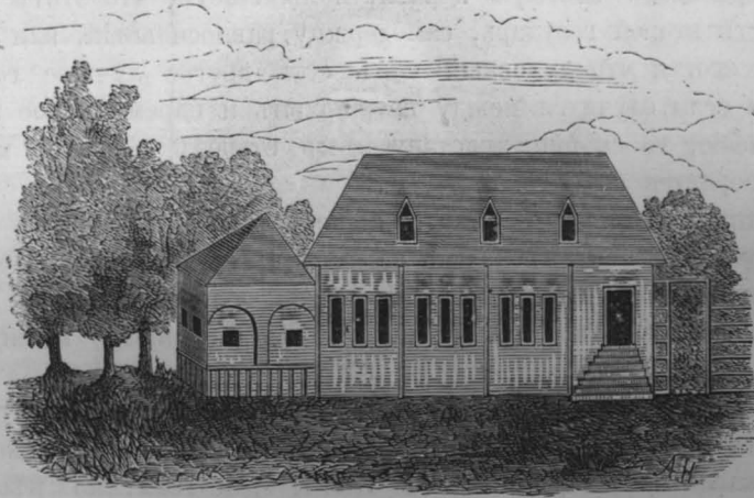
Подворье Стефана Яворскаго въ Петербургѣ. Съ рисунка, приложеннаго къ „Описанію Петербурга“ Рубана.

Въ преувеличенной обрядности, схоластическихъ мелочахъ и догматическихъ тонкостяхъ, Петръ видѣлъ опасность лицемѣрія и ханжества. Будучи непримиримымъ врагомъ внѣшняго благочестія и фарисейства, замѣчая въ народѣ сильное развитіе этого порока, Петръ мечталъ о средствахъ искоренить это зло. Его занимала мысль составить такую книгу, въ которой съ обличеніемъ лицемѣрія предлагалось бы наставленіе о правильномъ благочестіи. При составленіи программы такого сочиненія, Петръ удивился тому, что между десятью заповѣдями нѣтъ заповѣди, запрещающей лицемѣріе, и старался въ довольно подробномъ изложеніи доказать, что лицемѣріе содержитъ въ себѣ грѣхи противъ всѣхъ заповѣдей.