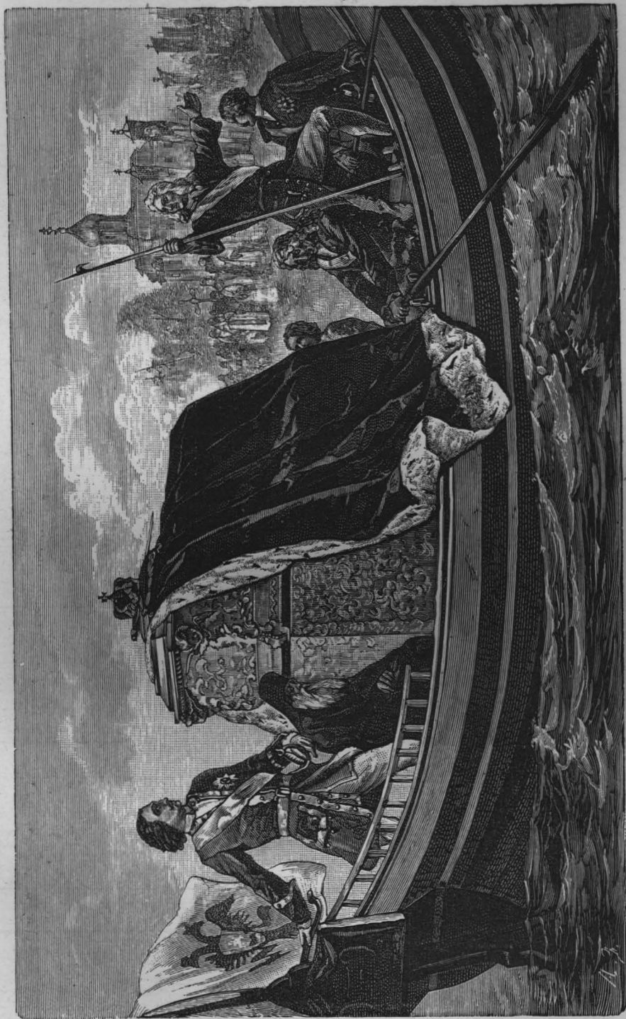
Перенесеніе Петромъ I мощей св. Александра Невскаго въ Петербургъ, въ 1723 году. Съ картины профессора Баснина, находящейся въ Исаакіевскомъ соборѣ. Гравюра Зубчаннова въ С.П.Б.