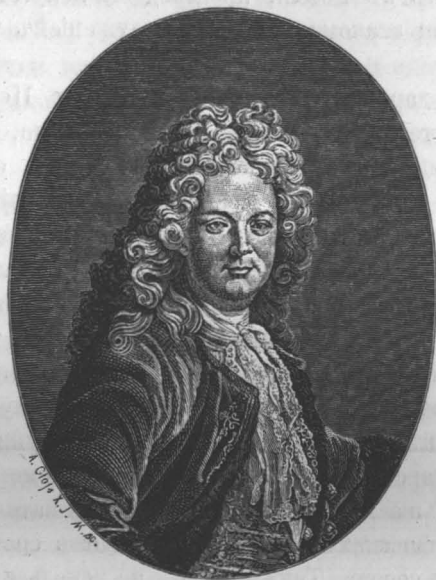
Андрей Артамоновичъ Матвеевъ.

Нѣтъ сомнѣнія, что нѣкоторые изъ русскихъ, путешествовавшихъ за границу, имѣли полную возможность составить себѣ точное понятіе о выгодахъ и преимуществахъ западно-европейской цивилизаціи, о необходимости подражать во многомъ иностранцамъ. Такъ, напр., Шереметевъ, Курбатовъ, Татищевъ, Толстой своимъ многостороннимъ образованіемъ, развитіемъ своихъ политическихъ способностей, были главнымъ образомъ обязаны пребыванію за гра-