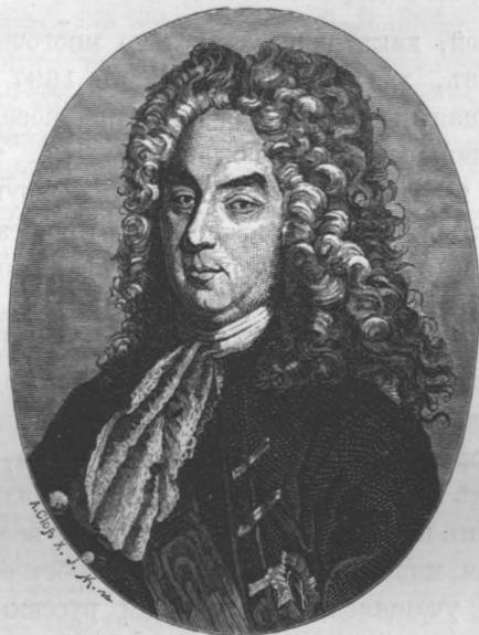
Петръ Андреевичъ Толстой.

Не легко разставались молодые русскіе аристократы съ родиною. Едва ли кто изъ нихъ зналъ какойнибудь иностранный