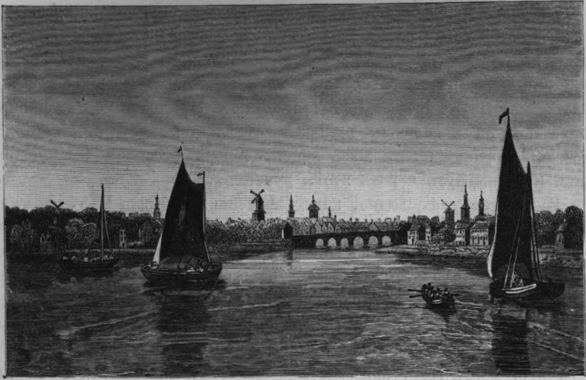
Видъ Амстердама въ началѣ XVIII столѣтія.

сти драматическаго искусства, музыки, литературы, дѣлалось замѣтнымъ польское вліяніе. Первые приверженцы западно-европейской цивилизаціи — Ордынъ-Нащокинъ, Ртищевъ, А. С. Матвѣевъ, кн. В. В. Голицынъ — весьма многимъ были обязаны польскому вліянію. И первые государи царствующаго дома Романовыхъ находились подъ вліяніемъ польской культуры. Отецъ Михаила Ѳеодоровича, Филаретъ, нѣсколько лѣтъ прожилъ въ Польшѣ; Алексѣй Михайловичъ принималъ личное участіе въ войнахъ съ Польшею въ то