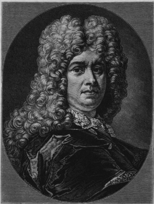
Амстердамскій бургомистръ Витзень.

До XVI вѣка на Западѣ почти ничего не знали о Россіи. Затѣмъ трудъ Герберштейна нѣкоторое время оставался главнымъ,