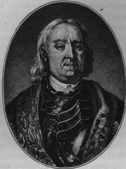
Графъ Федоръ Матвеевичъ Апраксинъ.