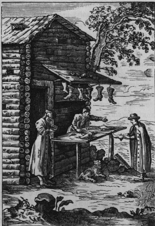
Московская торговая лавка въ XVII столѣтіи.

и ратнаго искусства въ особенности, стояла выше Россіи; къ тому же Польша, черезъ свои сношенія съ Римомъ и іезуитскимъ орденомъ на востокѣ, въ отношеніи къ Россіи занимала такое же мѣсто, какое на крайнемъ западѣ Европы занимала Испанія въ