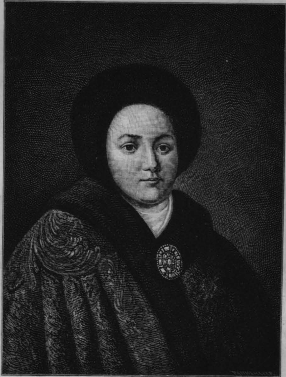
Царица Евдокія Θεодоровна.

Какъ бы то ни было, но съ перваго мгновенія появленія славянъ на исторической сценѣ въ Россіи замѣтно болѣе или менѣе важное вліяніе на нихъ иностранныхъ, иноплеменныхъ элементовъ. Съ одной стороны, славяне смѣшиваются съ представителями Востока, съ находившимися въ близкомъ сосѣдствѣ степными варва-