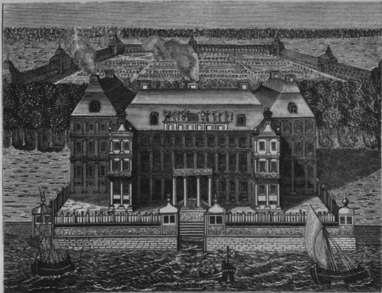
Домъ князя Меншикова въ Петербургѣ.