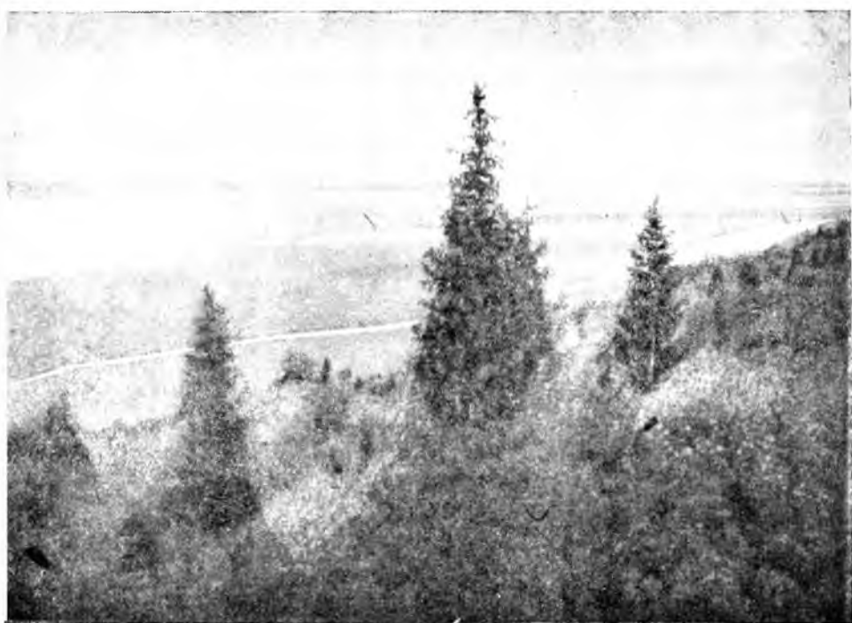
ЛЕСИСТЫЙ БЕРЕГ ПЕЧОРЫ