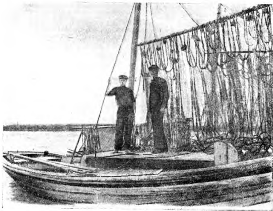
ПЕРЕД ВЫХОДОМ НА ЛОВ РЫБЫ НА ОЗЕРО ИЛЬМЕНЬ