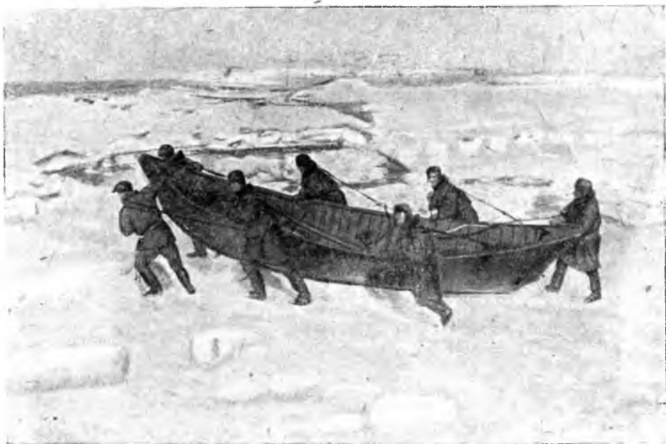
ЗВЕРОБОИ ВО ЛЬДАХ БЕЛОГО МОРЯ ТАЩАТ ЛОДКУ К РАЗВОДЬЮ