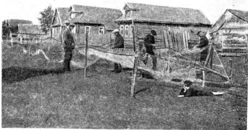
ИЛЬМЕНСКИЕ РЫБАКИ ЗА САДКОЙ СЕТЕЙ