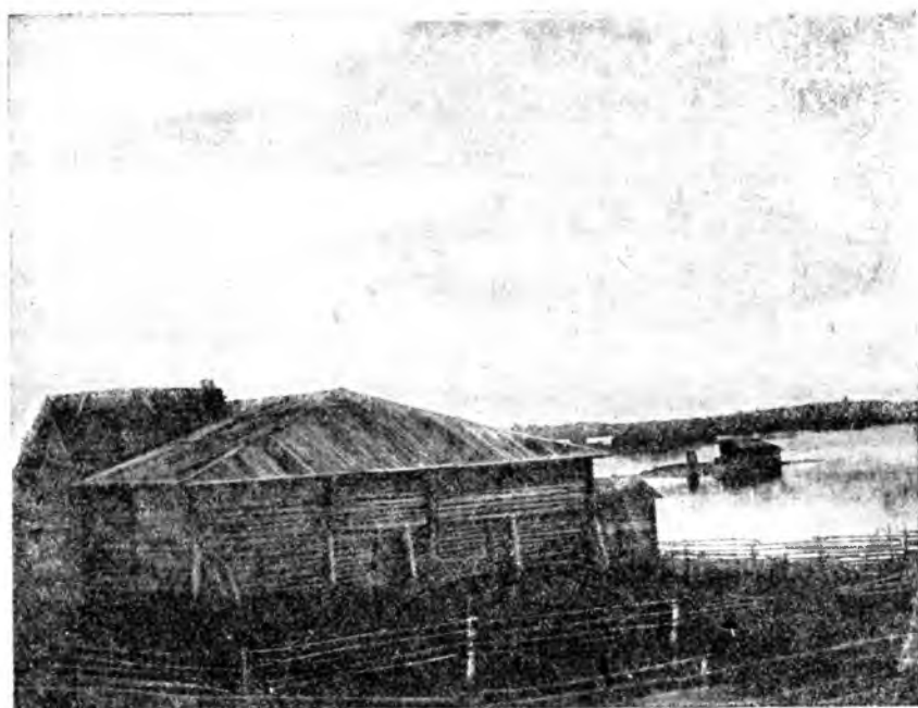
БЕРЕГ ОЗЕРА ОНЕГО