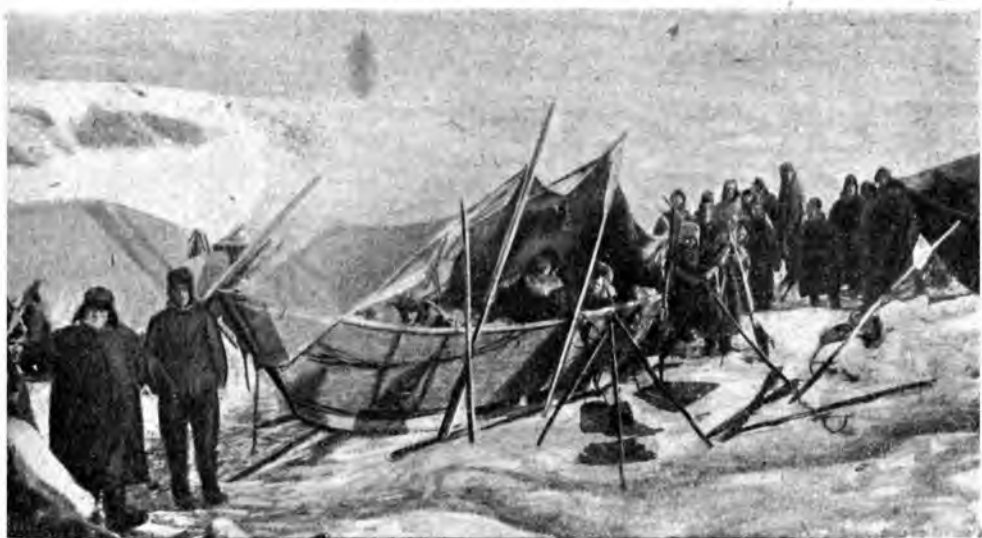
ТО ЖЕ, ВБЛИЗИ