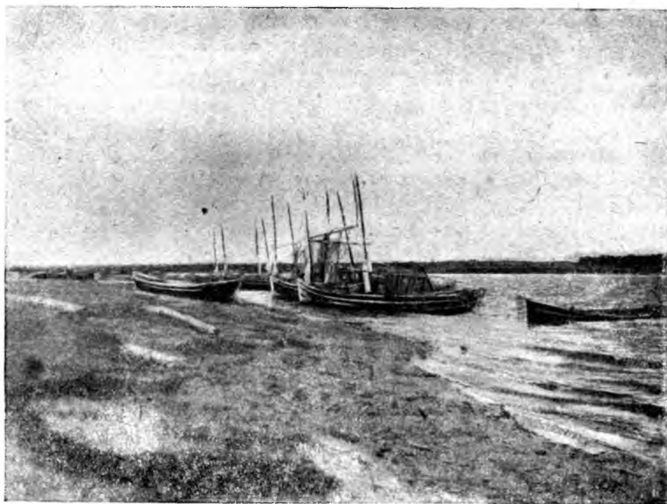
УСТЬЕ РЕКИ ЛОВАТИ, ВПАДАЮЩЕЙ В ОЗЕРО ИЛЬМЕНЬ