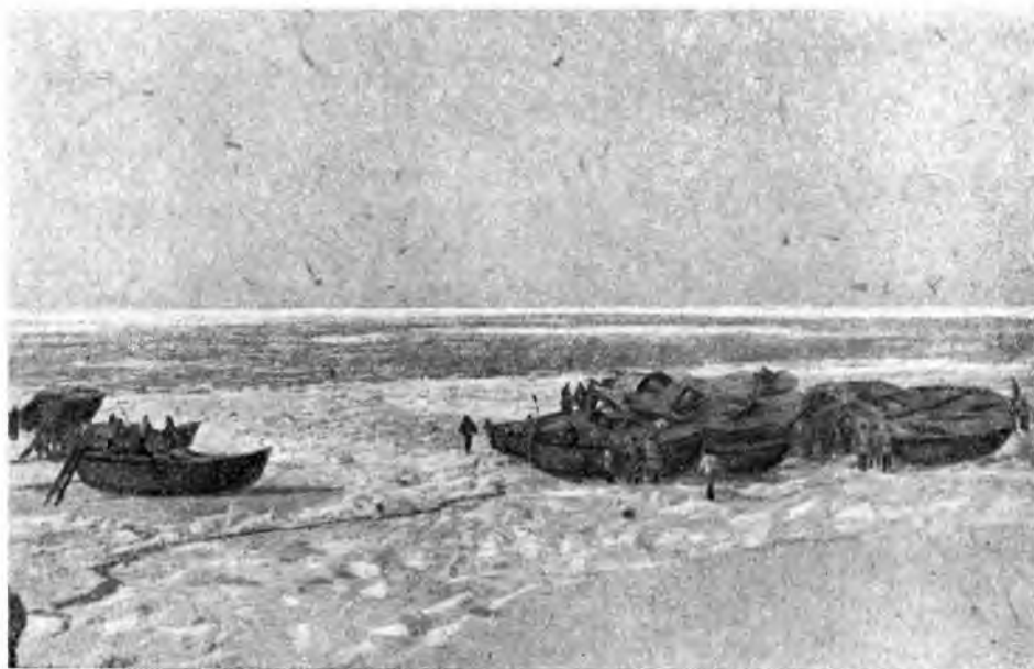
БУРСА_ЗВЕРОБОВЕВ ВО ЛЬДАХ БЕЛОГО МОРЯ