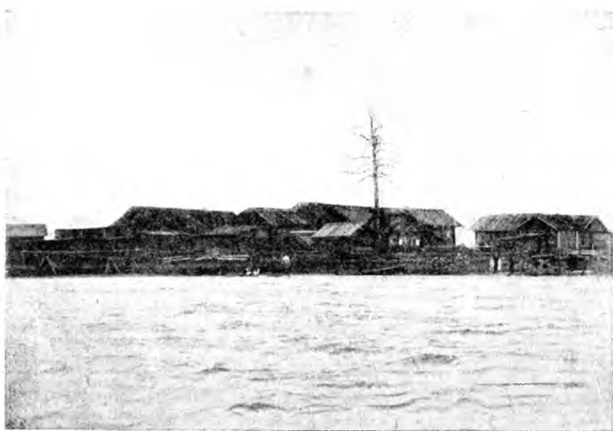
ОСТРОВ ПОРОМСКИЙ НА КЕНОЗЕРЕ