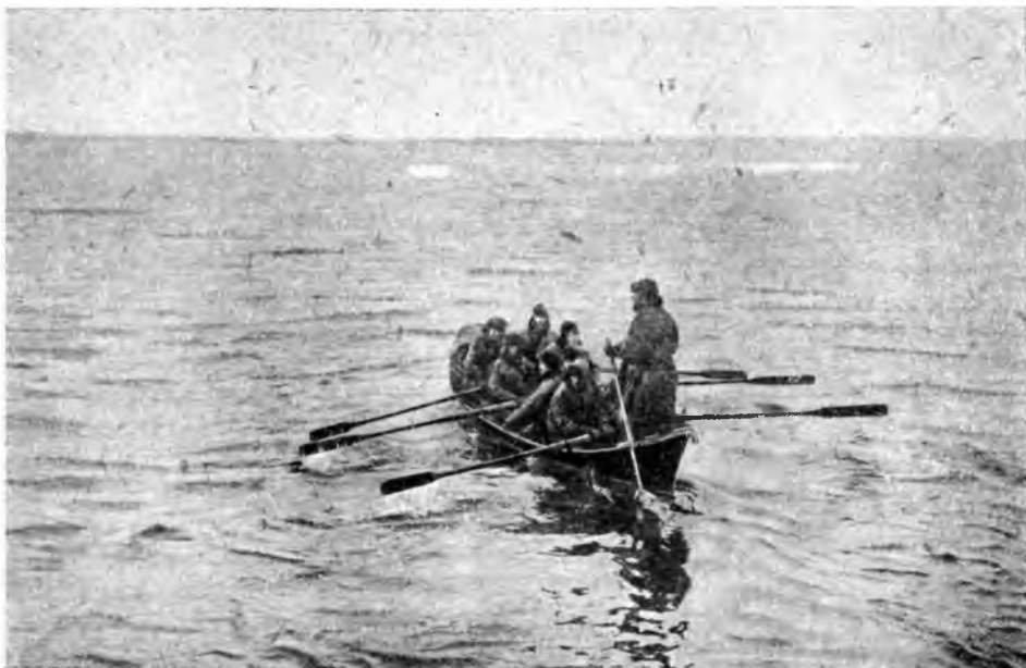
БЕЛОЕ МОРЕ. ЗВЕРОБОИ НА ЛОДКЕ-СЕМЕРИКЕ