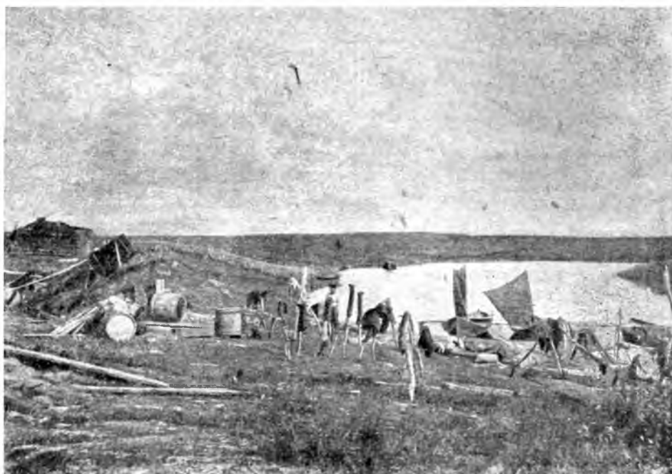
РЫБАЦКАЯ СТОЯНКА СТАРОГО ТИПА НА ПЕЧОРЕ