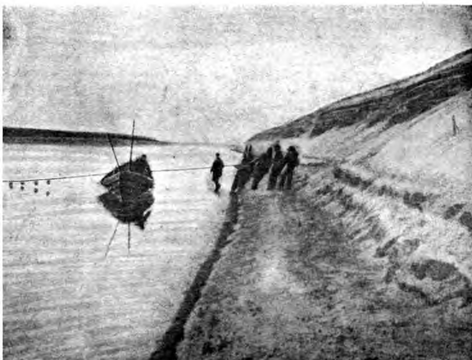
ТРАДИЦИОННОЕ ПЕРЕНЕСЕНИЕ ЛОДКИ НА БЕРЕГ НА ПЕЧОРЕ