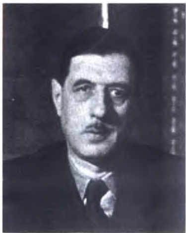
Ш. де Голль