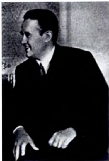
А. Гарри ман