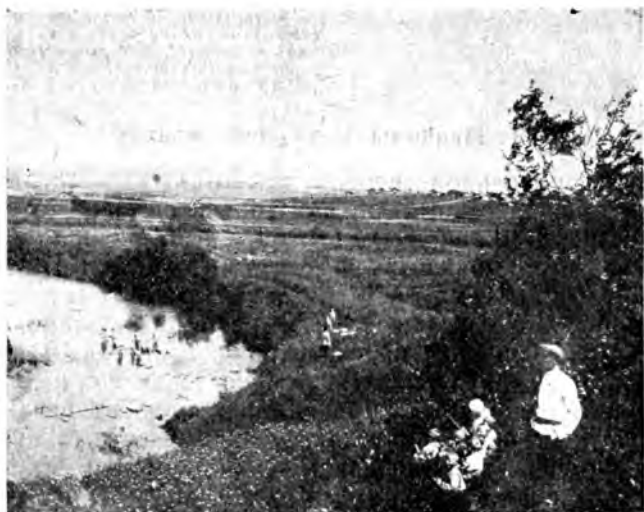
Общий вид Тигина; на переднем плане р. Вожега и заливные луга