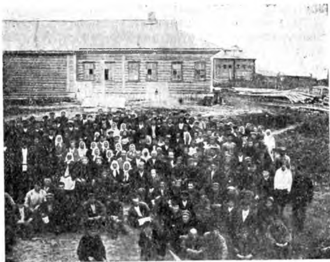
Собрание Тигинского актива

хотя партвызысканиям трое подверглись (за выпивку). В ячейке шла дискуссия по поводу классовой борьбы в колхозах. Теперь этот вопрос решен в том смысле, что фактом вступления в колхоз еще не уничтожается классовая борьба, она будет продолжаться до полного безвозвратного поражения кулацкого хозяйства и кулацкой идеологии. Решен