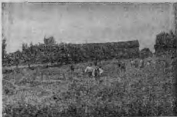
Члены „Землед. Кооператива“ за работой.

А вотъ и секретари. Ихъ два. Оба они—изъ мѣстныхъ крестьянъ. Оба съ юныхъ лѣтъ работали, какъ рядовые поденщики. И лишь—лѣтъ пять тому назадъ взялись за кооперативное счетоводство. Старшій изъ нихъ получаетъ 800 лиръ въ годъ.