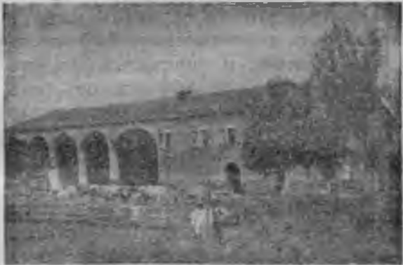
„Земледѣльческій Кооперативъ“ въ с. Фабрико.

сразу же принялъ форму „открытой“ организаціи и предоставилъ свободный доступъ всякому, желающему приложить свои силы въ коллективномъ земледѣльческомъ трудѣ.