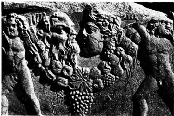
Маски Диониса и Силена. Фрагмент стенки саркофага. Мрамор. II в.

жей часто встречаются среди терракот и мраморной скульптуры. Выразительна, например, голова юного Геракла, покрытая львиной шкурой.