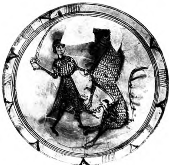
Блюдо с изображением Героя и зверя. Глина, полива. XIII—XIV вв.

верхнего слоя дают довольно полную картину тогдашней городской жизни. В домах встречаются земледельческие орудия—железные сошники и мотыги, жернова и ступы для размола зерна, рыболовные принадлежности, бронзовые крючки, грузила, глиняные и свинцовые, для сетей и железные остроги, инструменты по обработке камня и дерева: кирки, зубатки, сверла, тесла, долота, топоры и др., иголки и наперстки для шитья, веретена и пряслица для прядения и многое другое. Было развито гончарное ремесло: открыты обжигательные печи и найдено огромное количество разнообразной по форме и технике производства посуды, в частности, поливной, местного изготовления.