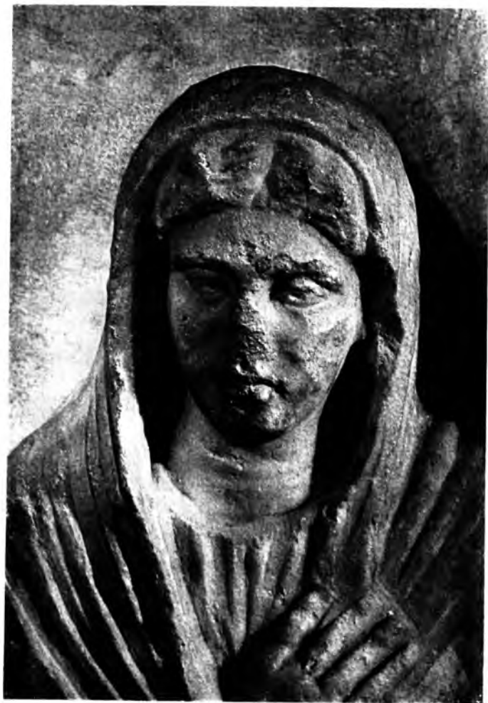
Ульпия-Макария. Деталь надгробной стелы. Мрамор. II в.