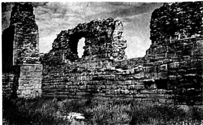
Крепостная стена и башня.

судить об общественном и государственном устройстве города, о проявлениях классовой борьбы, о политических взаимоотношениях с другими государствами, о торговых и культурных связях, о религиозных верованиях.