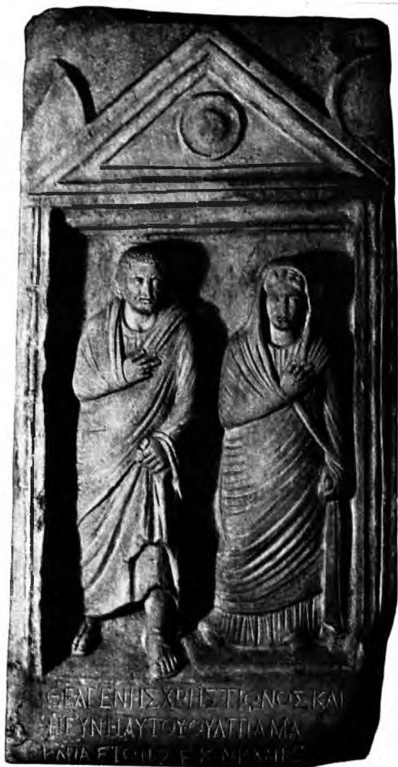
Надгробная стела Феагена и Ульпии-Макарии. Мрамор. II в.