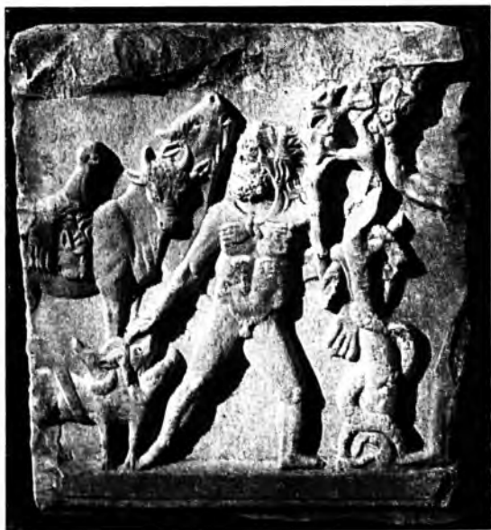
Подвиги Геракла. Стенка саркофага. Мрамор. Конец II в.