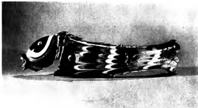
Флакон в виде рыбы. Цветное стекло. I в.

встречаются на дне этих цистерн. Возле них обычно находятся кладовые с пифосами — большими глиняными сосудами, в которых хранилась соленая рыба, вынутая из цистерн. О масштабах же отдельных хозяйств говорят раскопанные в последние годы цистерны объемом в 70—90 кубических метров, а также кладовая с девятнадцатью огромными пифосами.