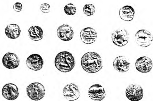
Монеты Херсонеса. Золото, медь, серебро. IV в. до н. э. — III в. н. э.

рая перечисляет владения Херсонеса, на первом месте стоят Керкинитида и Прекрасная Гавань. Первая из них находилась на месте нынешней Евпатории, вторая отождествляется с поселком Черноморское, расположенным в восьмидесяти километрах к северо-западу от Евпатории. Именно из степи жители Херсонеса получали основную массу хлеба для собственных нужд и для вывоза в Грецию.