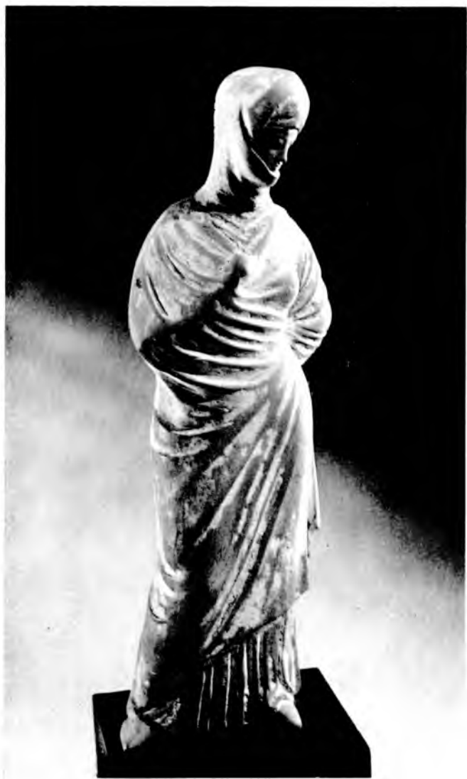
Женская статуэтка. Терракота. III в. до н. э.