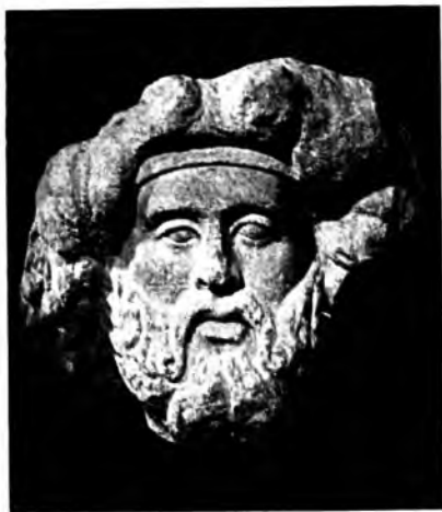
Голова Диониса. Мрамор. IV в. до н. э.