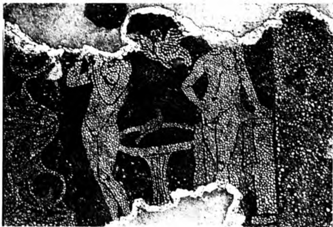
Сцена омовения. Мозаика. II в. до н. э.

ков. Характерны для херсонесских находок изображения Деметры и Танатоса (генія смерти).