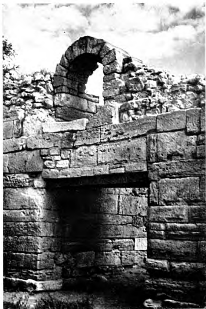
Городские ворота. V—IV вв. до н. э. Вверху калитка первых веков н. э.