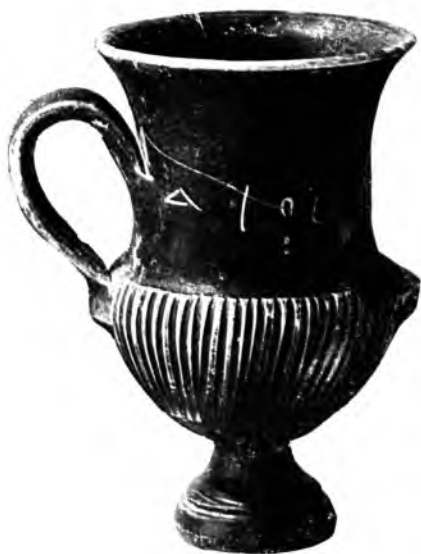
Канфар чернолаковый из дома Аполлония с надписью „Славное вино“. Глина. III—II вв. до н. э.

и виноделием — на Гераклейском полуострове. Развита были морские промыслы: рыболовство и тесно связанное с ним добывание соли в озерах на Херсонесском мысу; добывались также устрицы и мидии, раковины которых обильно насыщают культурный слой городища.