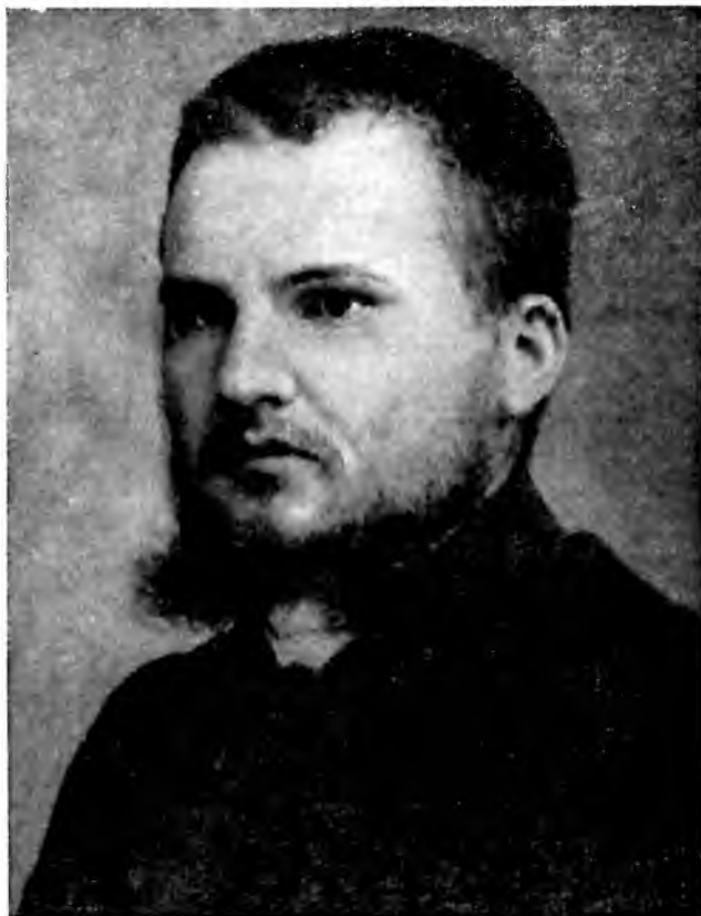
Рис. 2. А. А. Ухтомский — студент Петербургского университета.