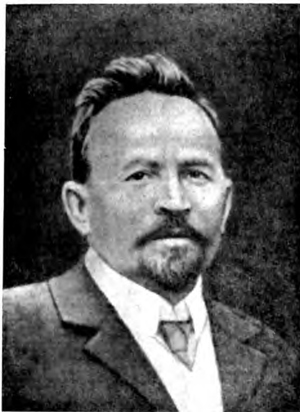
Рис. 1. Н. Е. Введенский (1852--1922).