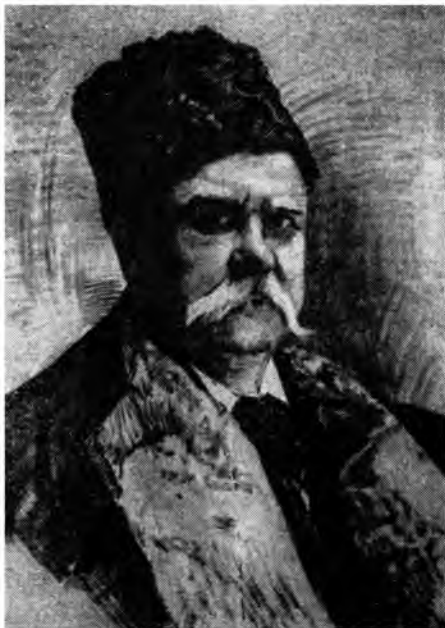
В. А. ГИЛЯРОВСКИЙ