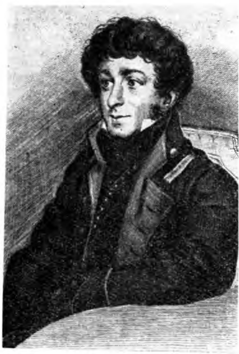
К. Н. БАТЮШКОВ