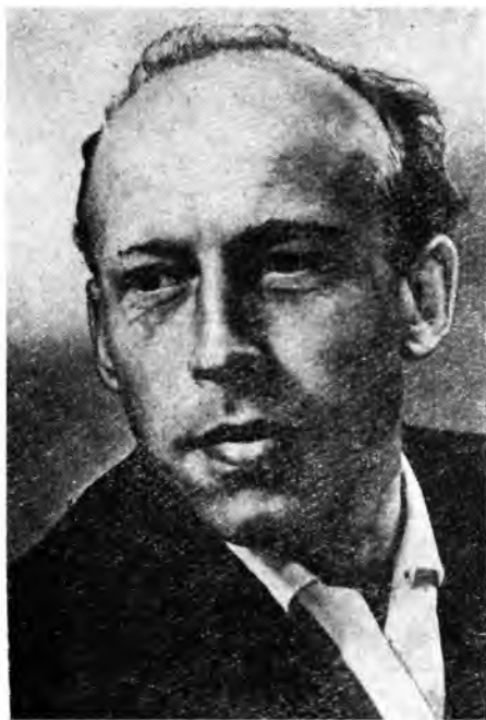
В. Ф. ТЕНДРЯКОВ.