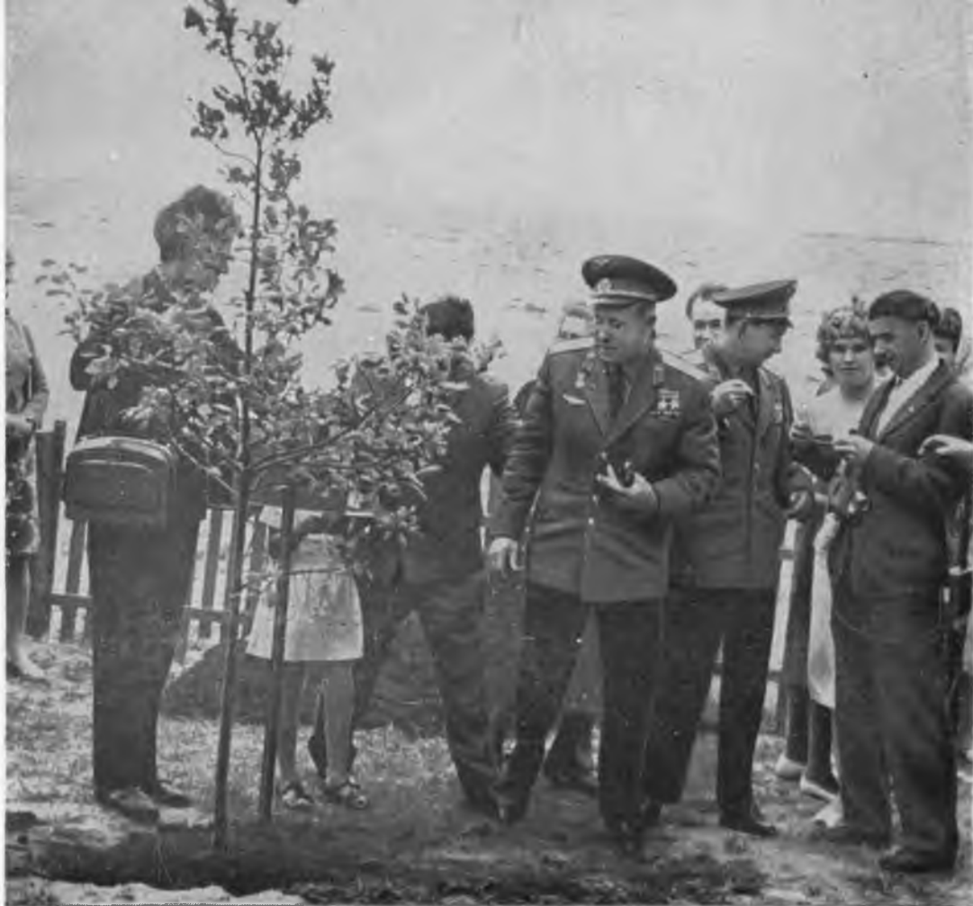
В парке базы отдыха металлургов, в местечке Торово, П. И. Беляев и А. А. Леонов посадили на память о своем пребывании в Череповце по дубку и ясеню.