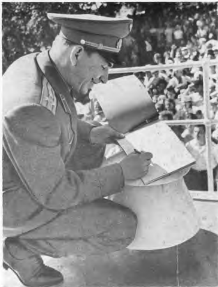
Ребята протягивают П. И. Беляеву альбом и просят что-нибудь написать. Ну, разве откажешь в такой просьбе!