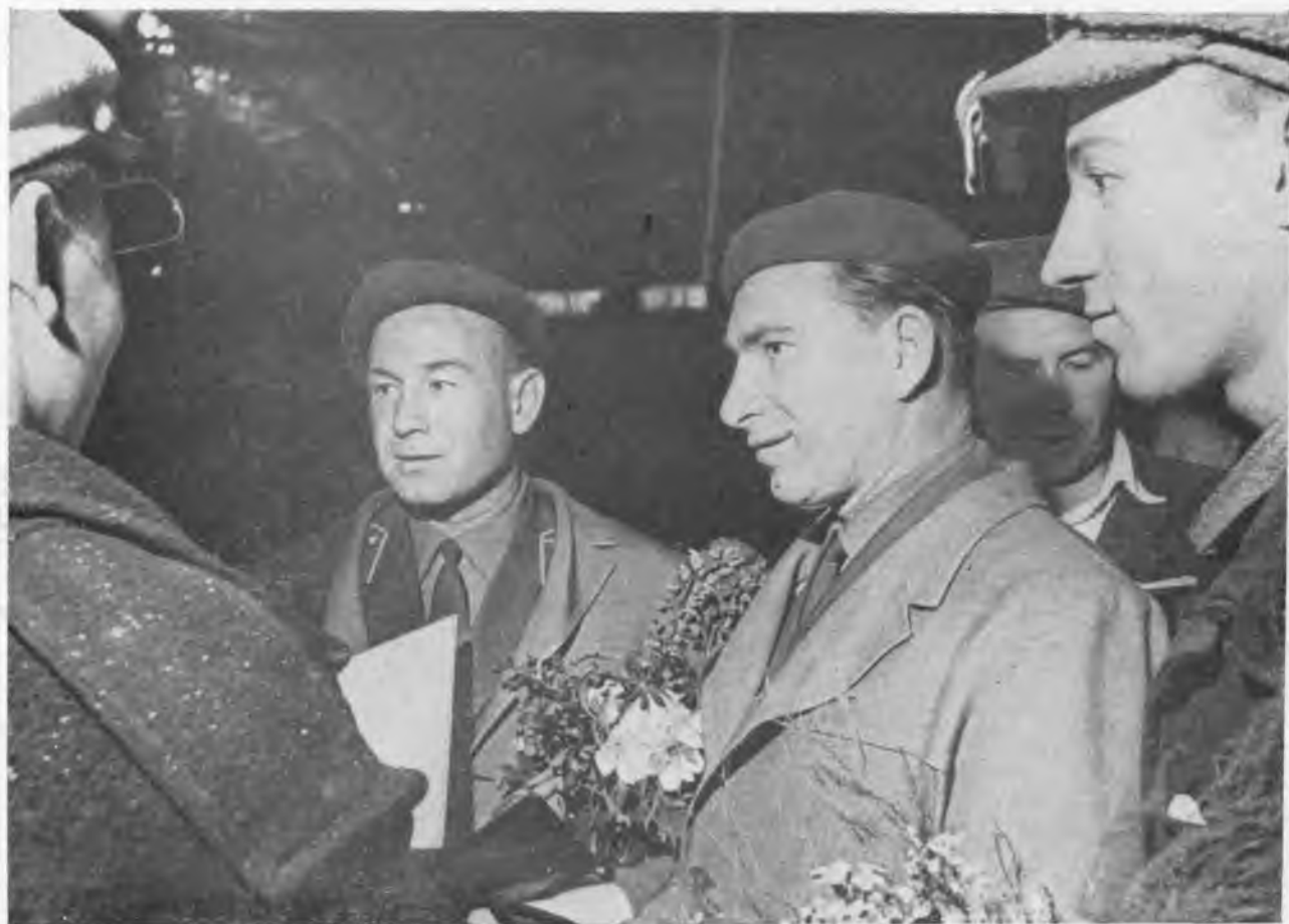
П. И. Беляев и А. А. Леонов беседуют с металлургами.