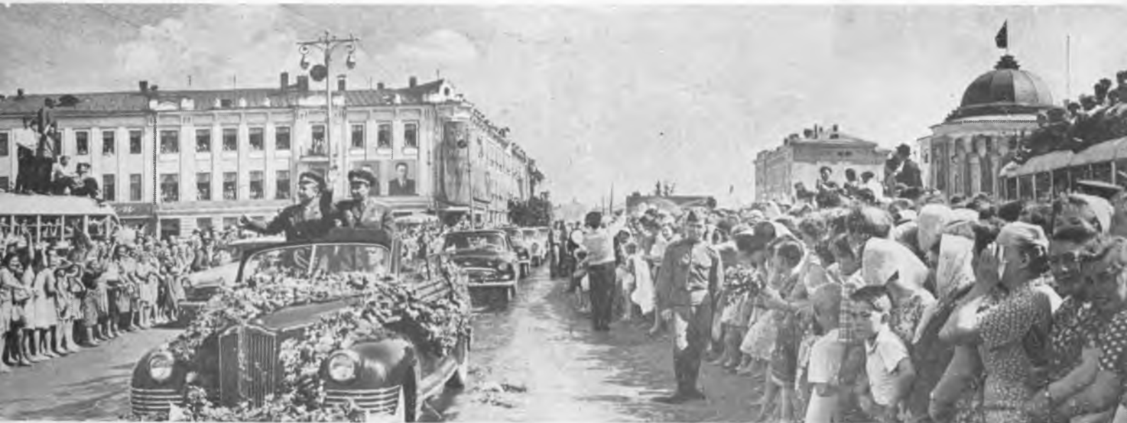
Торжественный кортеж движется по улицам Вологды. Навстречу машине катится вал людского восторга...