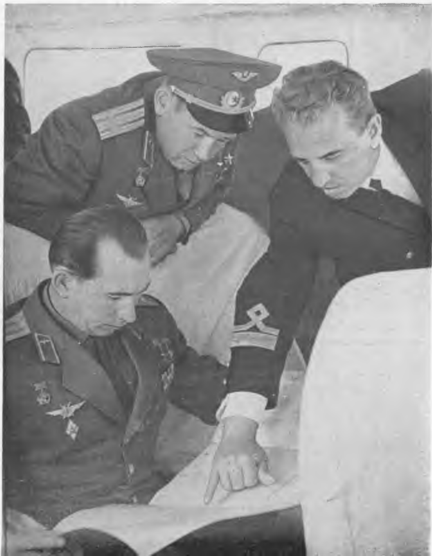
Космонавты знакомятся с трассой Волго-Балта.