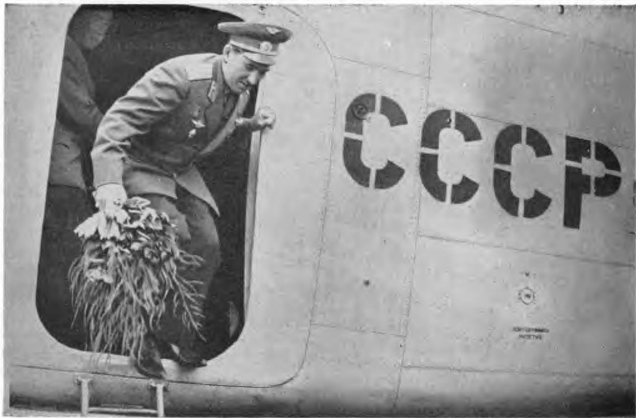
Замерла крылатая машина на зеленом поле, и все, конечно, узнают выходящих из самолета героев космоса П. И. Беляева и А. А. Леонова.