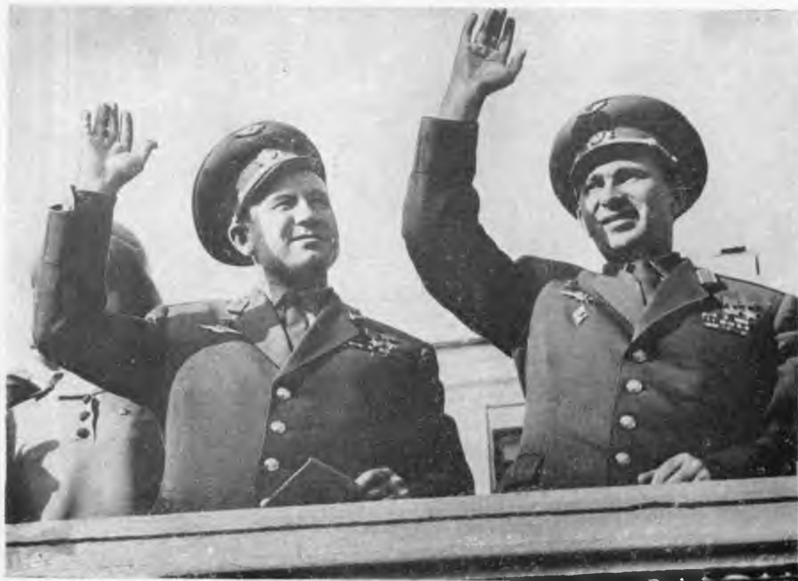
П. И. Беляев и А. А. Леонов приветствуют вологжан на митинге трудящихся города.