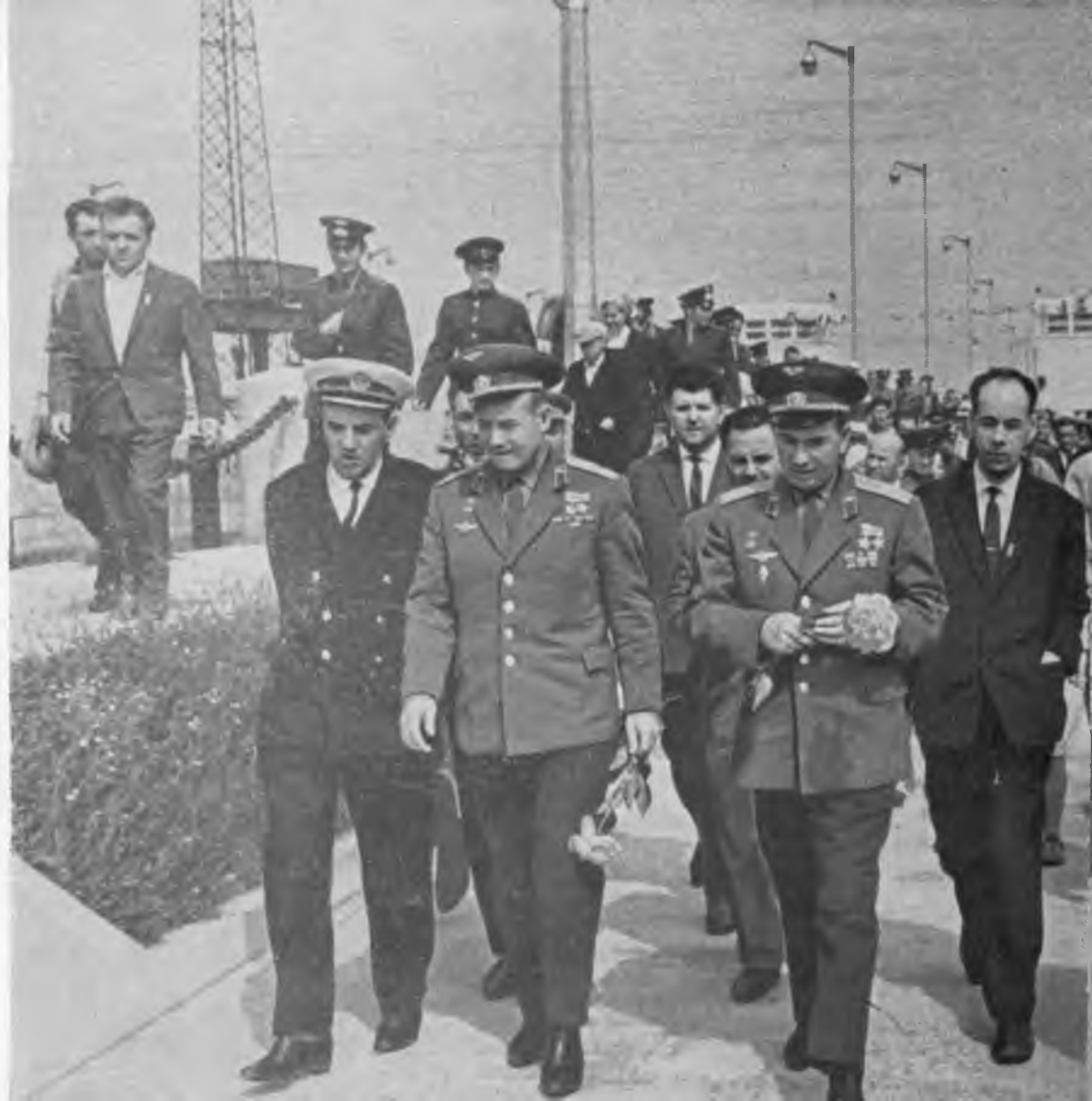
Космонавты П. И. Беляев и А. А. Леонов осматри- вают сооружения Череповецкого гидроузла.