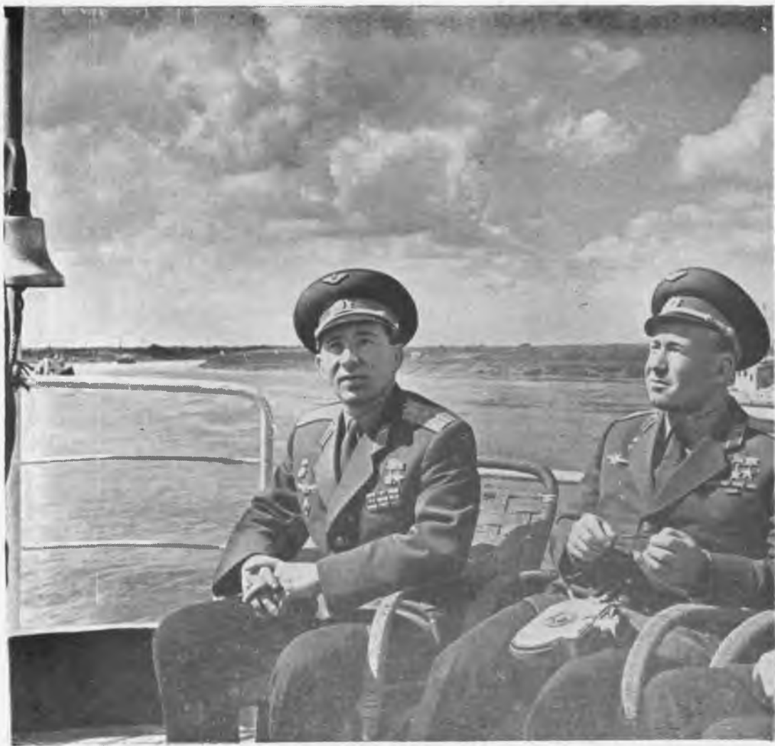
П. И. Беляеву и А. А. Леонову очень нравятся здесьние места...