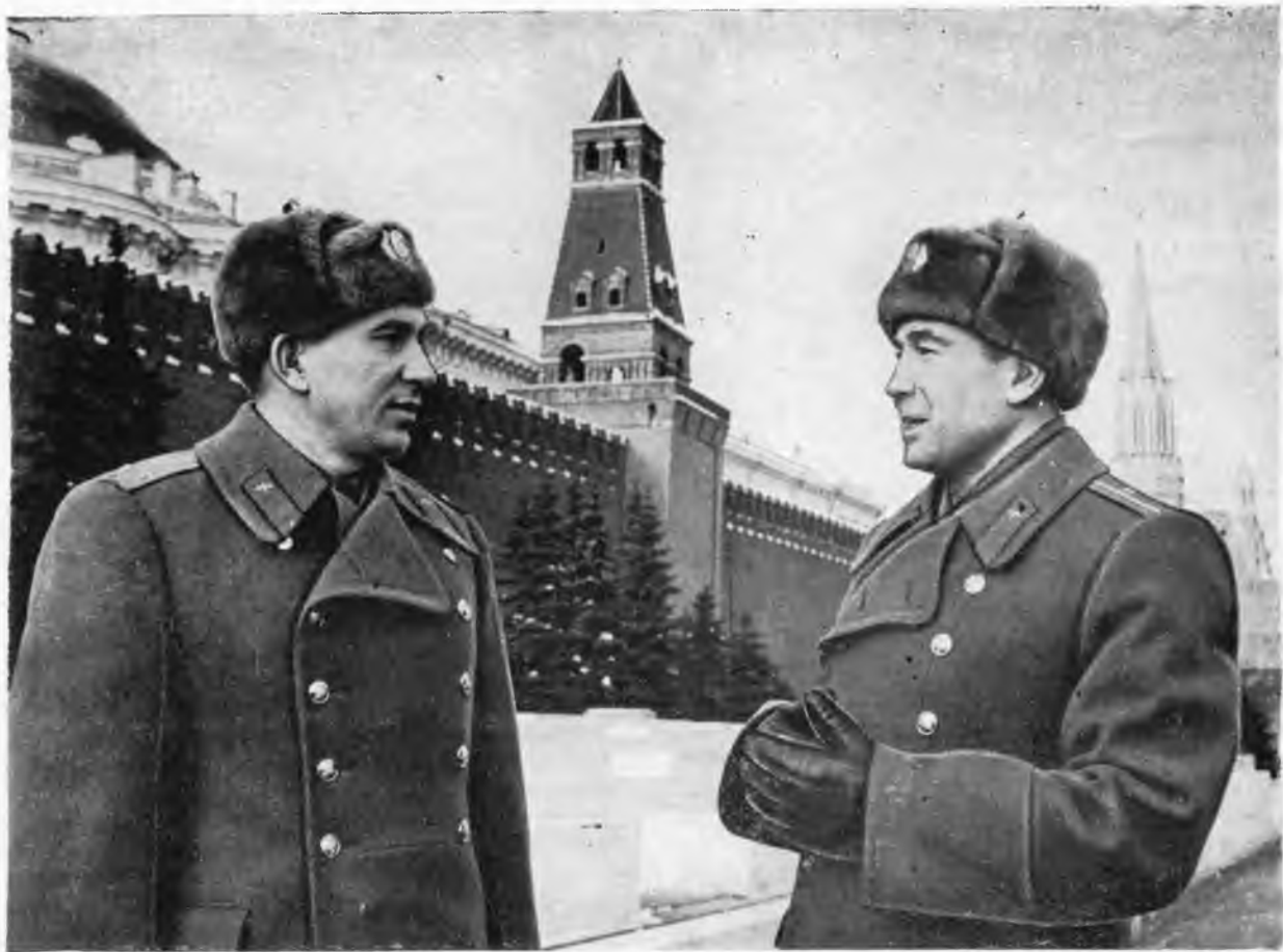
П. И. Беляев и А. А. Леонов на Красной площади перед полетом в космос.