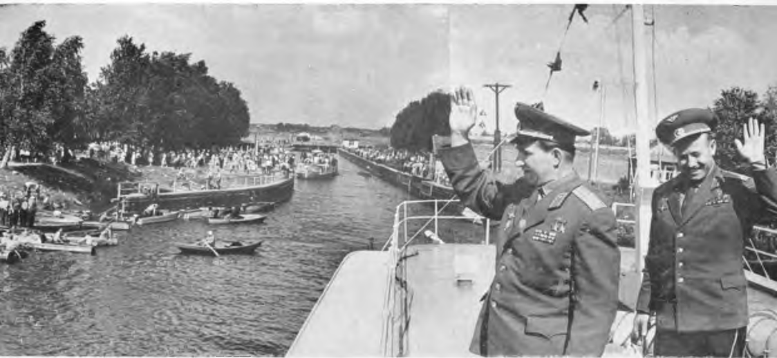
Белоснежный теплоход «Союз» медленно входит в распахнутые ворота шлюза «Знаменитый». На берегах — сотни по-праздничному одетых людей.