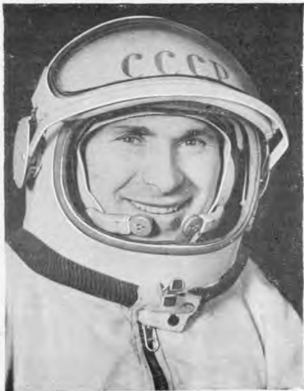
Летчик-космонавт СССР П. И. БЕЛЯЕВ