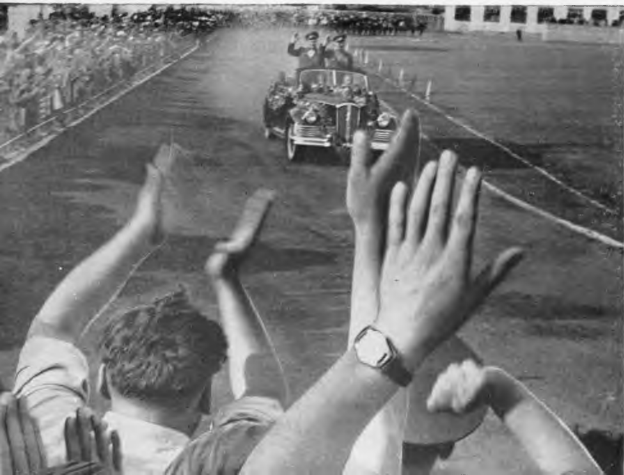
Почетные граждане Вологды П. И. Беляев и А. А. Леонов совершают круг почета на стадионе «Динамо».