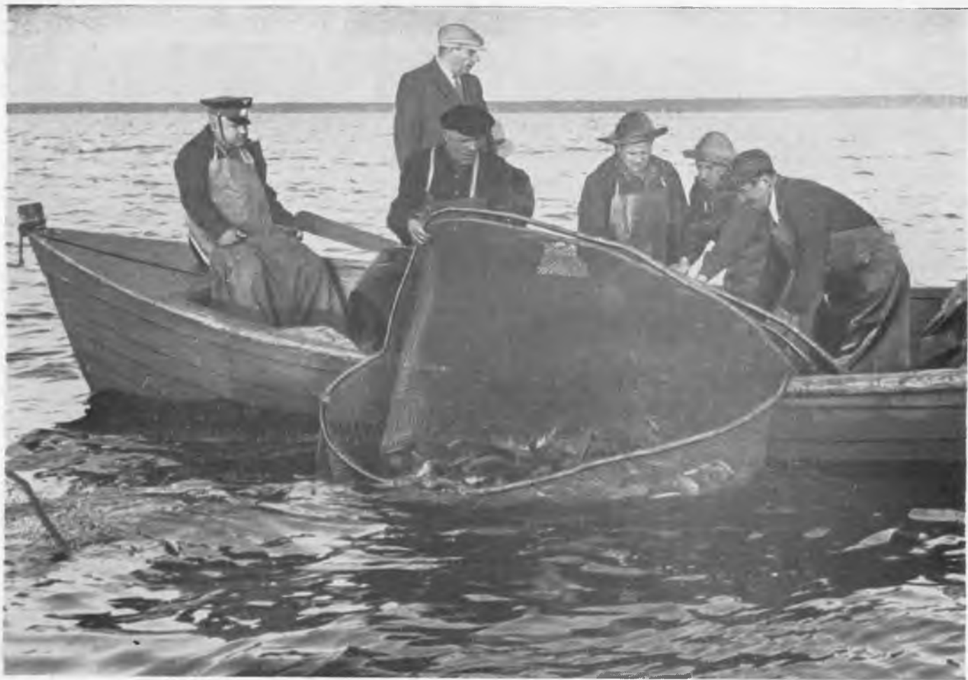
Улов оказался богатым...