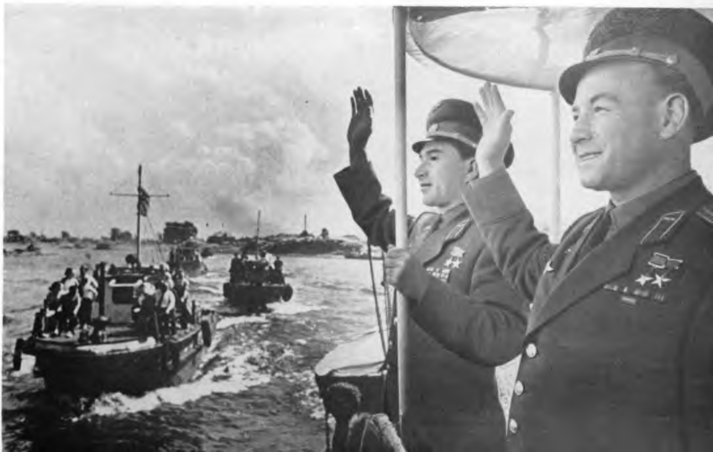
П. И. Беляев и А. А. Леонов прощаются с сокольчанами.