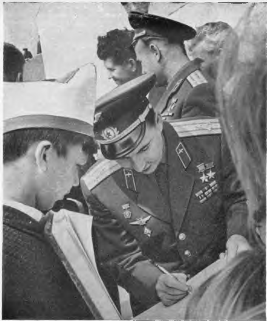
Автограф — на память.