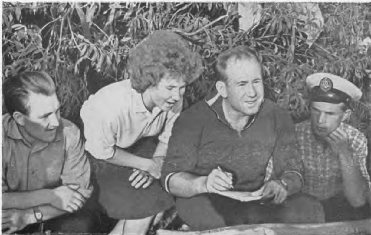
Как известно, А. А. Леонов не только космонавт, но и художник. Вот и сейчас, в минуты короткого отдыха на берегу Кубенского озера, он делает зарисовки с натуры.