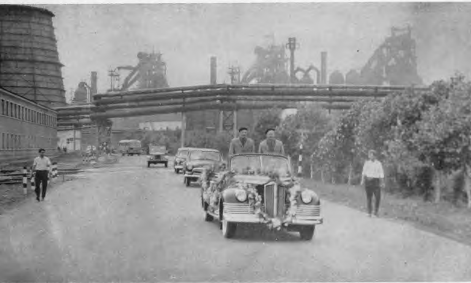
Кортеж автомобилей въезжает на территорию Череповецкого металлургического завода.