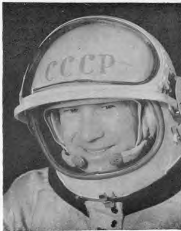
Летчик-космонавт СССР А. А. ЛЕОНОВ