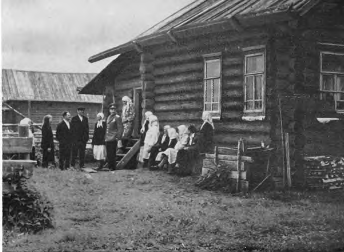
В родном Челищеве.