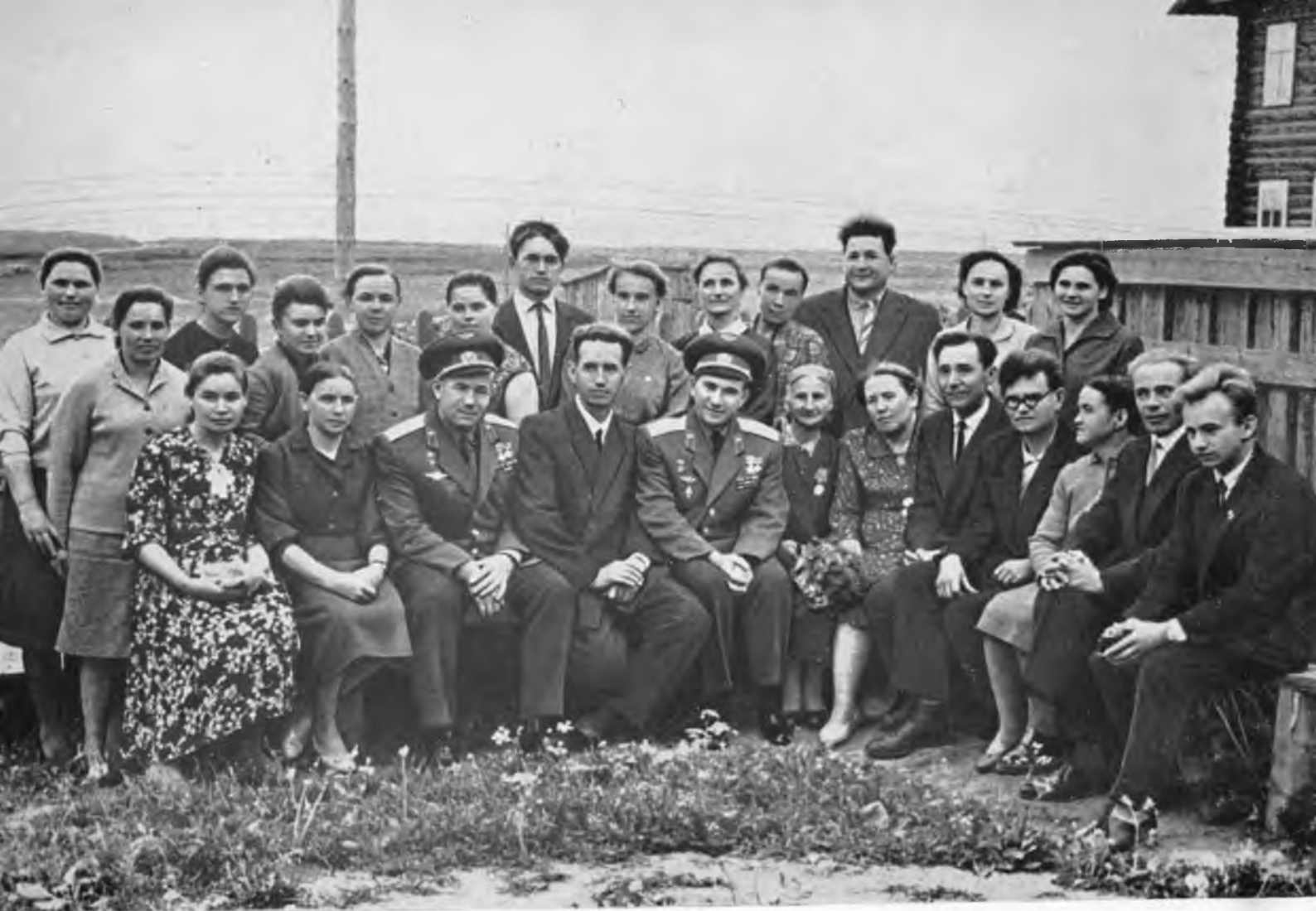
Снимок на память — А. А. Леонов и П. И. Беляев со своими земляками в Рослятинне.