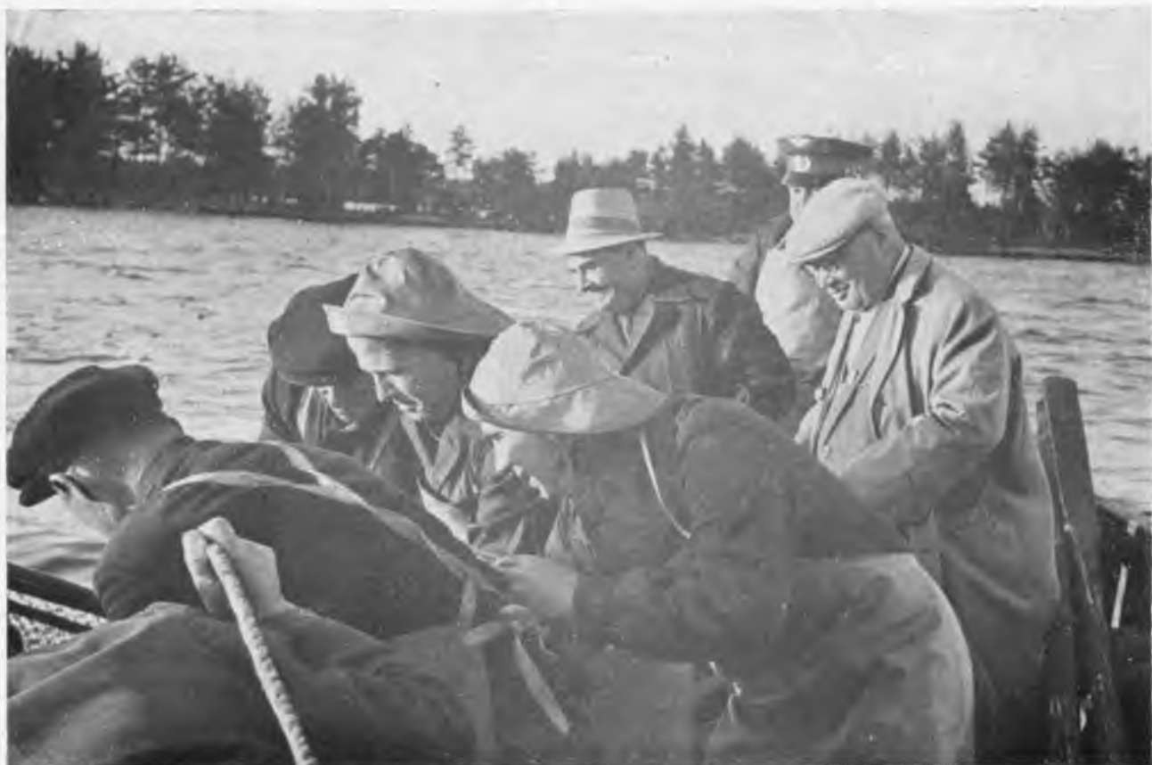
На сотни километров раскинулось Рыбинское водохранилище. Приехав в гости к рыбакам, космонавты сами решили испытать рыбацкое счастье.