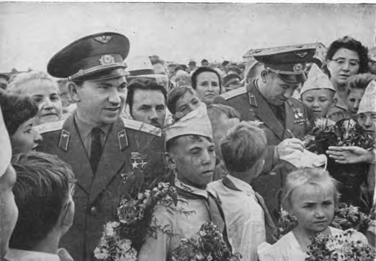
П. И. Беляев и А. А. Леонов в кругу пионеров.