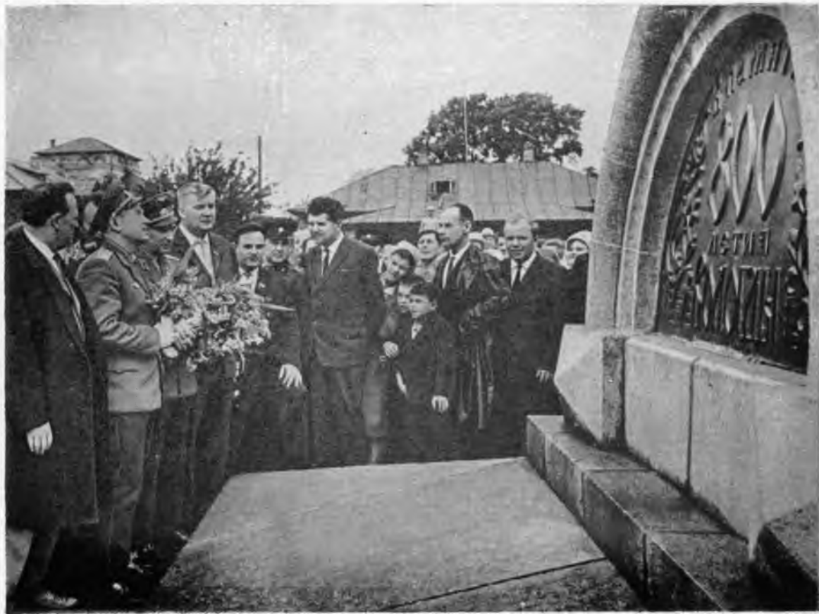
Герои-космонавты осматривают монумент в честь 800-летия Вологды.