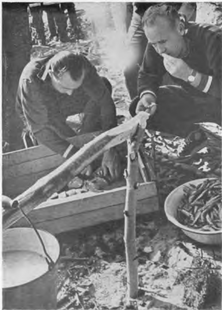
Около рыбацкого костра.