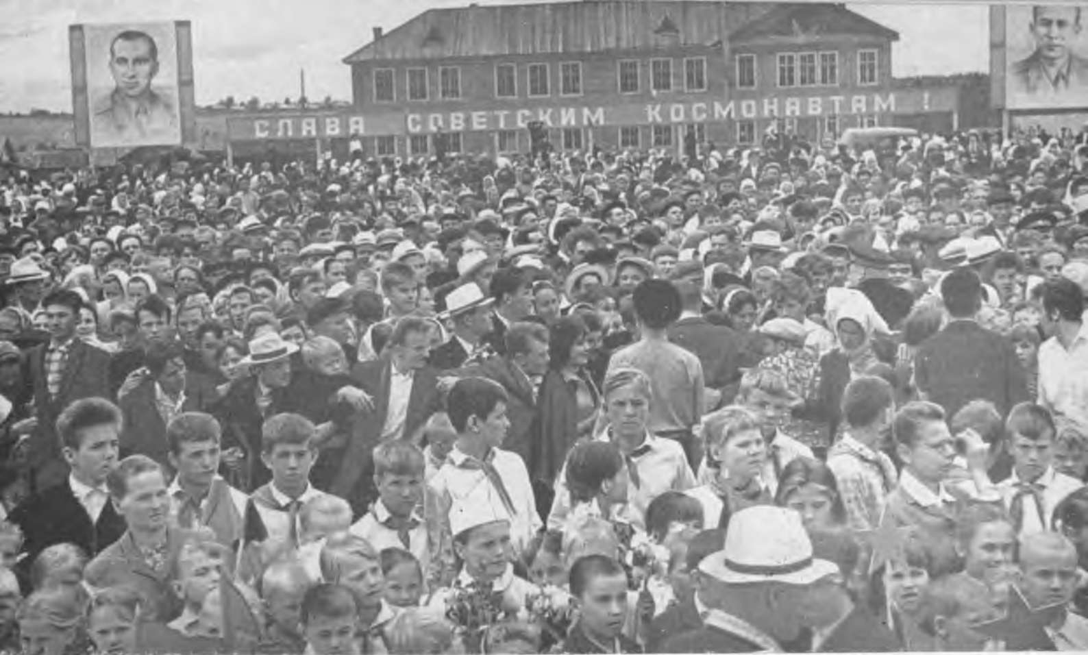
Все жители села Рослятино и окрестных деревень пришли на встречу с космонавтами.