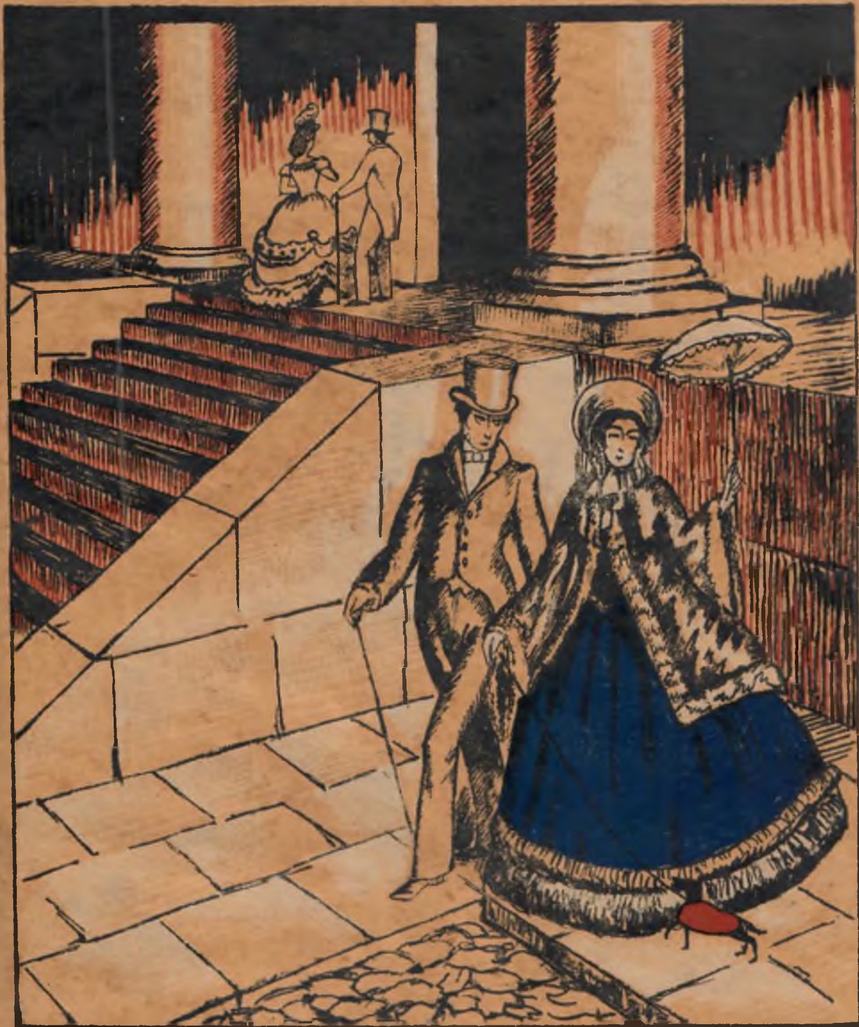
РОССИЯ 1855 - 65 гг.