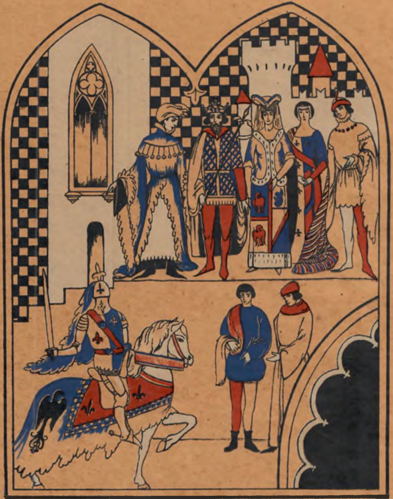
Франция XIV стол.