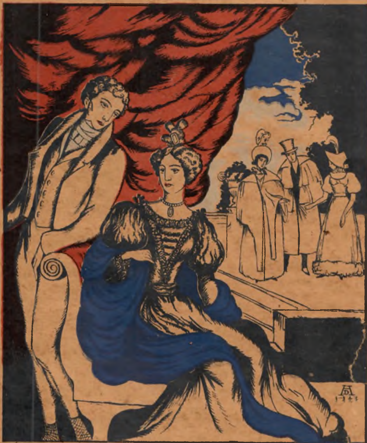
РУССКИЕ МОДЫ 1820-30